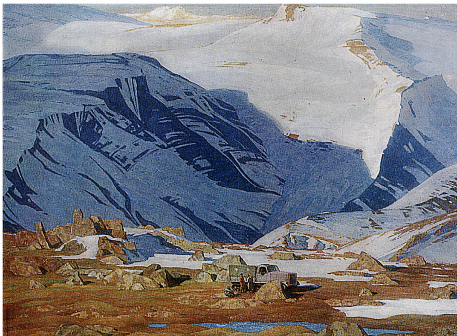
Н. Г. Чесноков. Урал Приполярный. Малая земля. 1974 г. Холст, масло. 138 × 182