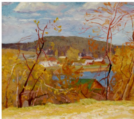
Н. Г. Чесноков. Радостный день. 1997 г. Холст, масло. 32,5 × 35. Собственность семьи художника