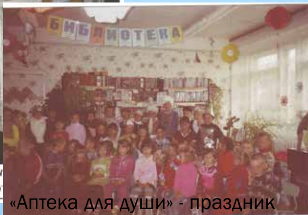
«Аптека для души» - праздник Дня библиотек