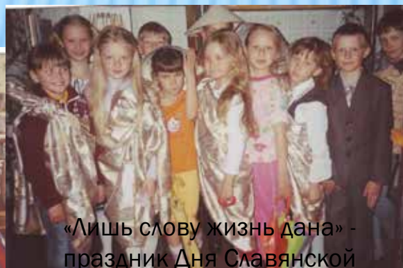
«Лишь слову жизнь дана» - праздник Дня Славянской письменности и культуры

Библиотека сменила место жительства, переехав в 2003 году в здание детсада «Родничок». Здесь уютно и просторно, а главное, тепло. Поэтому сюда с удовольствием приходят как взрослые, так и дети. Сколько разных праздников, интересных встреч было проведено за это время в библиотеке.