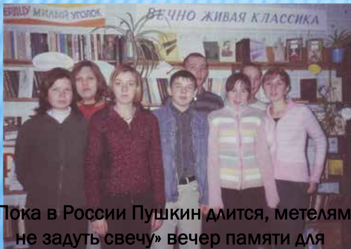
«Пока в России Пушкин длится, метелям не задуть свечу» вечер памяти для учащихся 11 класса