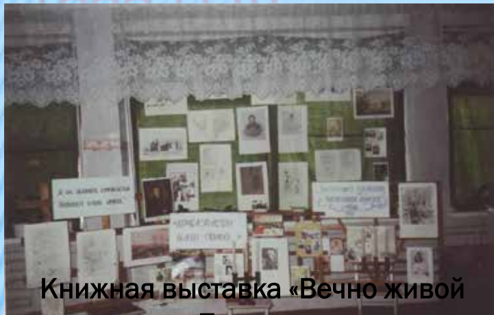
Книжная выставка «Вечно живой Пушкин»