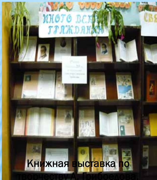
Книжная выставка по творчеству А. Грибоедова