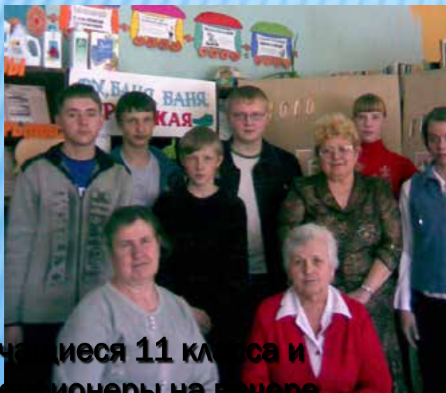
Учащиеся 11 класса и пенсионеры на вечере, посвященном А. Грибоедову

Библиотекарь начинает работать по программе