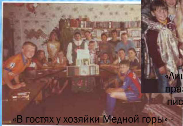
«В гостях у хозяйки Медной горы» - игра-соревнование