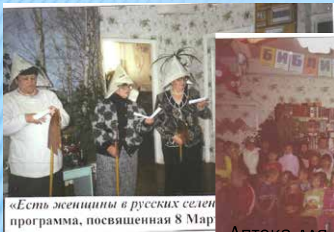
«Есть женщины в русских селен программа, посвященная 8 Мар