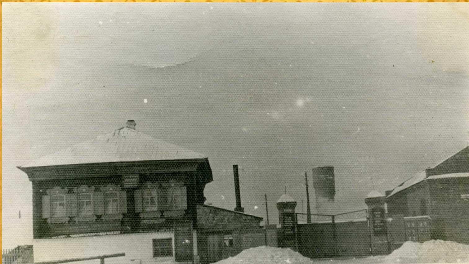
Здание ковровой фабрики в 60-е годы