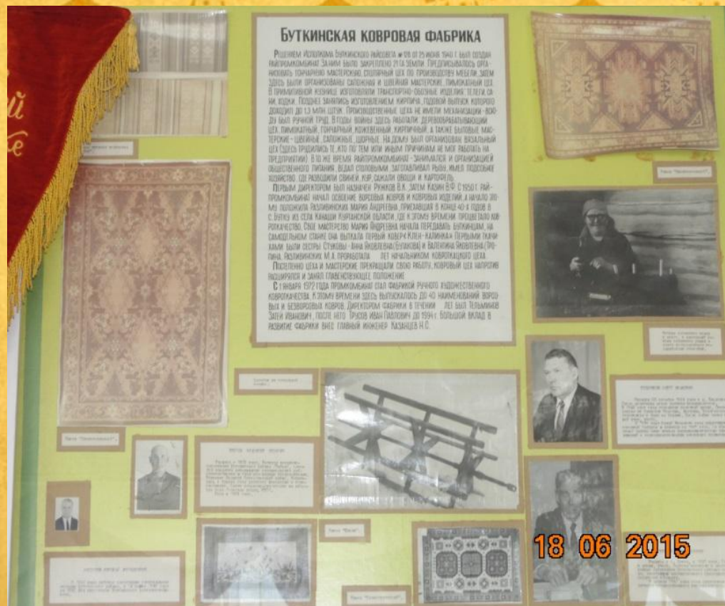
Стенд посвященный истории ковровой фабрики в музее при МКОУ «Буткинской СОШ»