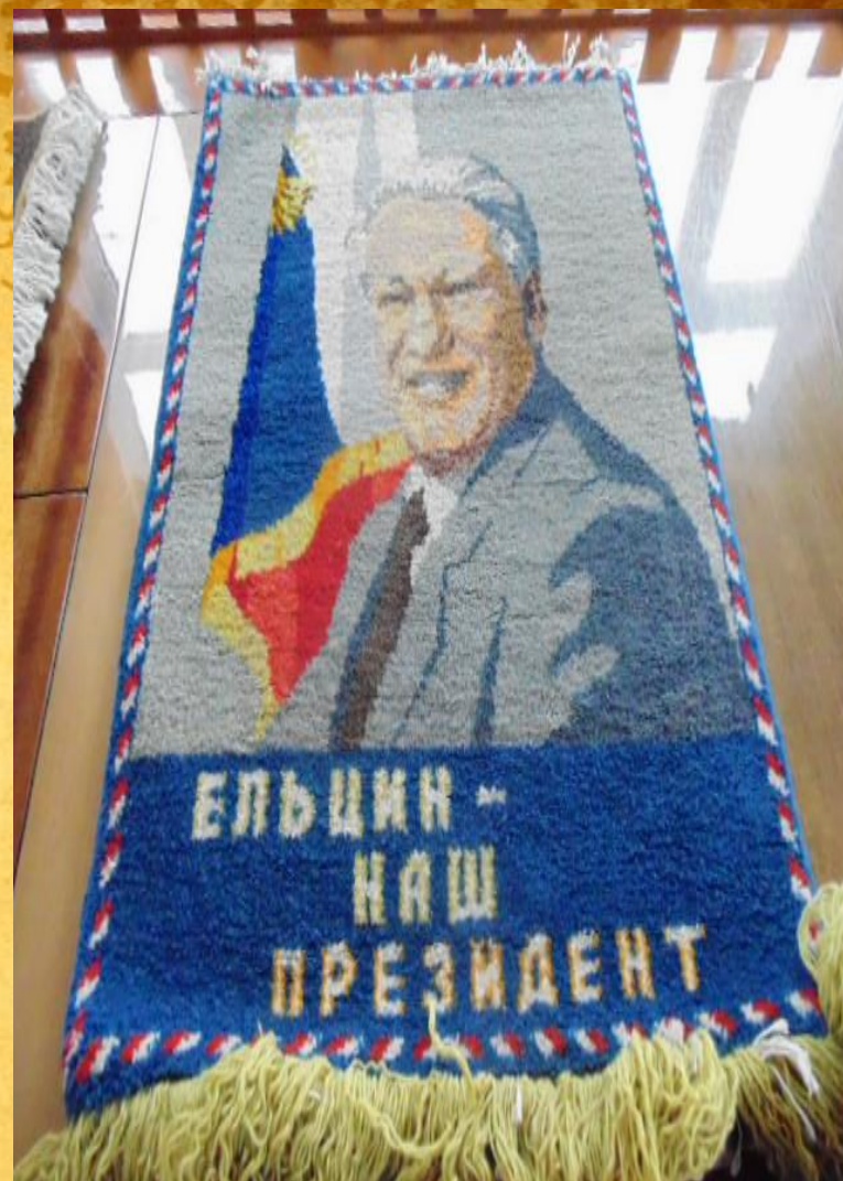
фото ковров из архива бывшего музея самой ковровой фабрики