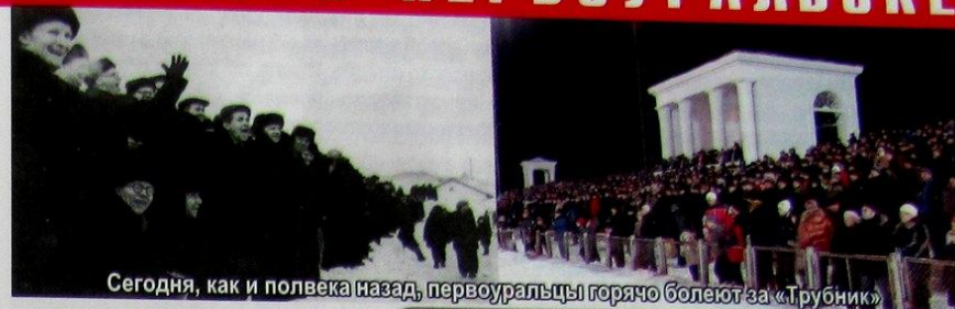
Сегодня, как и полвека назад, первоуральцы горячо болеют за «Трубник»