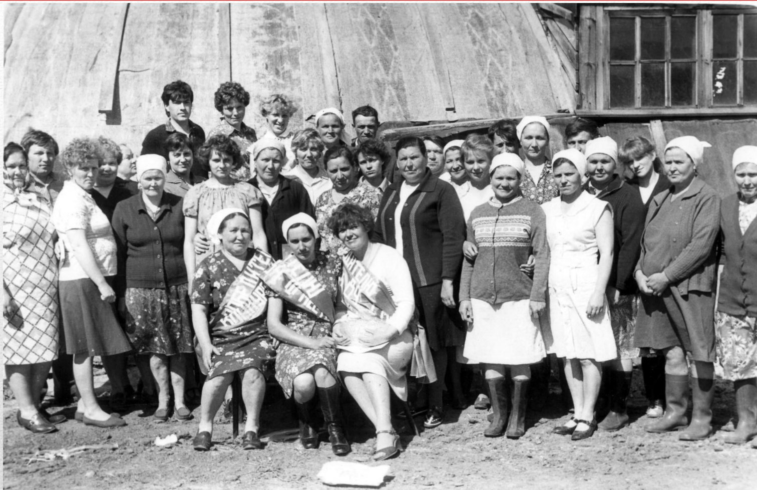
Коллектив молочно-товарной фермы – победитель областного социалистического соревнования работников сельского хозяйства