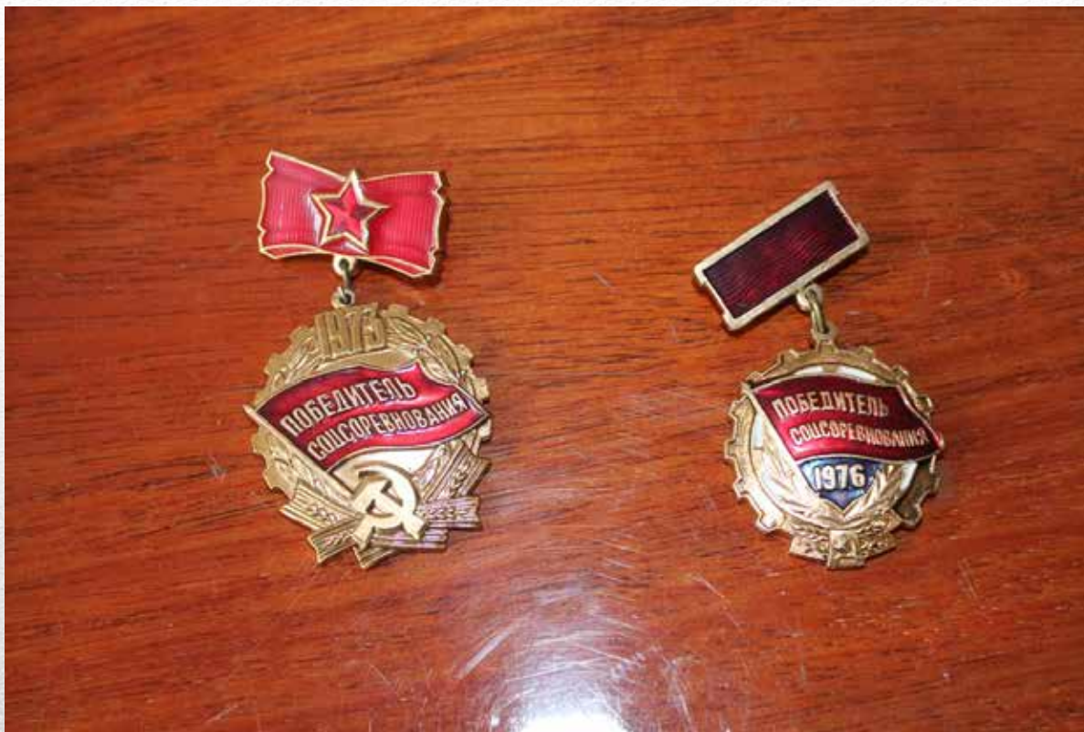
Значки «Победитель соцсоревнования» 1973 г. и 1976 г.