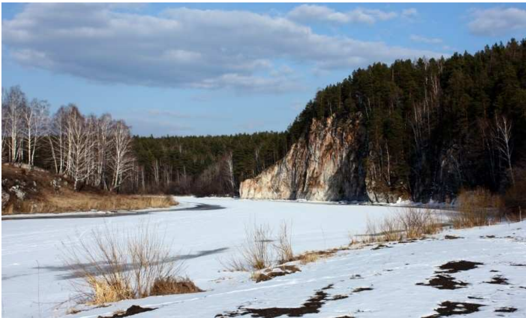
5. Скалы «Старики».