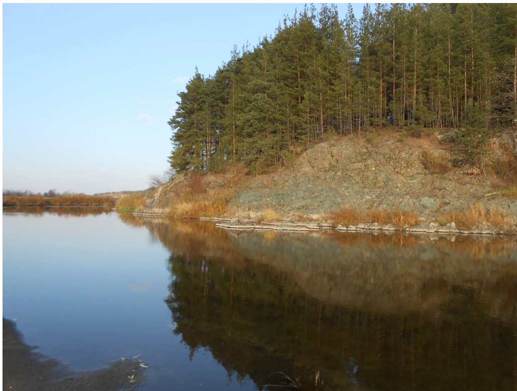
12. «Синий камень».

К осени справили небольшой дом, сделали запасы из грибов и ягод. Костя ходил на охоту – голодом жену не морил. Прошла зима, к весне в дальних поселениях выменял на шкурки соху и плуг, но самое главное – появилась в хозяйстве лошадь.