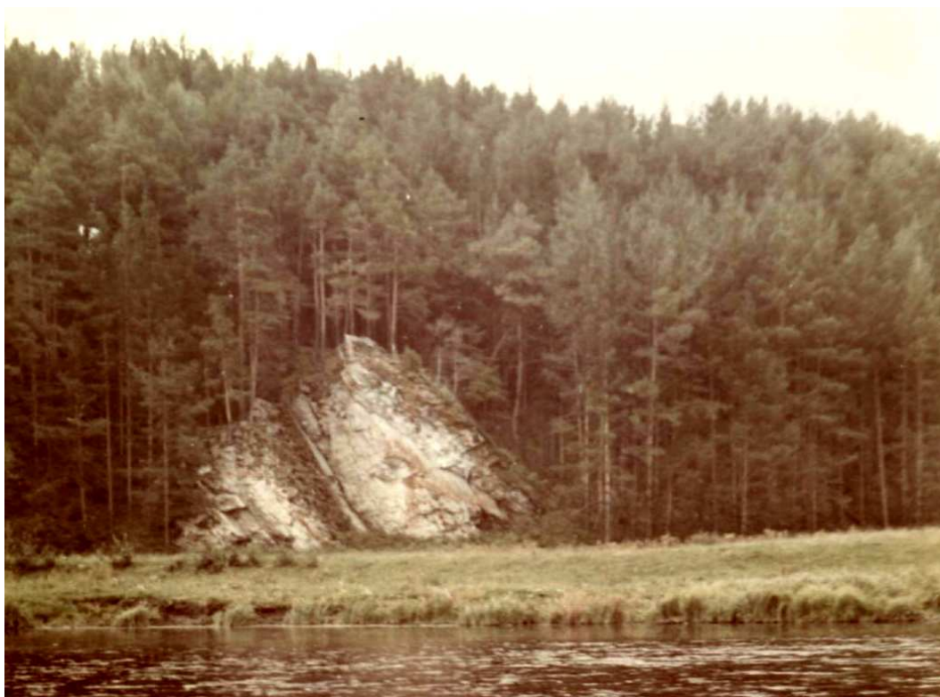
3. Камень «Основанский».

Камень «Основанский» на правом берегу реки Реж, выше села Коптелово. Скалистые обнажения горных пород, покрытые лесом.