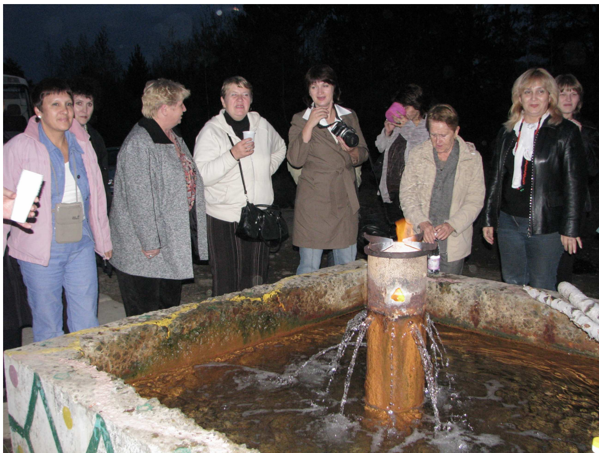
28. Источник в селе Болотовском