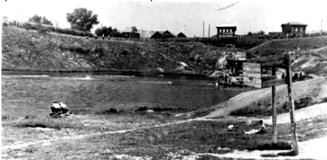
22. Кукуйская яма.

- На перегонки саженками плавать научу! Шучу ребятки! Отплавал я своё. А сейчас моё стариковское дело на солнышке кости греть!