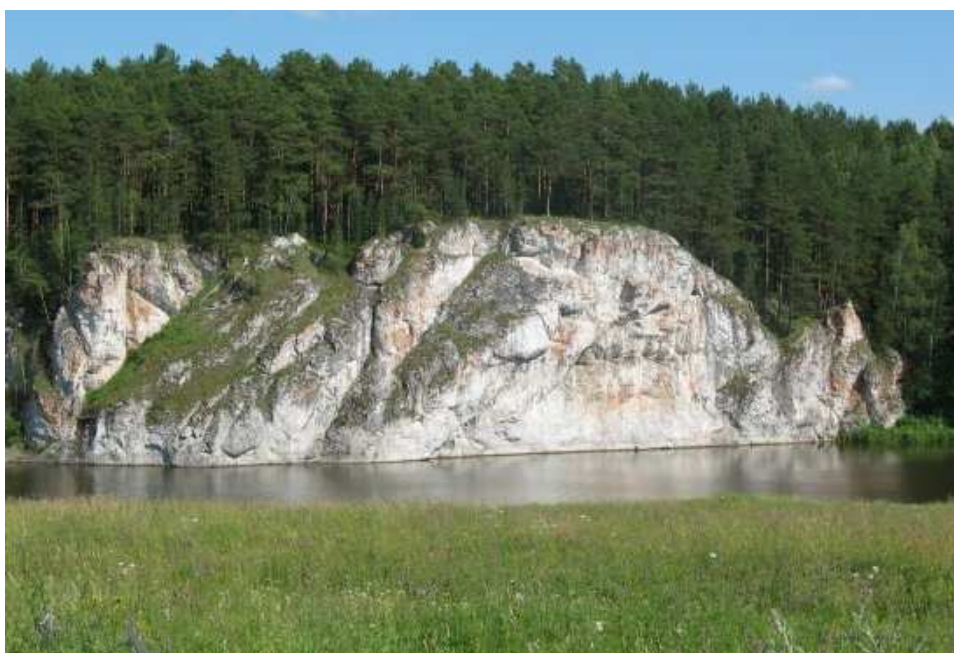
9. Скалы «Старики».

- Я вышла из трудового народа и верю его делу! – едва слышно произнесла измученная белыми старушка. Исполосованной спиной она стояла в сторону пропасти.