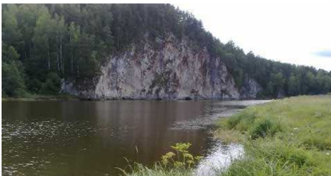
8. Скалы «Старики».

Бытующая сейчас среди народа легенда скромно рассказывает о том, что в грозные годы гражданской войны, когда на уральской земле свирепствовал царский адмирал Колчак, на распаде между двух высоких скал притаилась приземистая избушка лесника.