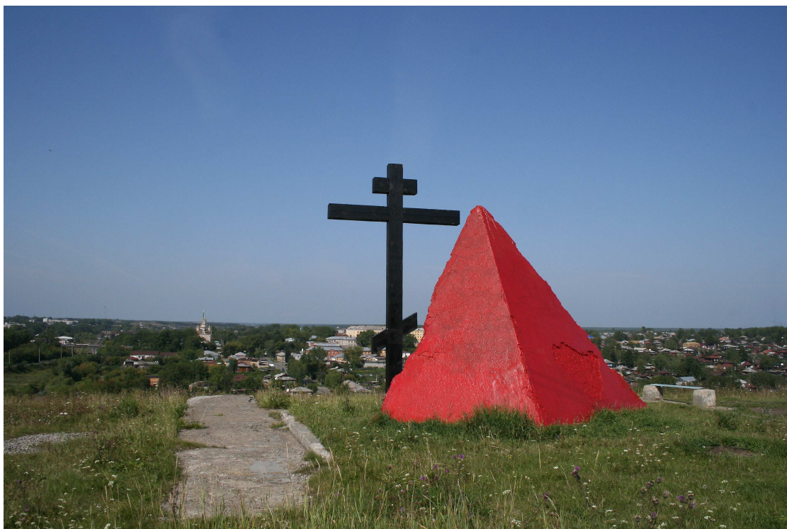
14. Гора Ялуниха.

У её подножия, на слиянии рек Нейвы и Алапаххи (Алапайки), возникло в 1639 году первое поселение. В предвоенные годы на горе был разбит первый плодовый сад. А в 1965 году поставлен первый памятник участникам и героям Великой Отечественной войны.