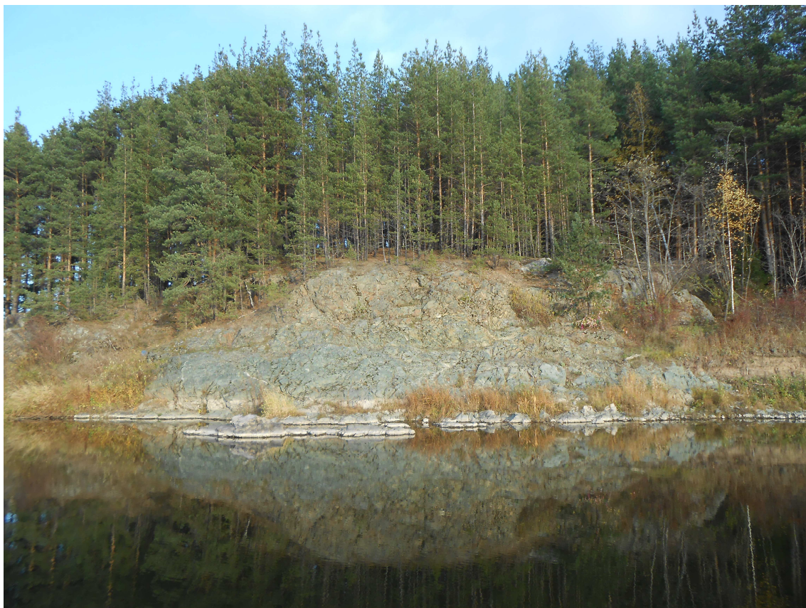
13. «Синий камень».

В селе и сейчас много синеглазых жителей. Старожилы утверждают, что это потомки Кости и Сони. А Синий камень и по сей день любимое место отдыха сельчан.