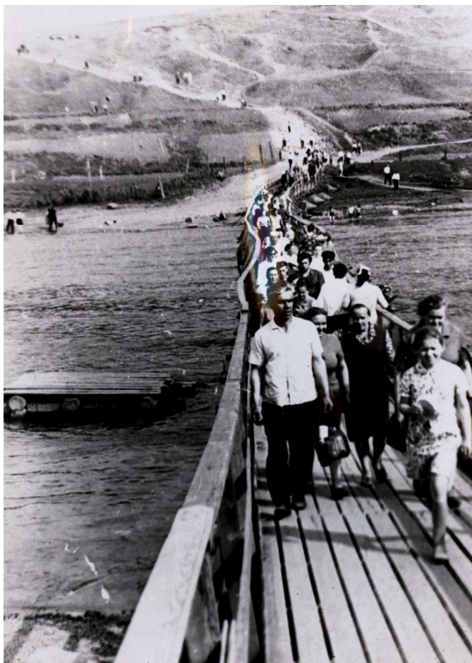
15. Горожане спускаются с горы с Праздника песни. 70-е годы