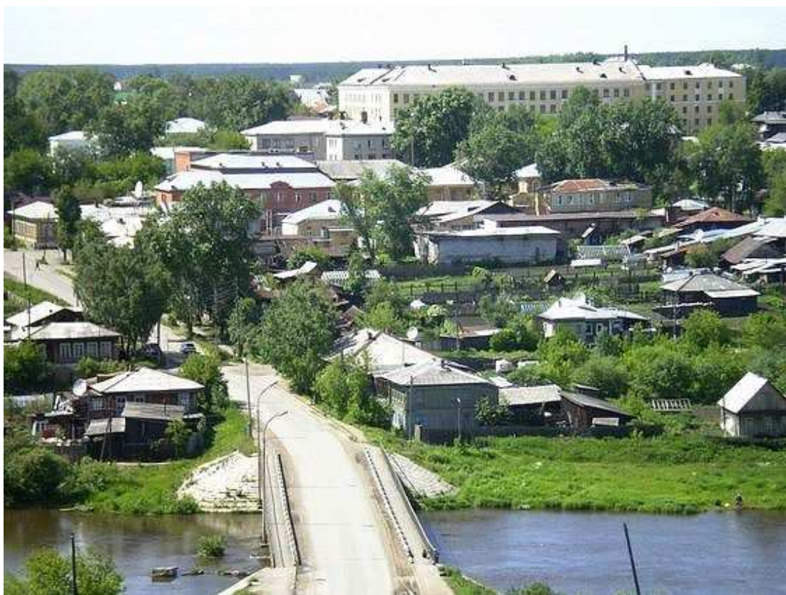
16. Вид на город с горы Ялунихи