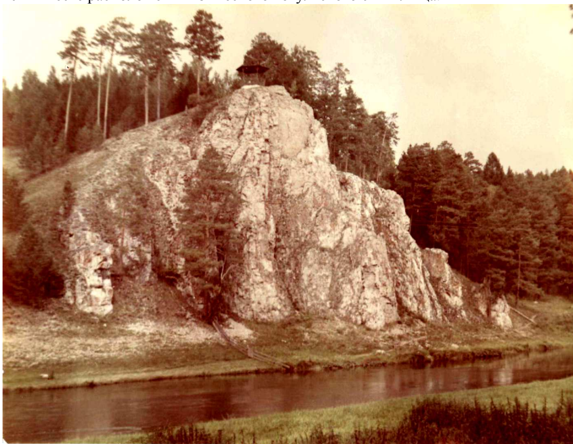
1. Камень «Шайтан».

К амень «Шайтан» в двух километрах от посёлка Зыряновский. Предположительно находится в месте расположения языческого вогульского святилища.