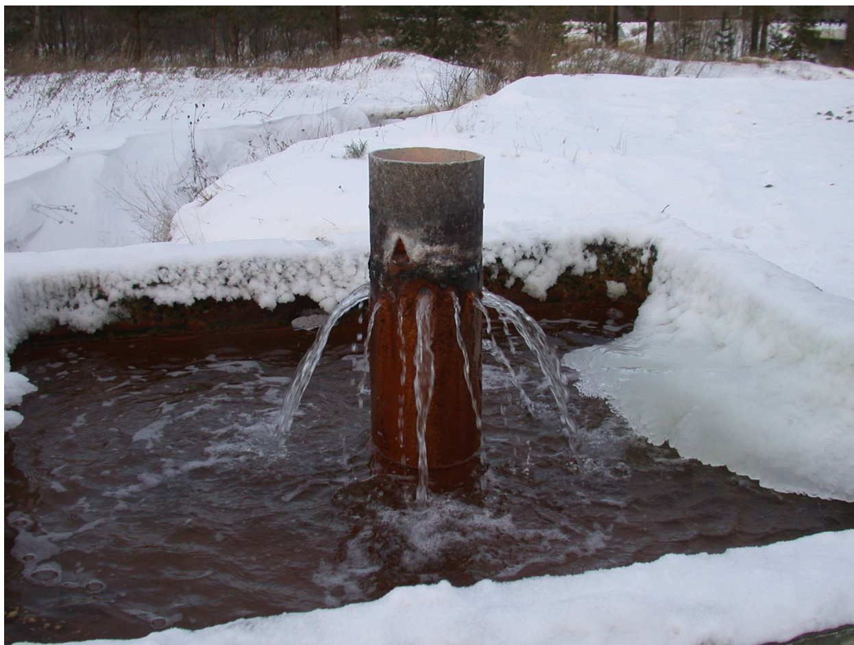
27. Источник в селе Болотовском