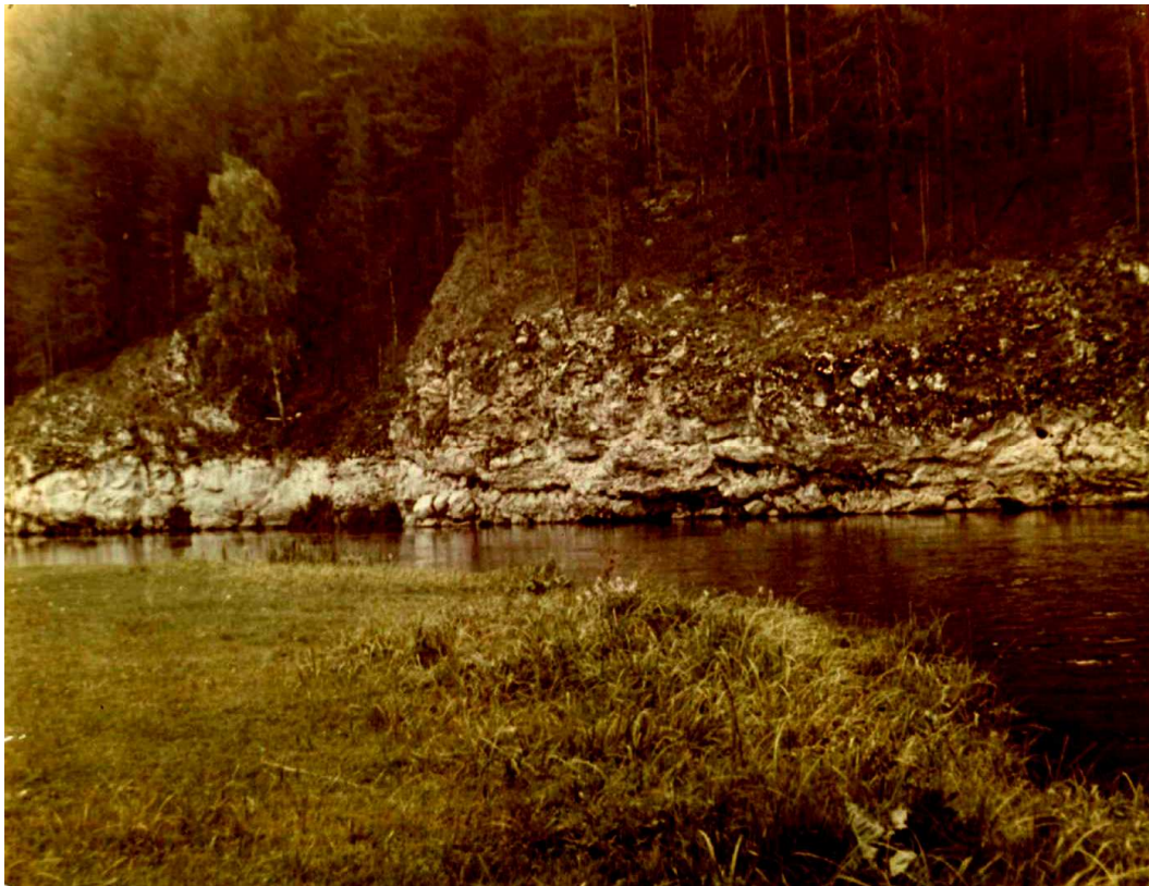
2. Камень «Крутой».

Камень «Основанский» на правом берегу реки Реж, выше села Коптелово. Скалистые обнажения горных пород, покрытые лесом.