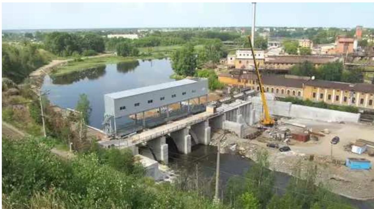
20. Вид с горы Ялунихи на новую плотину.