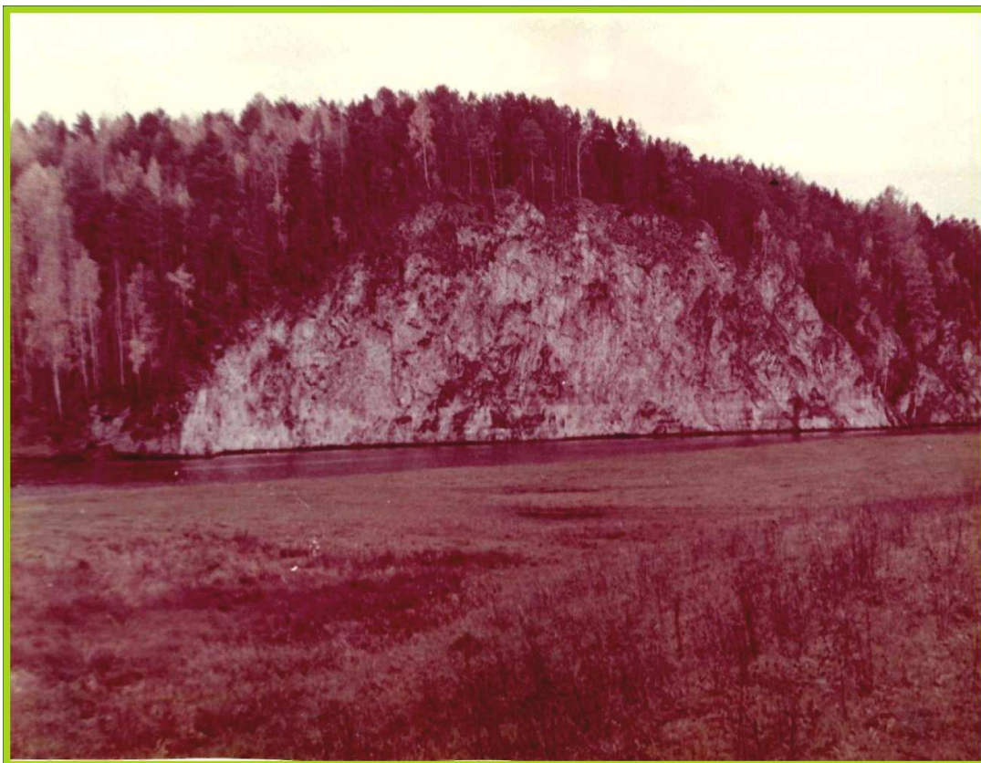
7. Скалы «Старики».