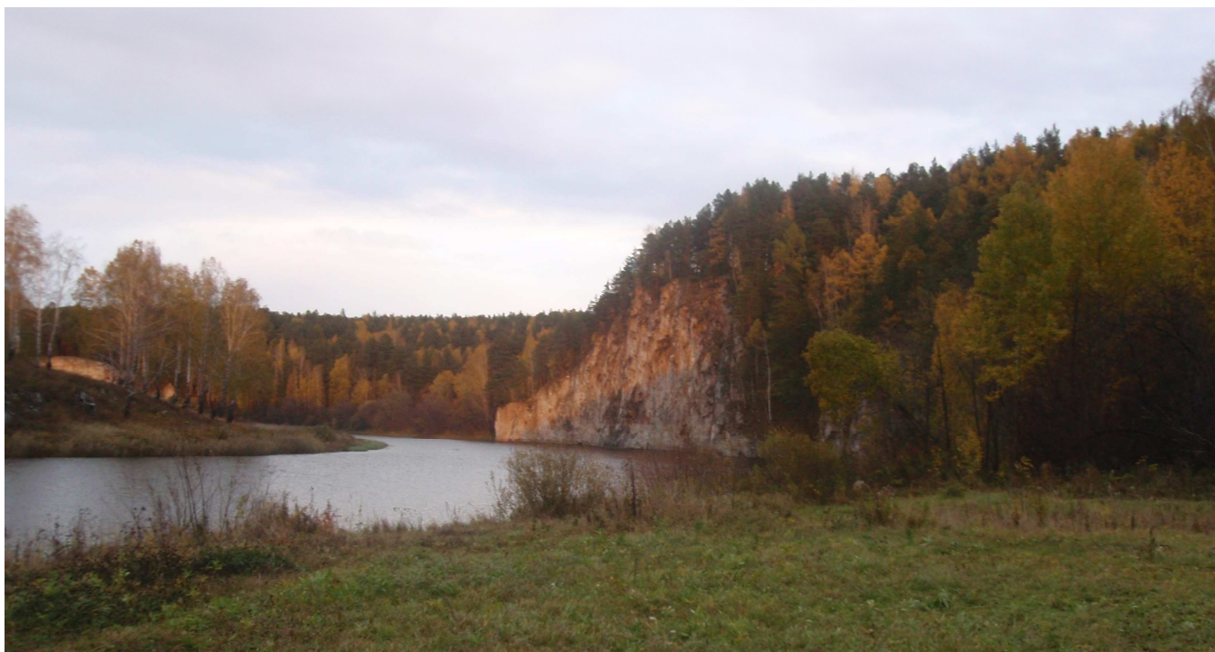
4. Скалы «Старики».