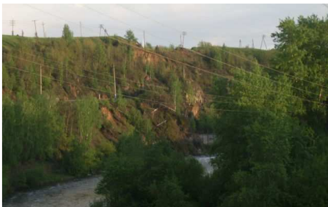
18. Гора Ялуниха.