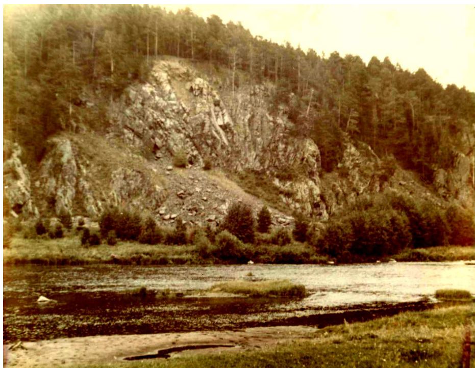
10. Скалы «Семь братьев».