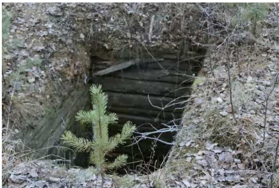
24. Копи.