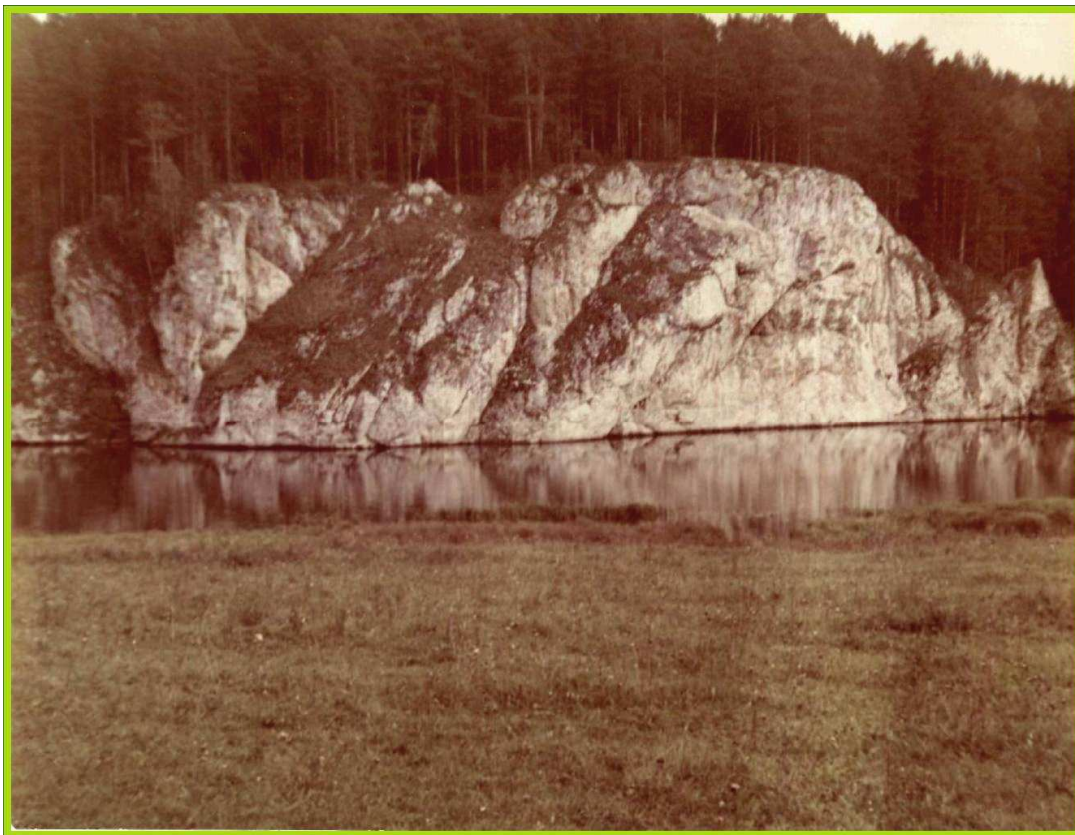
6. Скалы «Старики».

утесами и прислушаться, то в ясную-ясную погоду можно уловить мелодичные звуки. Те, кто слышал их, уверяют: это Ки поет песню Стару. Бесконечную песню любви и верности. Прислушайтесь, может, услышите. А мне не довелось, врать не стану.