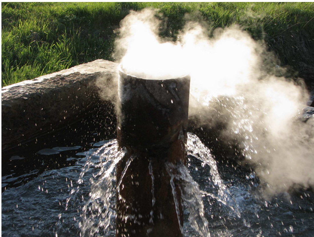
26. Источник в селе Болотовском