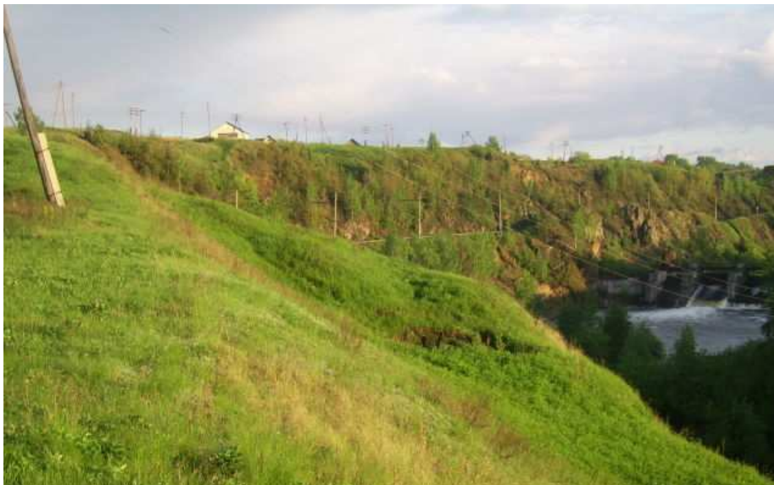
19. Гора Ялуниха. (фото О. Серёдкиной)