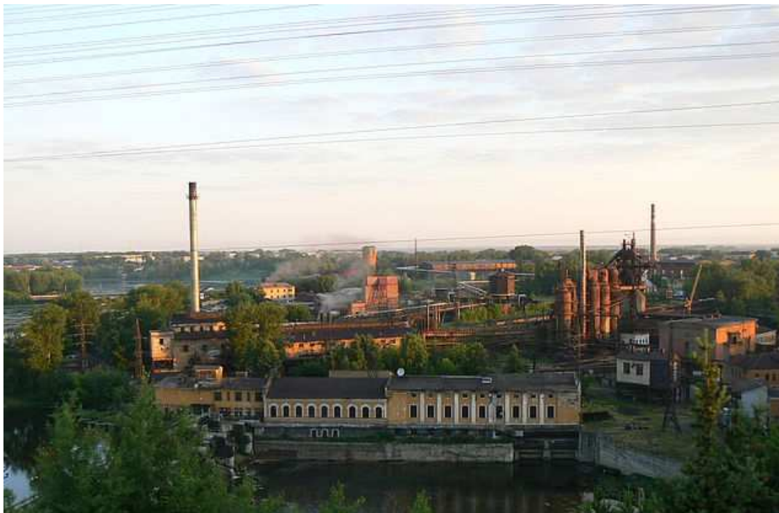
17. Вид на Алапаевский металлургический завод с горы Ялунихи