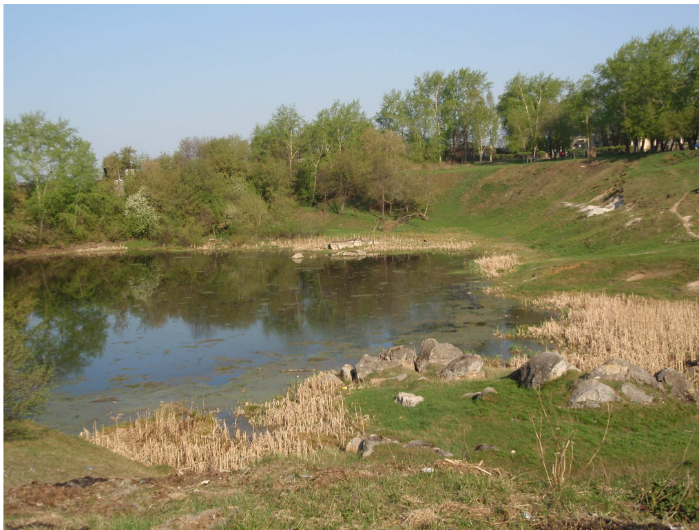
21. Кокуйская яма

С Кокуйской ямой связано несколько городских легенд и преданий.