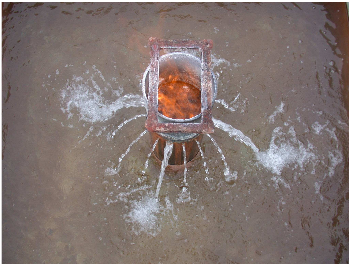
25. Источник в селе Болотовском