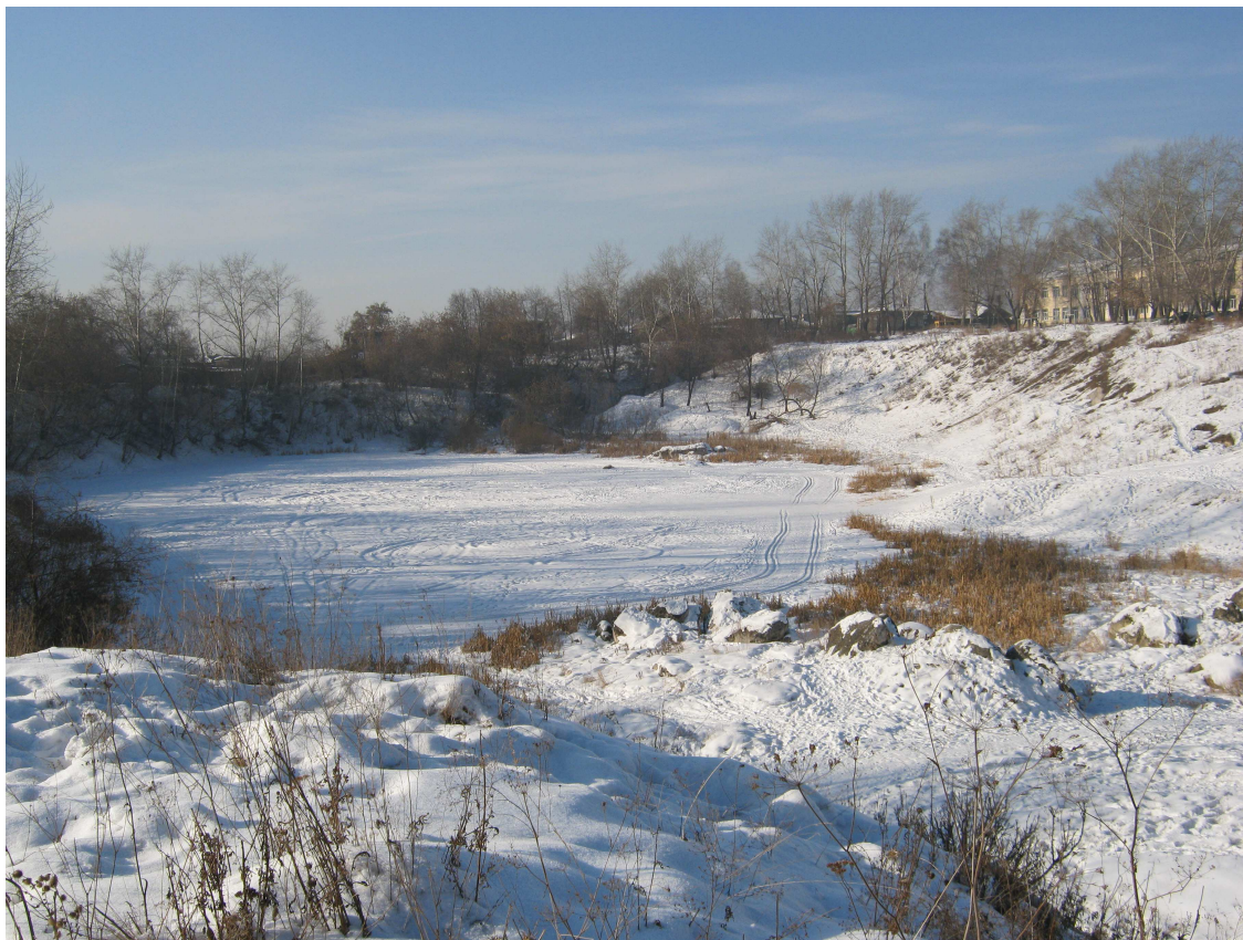
23. Кукуйская яма

С держало ли заводское начальство своё слово – заплатить золотым рублём за прорытый подземный сток – не слышал, а проход под землёй к речке был прорыт. Одни называли его «Царскими воротами», а другие – «Золотыми».