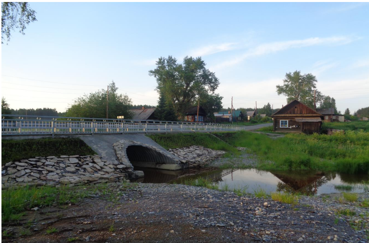
Мост через р.Воронка, дер.Воронино, 2015г.