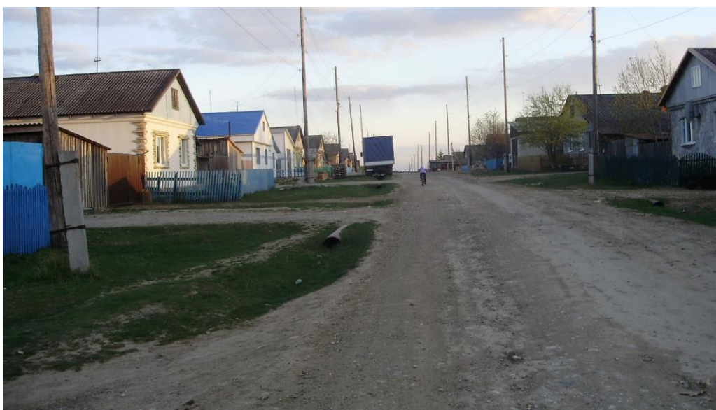
ул. Красные горки.