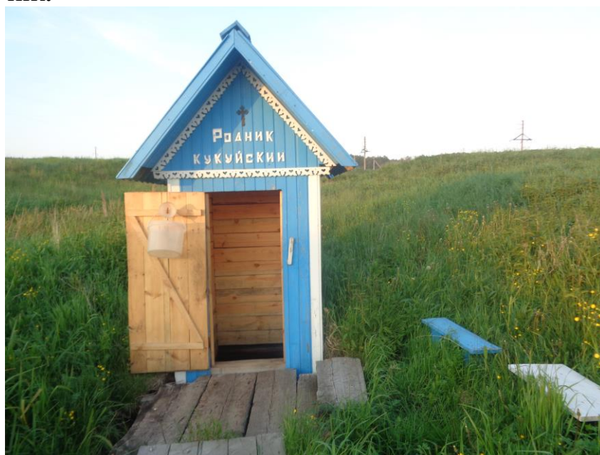
Родник Кукуйский (настоящее время)