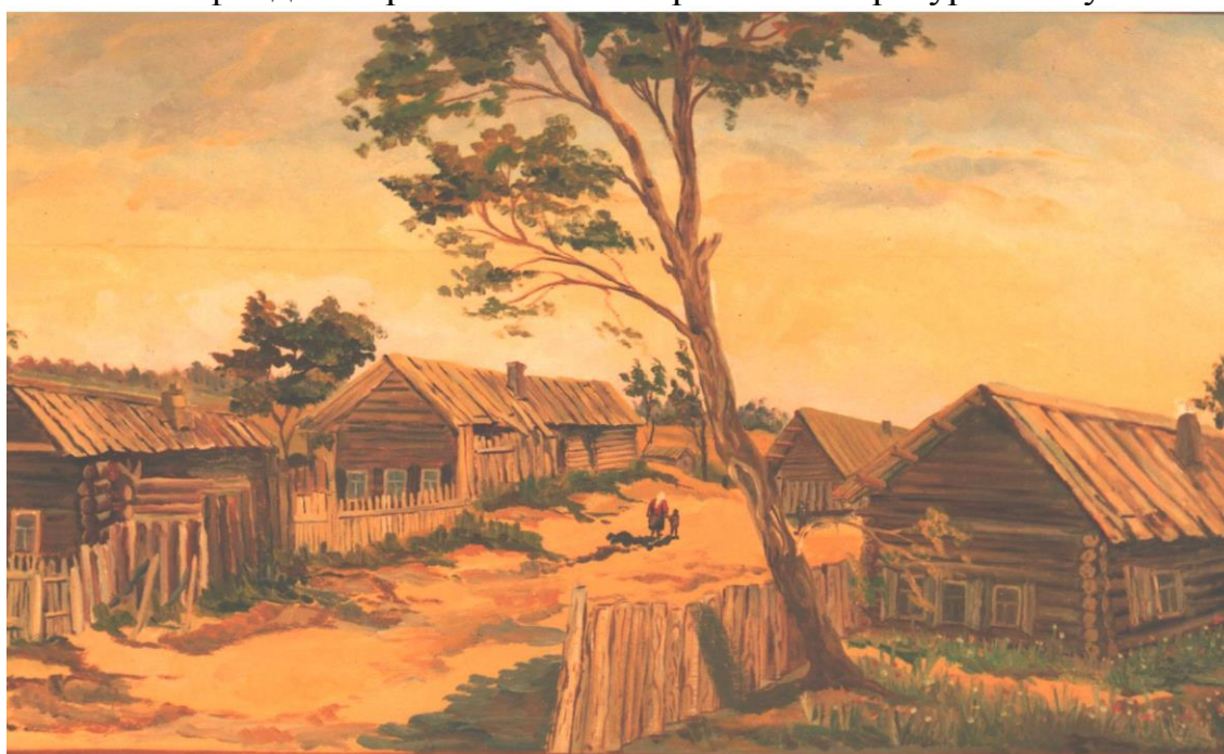
Улица Кукуй – прародительница с.Черемисского.