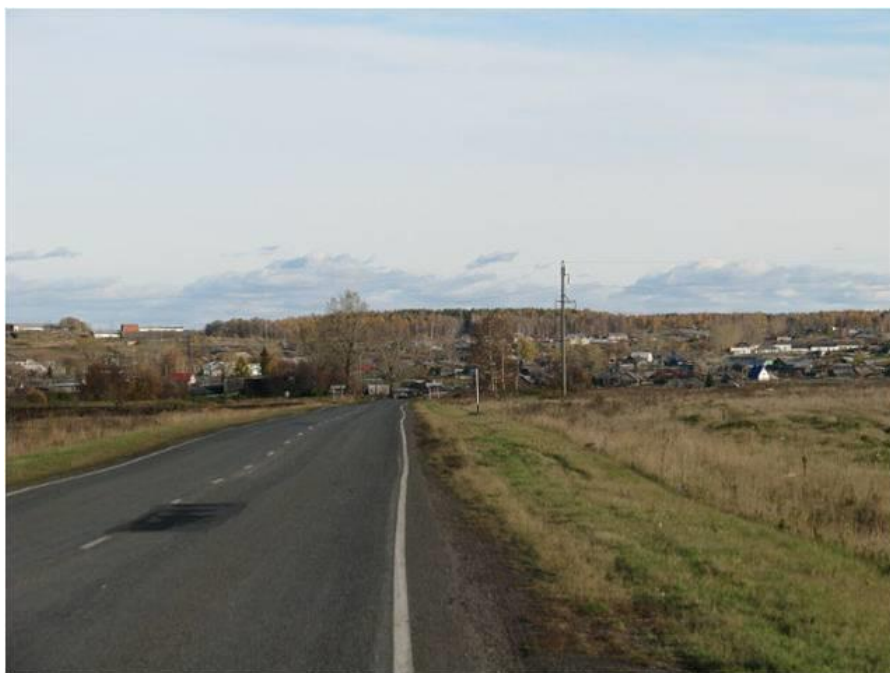
Вид с.Черемисского с Невьянского тракта.