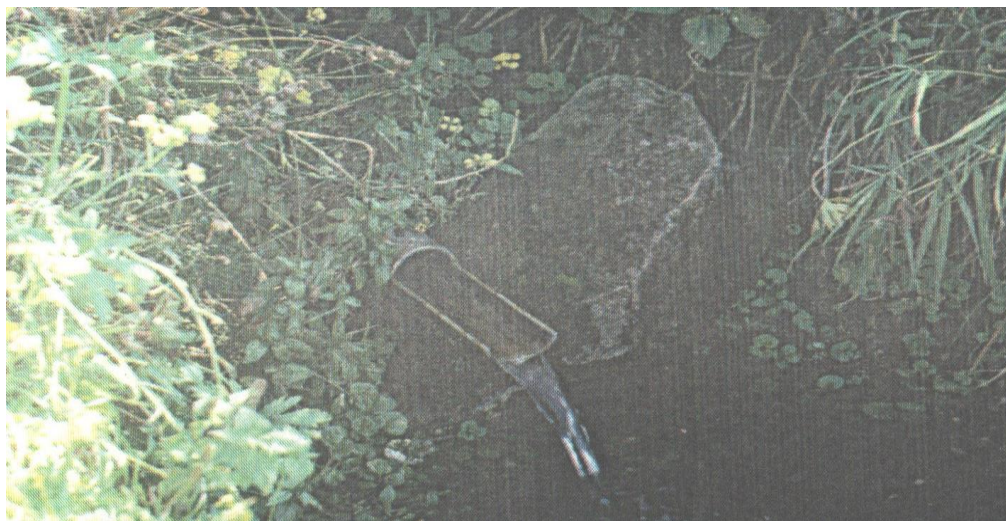
Макаров ключ 1990-е годы.

Из фондов Черемисского историко – литературного музея, Фонд Шабунина В.И., 2006г.