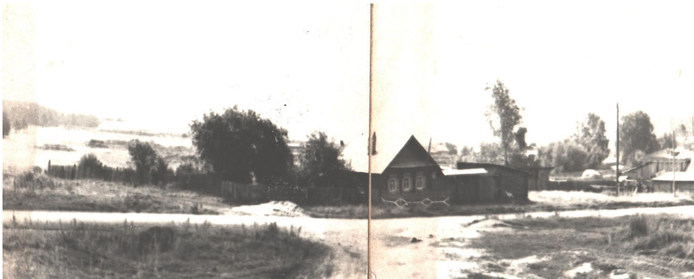
дер. Воронино в 1970-е годы.