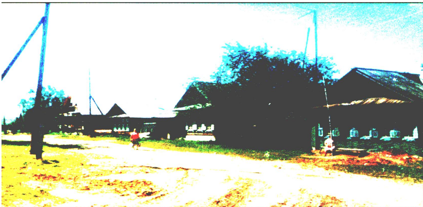
ул.К.Маркса 1990-е годы.