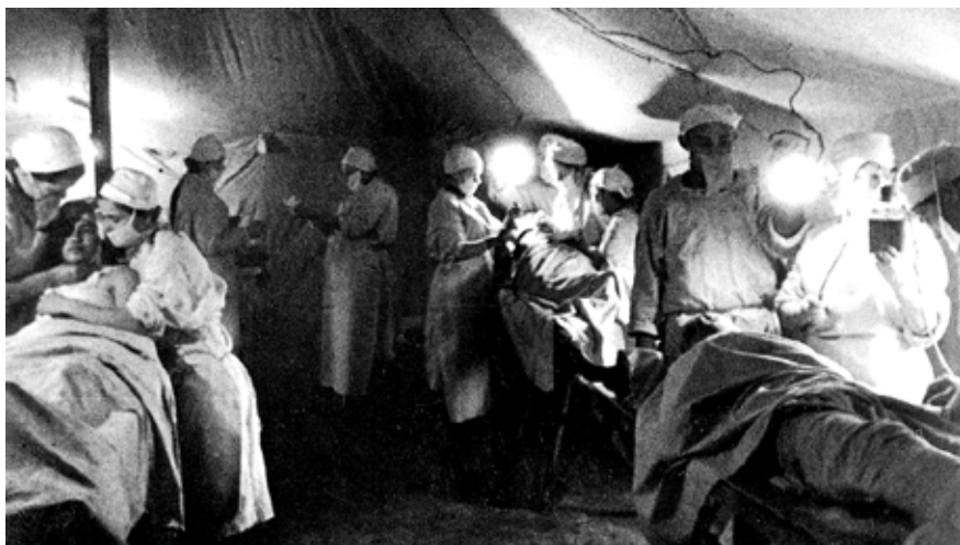
Операции в эвакогоспитале в годы войны.

За участие в Великой Отечественной войне приказом командующего 3 Белорусским фронтом № 0878 от 5.11.1944 г. она была награждена медалью «За боевые заслуги». Сама же всегда скромно говорила о себе: «Я ведь не воевала».