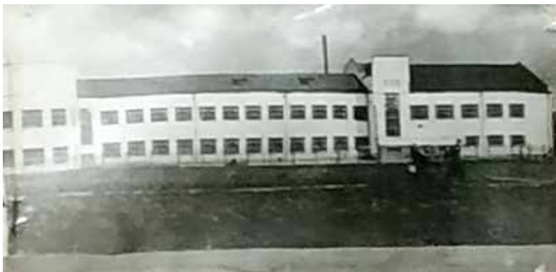
Первоуральск. Школа № 7, где размещался госпиталь 3747. Фото из музея школы № 7.