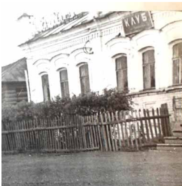
Рисунок 2 Клуб им. Томилова