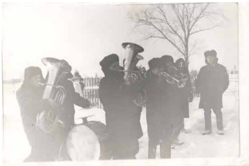
Духовой оркестр.