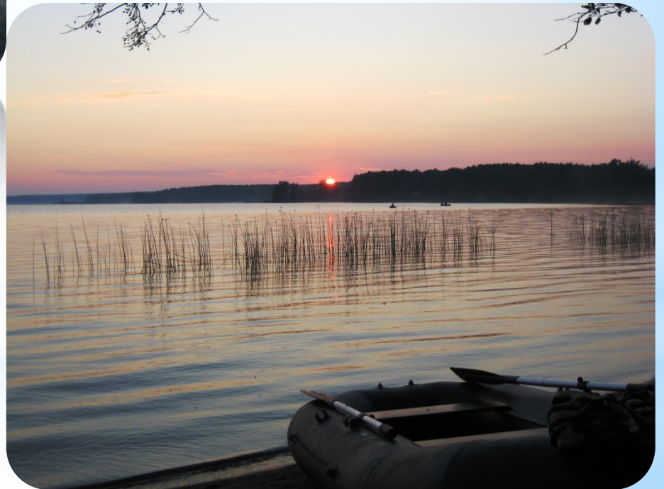
№6 Розовый закат