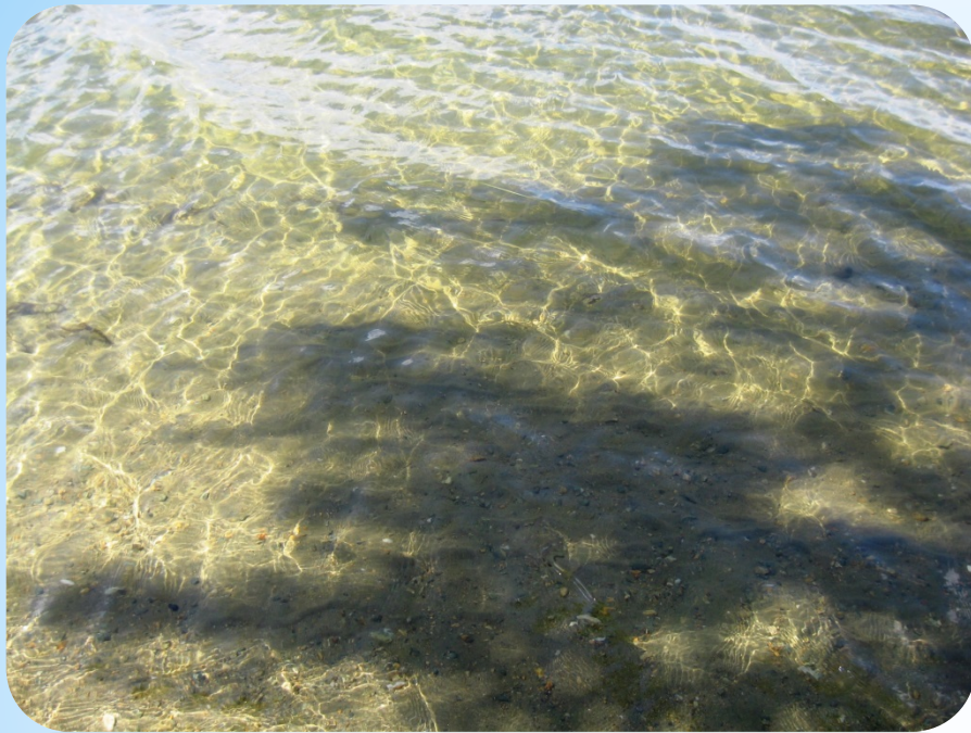
№5 Мраморный узор на воде