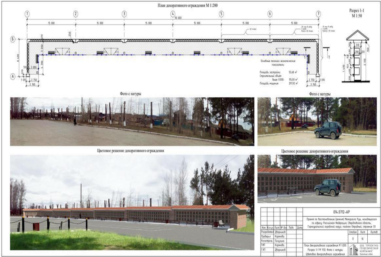
План декоративного ограждения мемориала

В год 75-летия Победы – реконструкцию удалось провести. Средства в сумме 19 млн. рублей были выделены в рамках федеральной программы «Увековечение памяти погибших при защите Отечества».