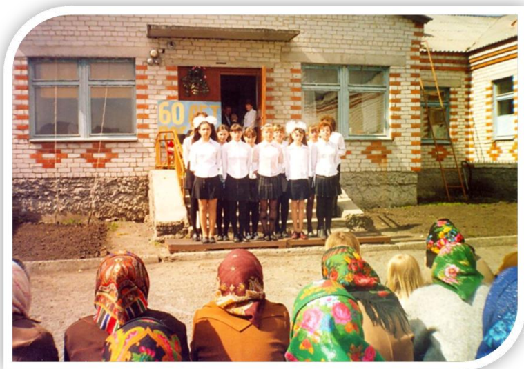
Школьный концерт в День Победы

Много массовых мероприятий проходит на территории школы: Масленица, День Победы, Сельские сходы, утренники к праздничным датам, День пожилых людей. Дети во главе с педагогами показывают небольшие концерты своим гостям, принимают участие в районных соревнованиях, защищая свою территорию.