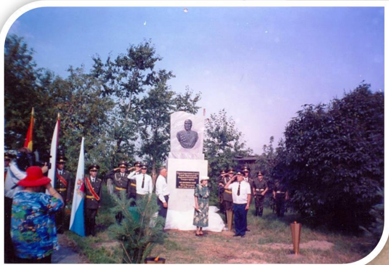
Открытие нового монумента 30 июля 2006 г.