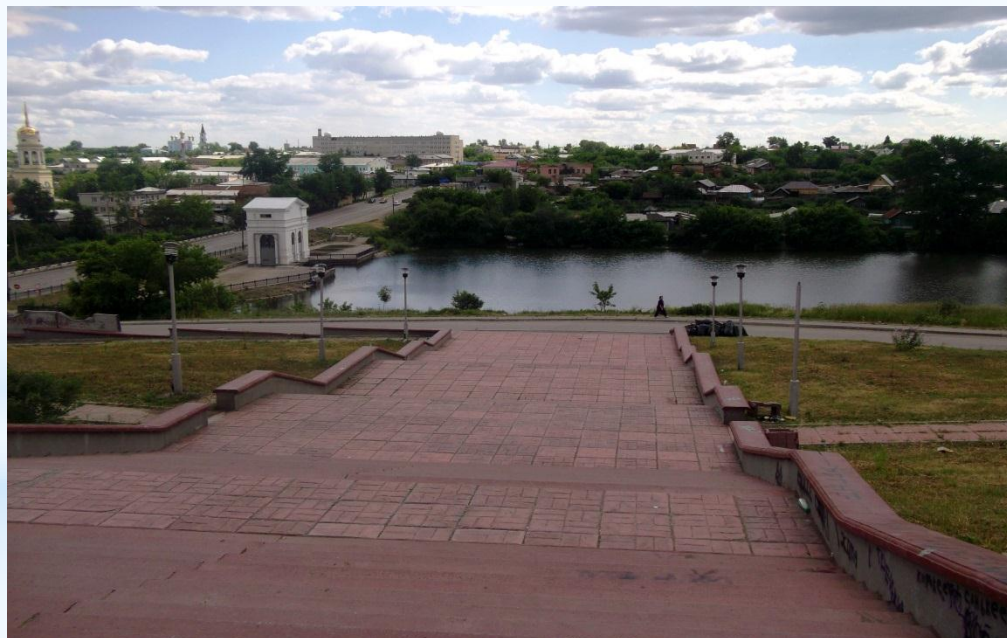
г. Каменск-Уральский 2013 г.