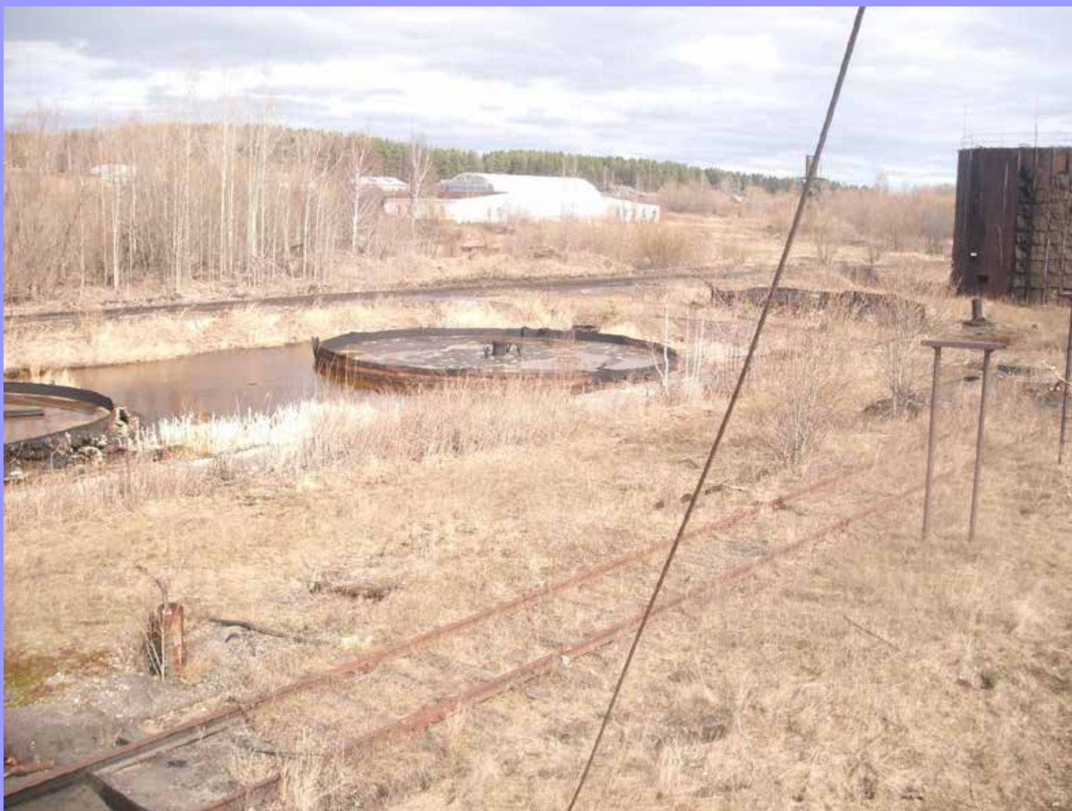
Подъездные пути к заводу зарастают травой