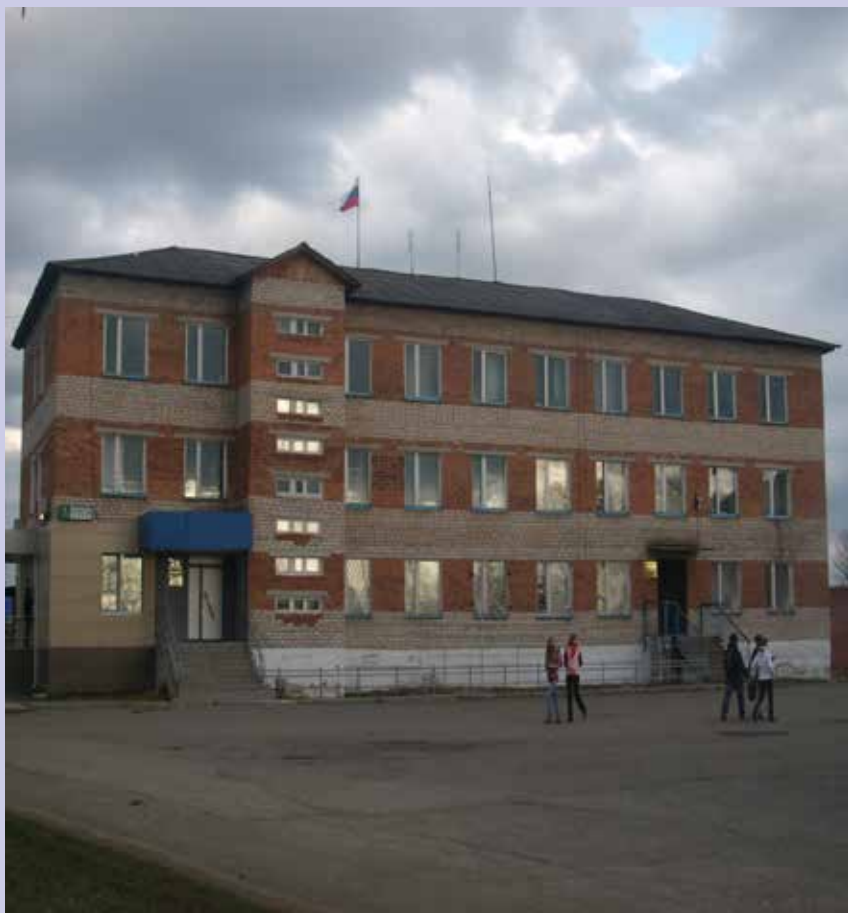
Здание лобвинской администрации и полиции.

Наша церковь. Строится пристрой для воскресной школы