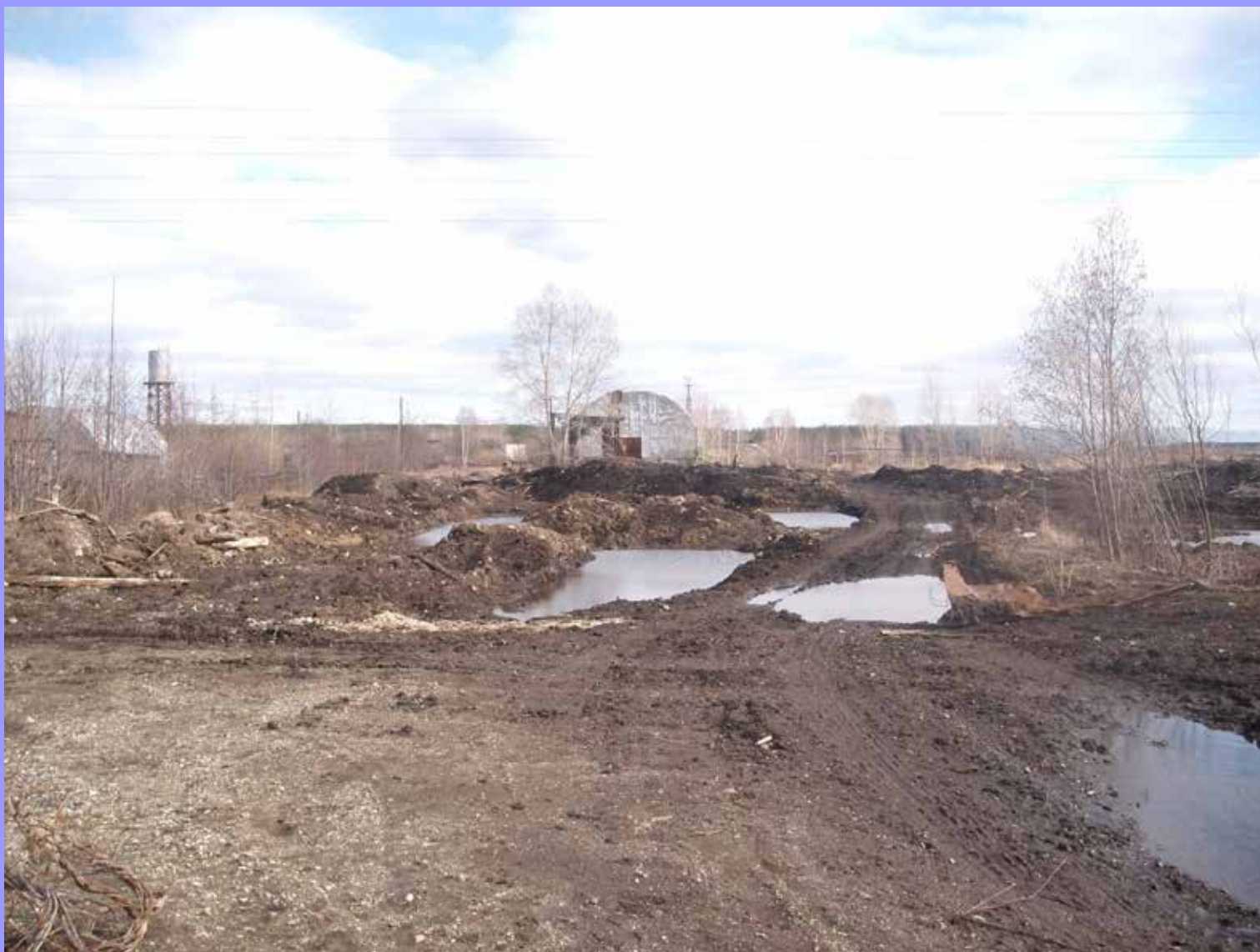
Дорога на очистные сооружения. Сейчас здесь копатели ищут металл, всё перекопано.