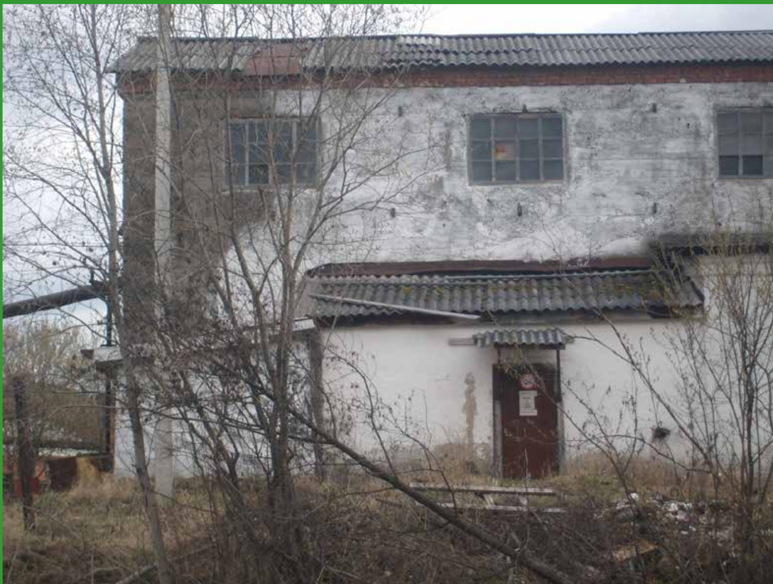
Железнодорожное депо завода