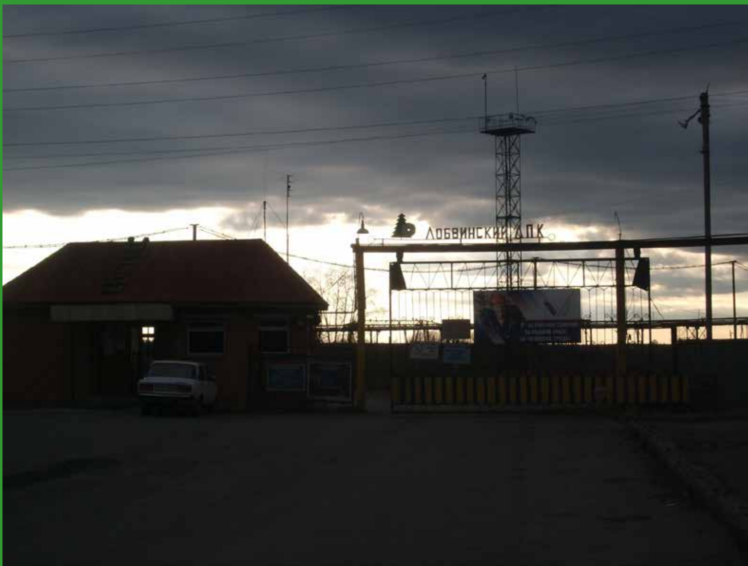
Бывшая проходная, бывшего лесокомбината