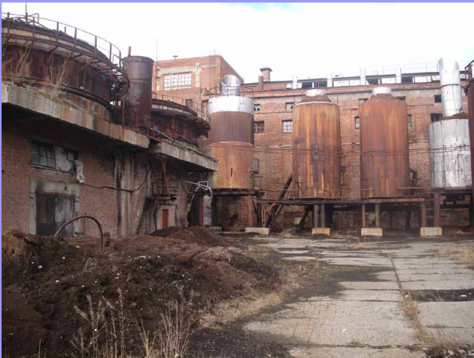
Главный цех завода – спиртовой.