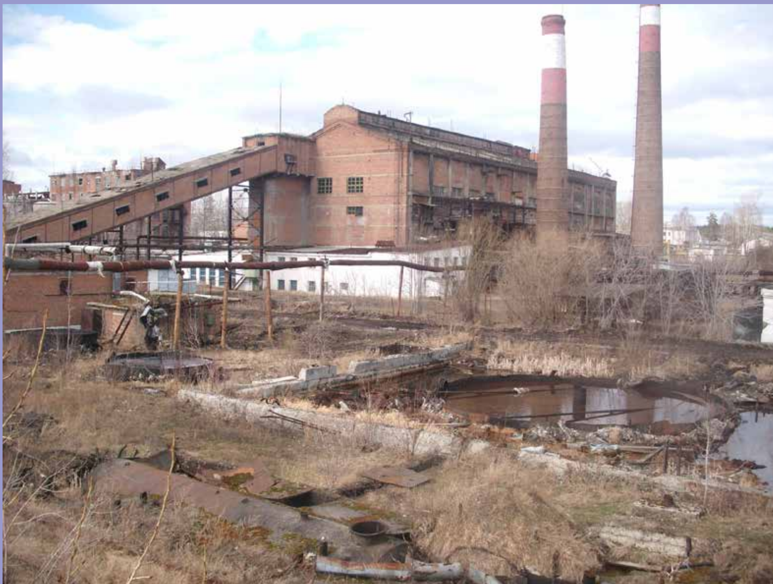
Здание ТЭЦ стоит без работы, а ведь раньше обогревал весь микрорайон «Гидролизный»