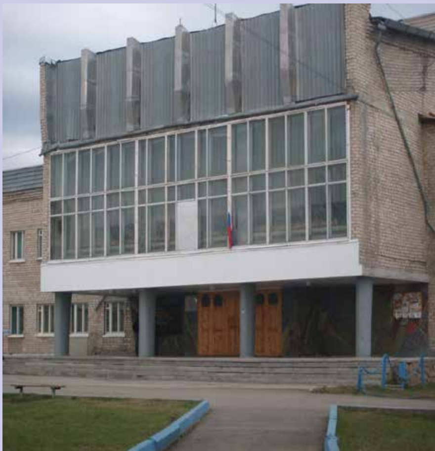
Дом культуры и спорта