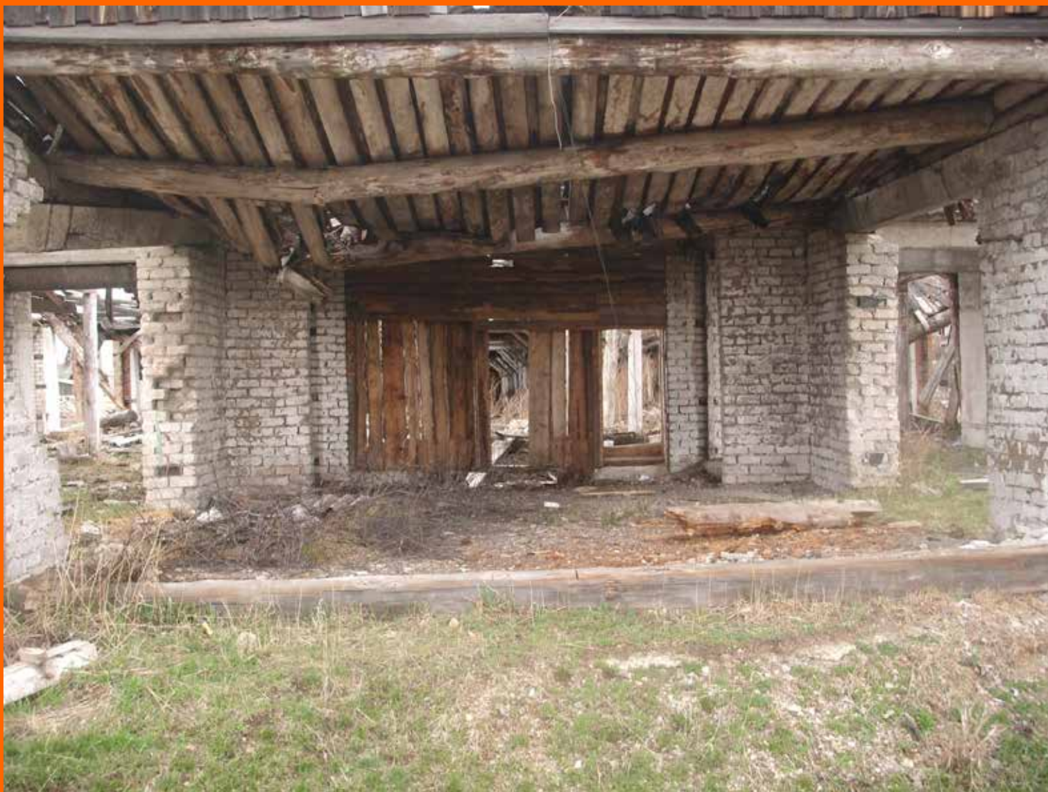
Останки животноводческой фермы