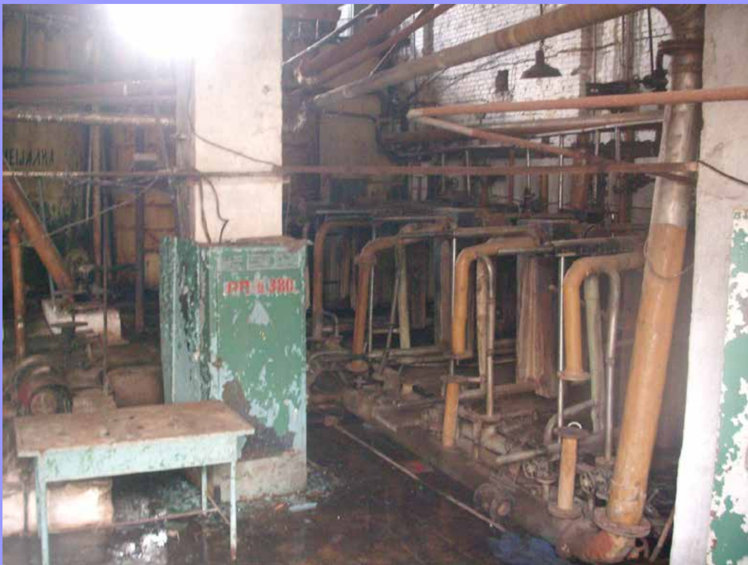
В бывших цехах ржавеет оборудование