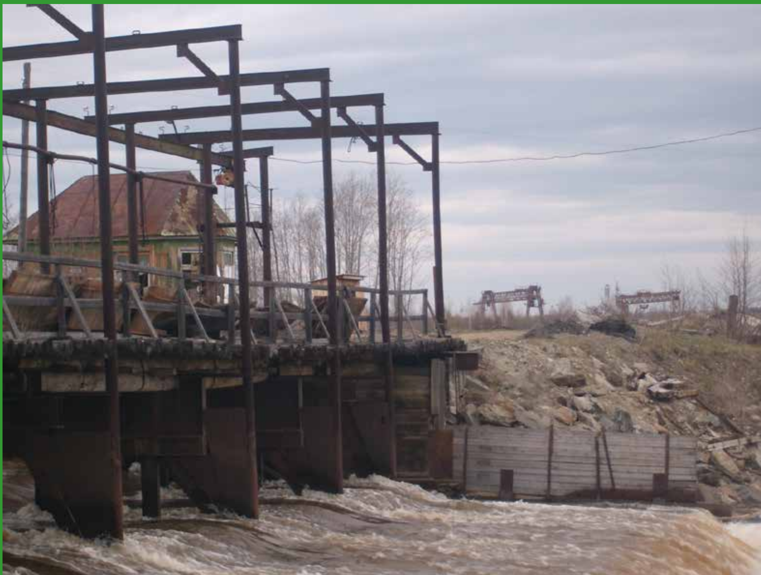
Бывшая плотина завода