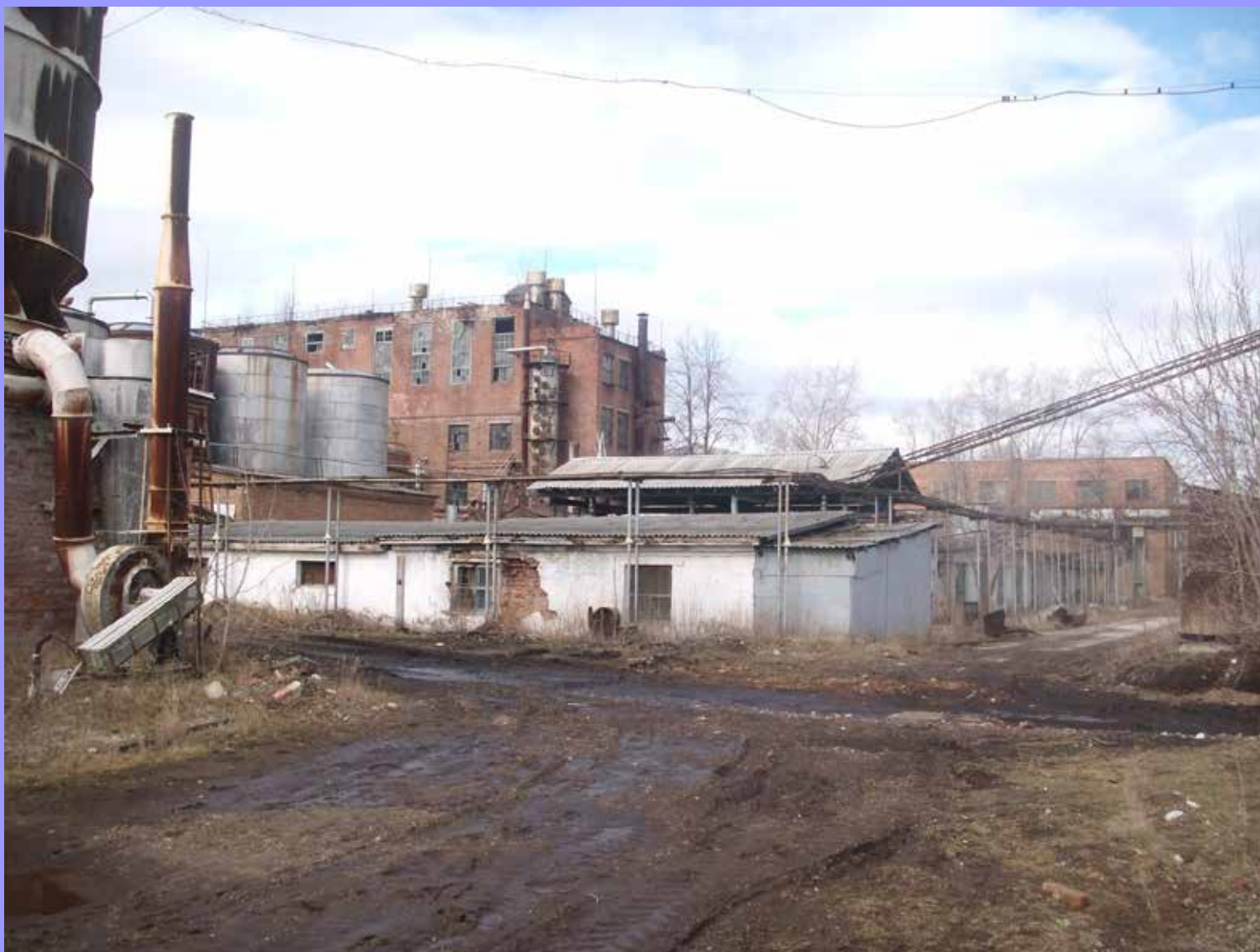
На территории завода