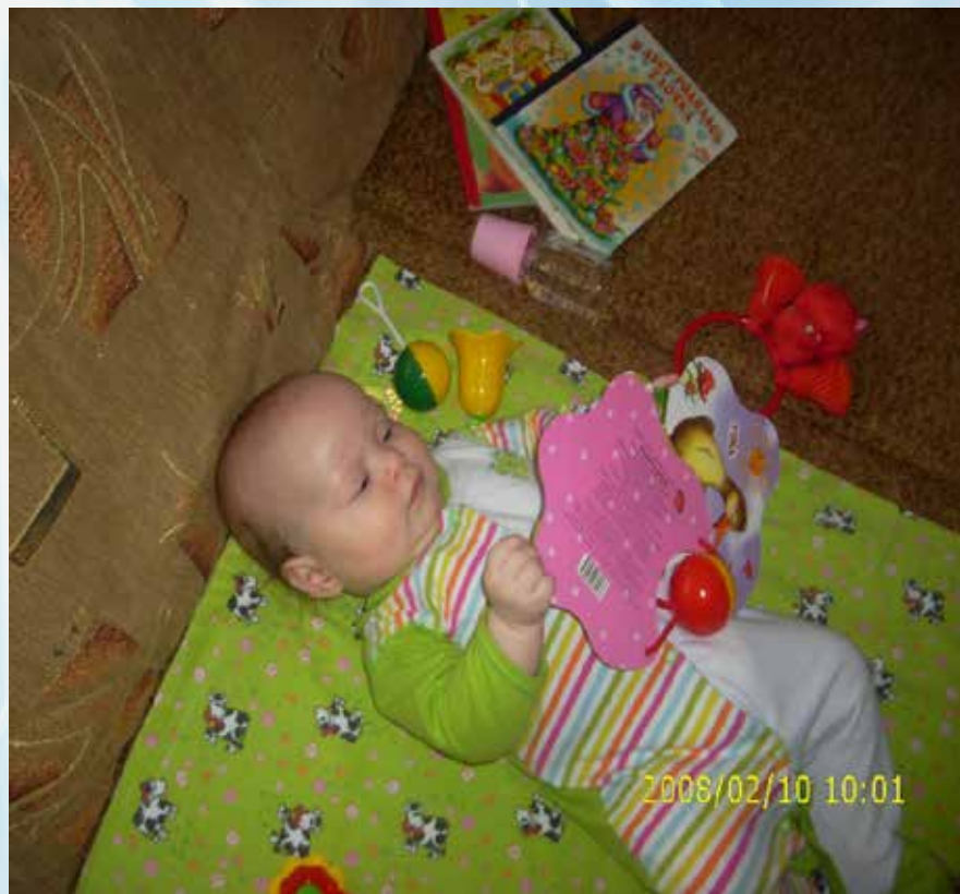
Самая юная читательница