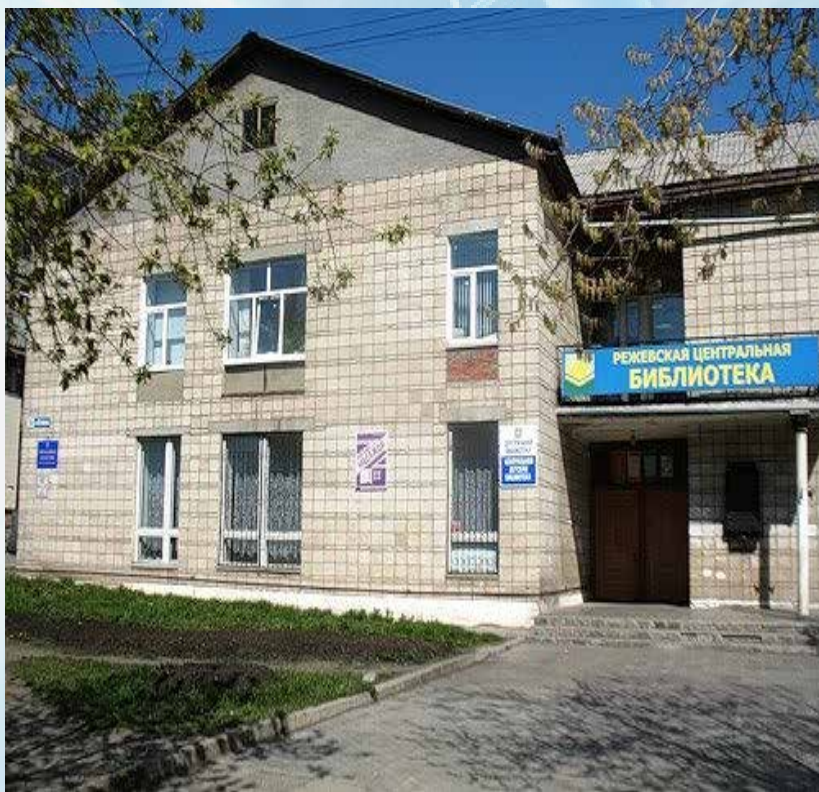
Городская центральная библиотека