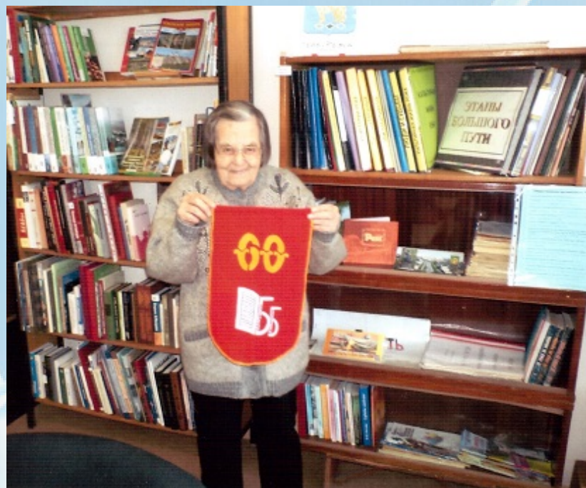
Самая старейшая читательница, ей уже 90 лет