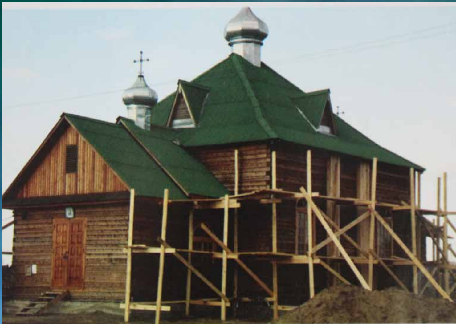
Строительство храма (возведение стен и крыши)