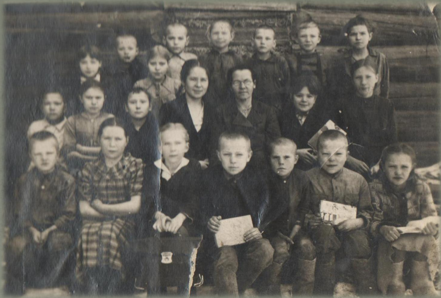
Учащиеся школы с. Беляковского. (1944 г.)