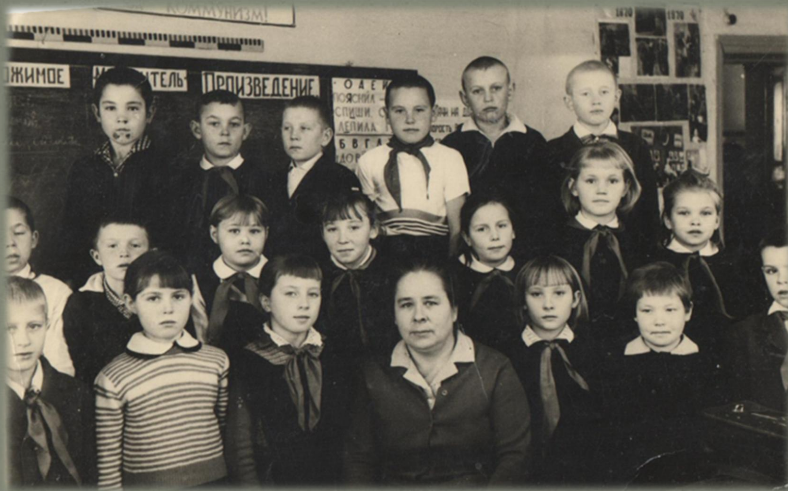
Учащиеся 5 класса Беляковской школы

(Фото из семейного архива Грозиных. 1967 г.)