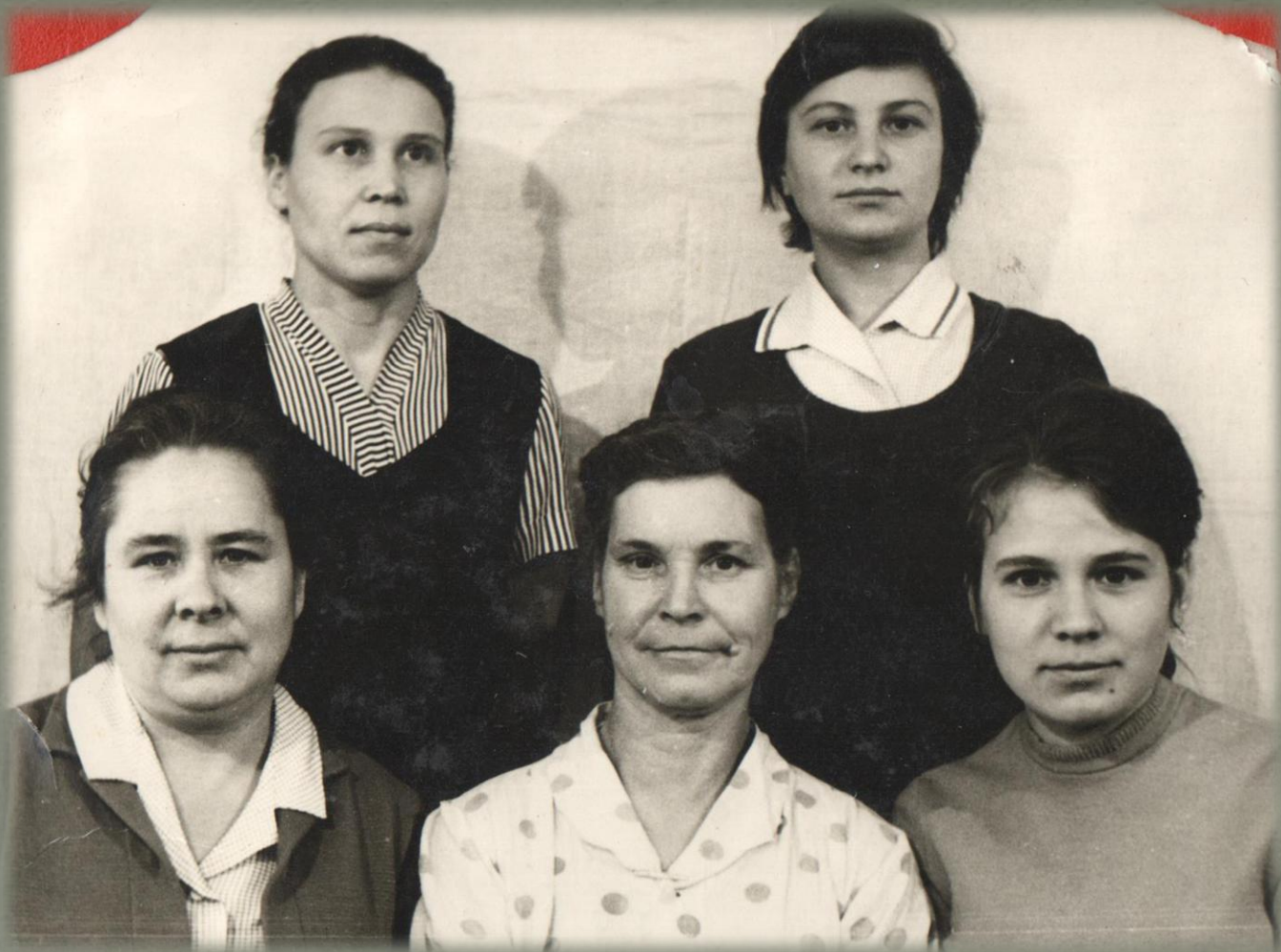
Коллектив учителей Беляковской школы.

(1966 г.)