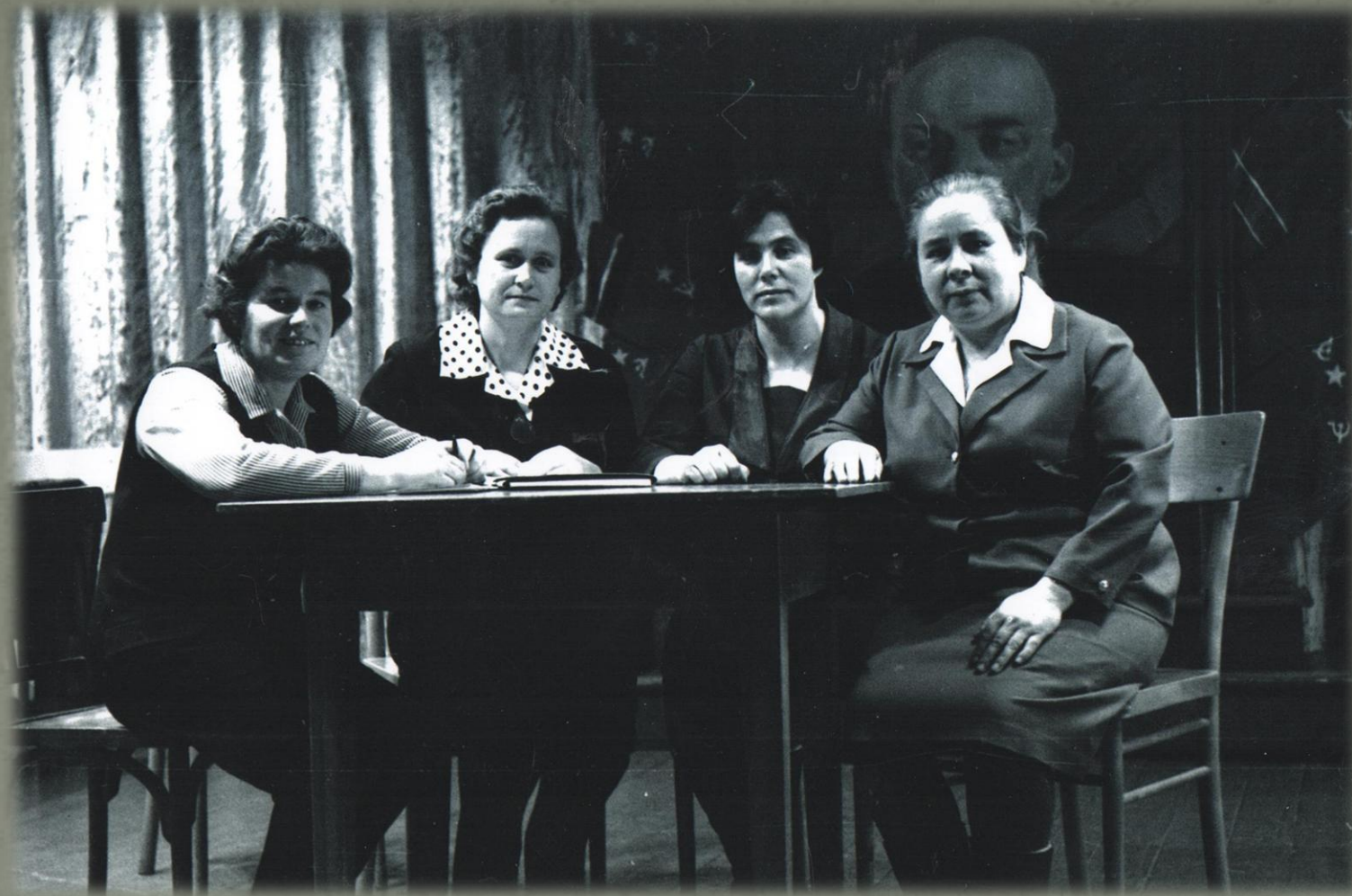
Женсовет села Беляковского (Фото из семейного архива Грозиных. 1976 г.)