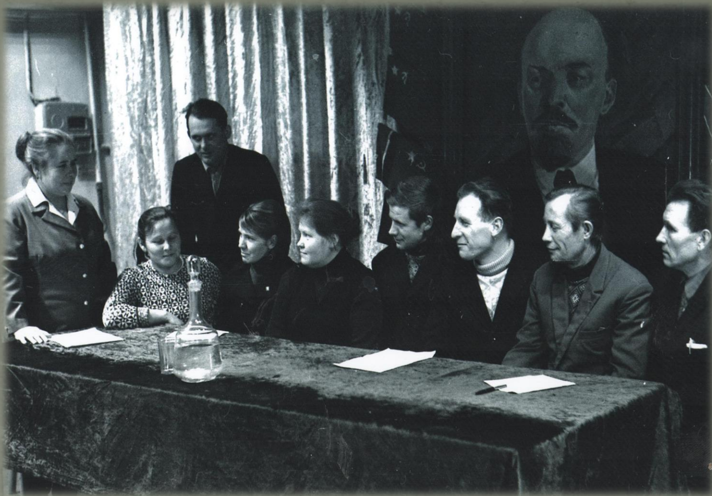
Заседание Беляковской депутатской группы (Фото из Беляковского краеведческого музея. 1978 г. )