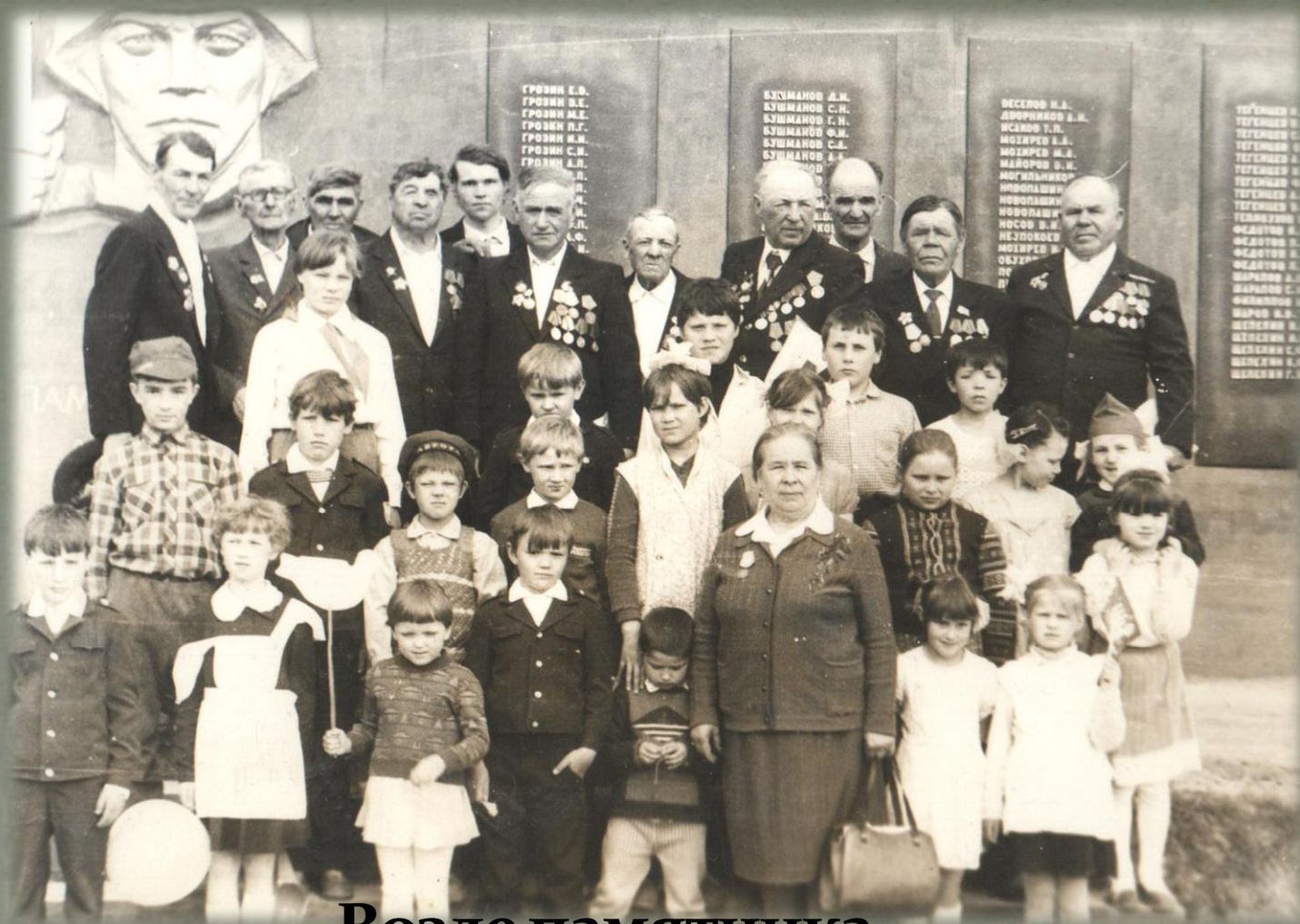
Возле памятника погибшим в Великой Отечественной войне воинам с. Беляковского. (2000 г.)