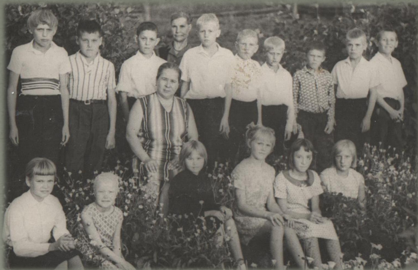
Встреча учащихся 6 класса с краеведом Беляковского музея (Фото из семейного архива Грозиных. 1970 г. )