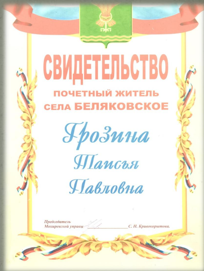
(Фото из семейного архива Грозиных. 1976 г.)