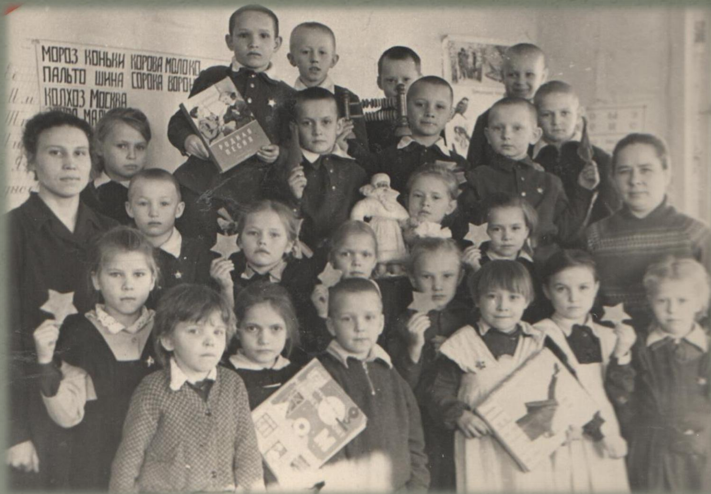
Учащиеся 4 класса Беляковской школы (1962 г.)