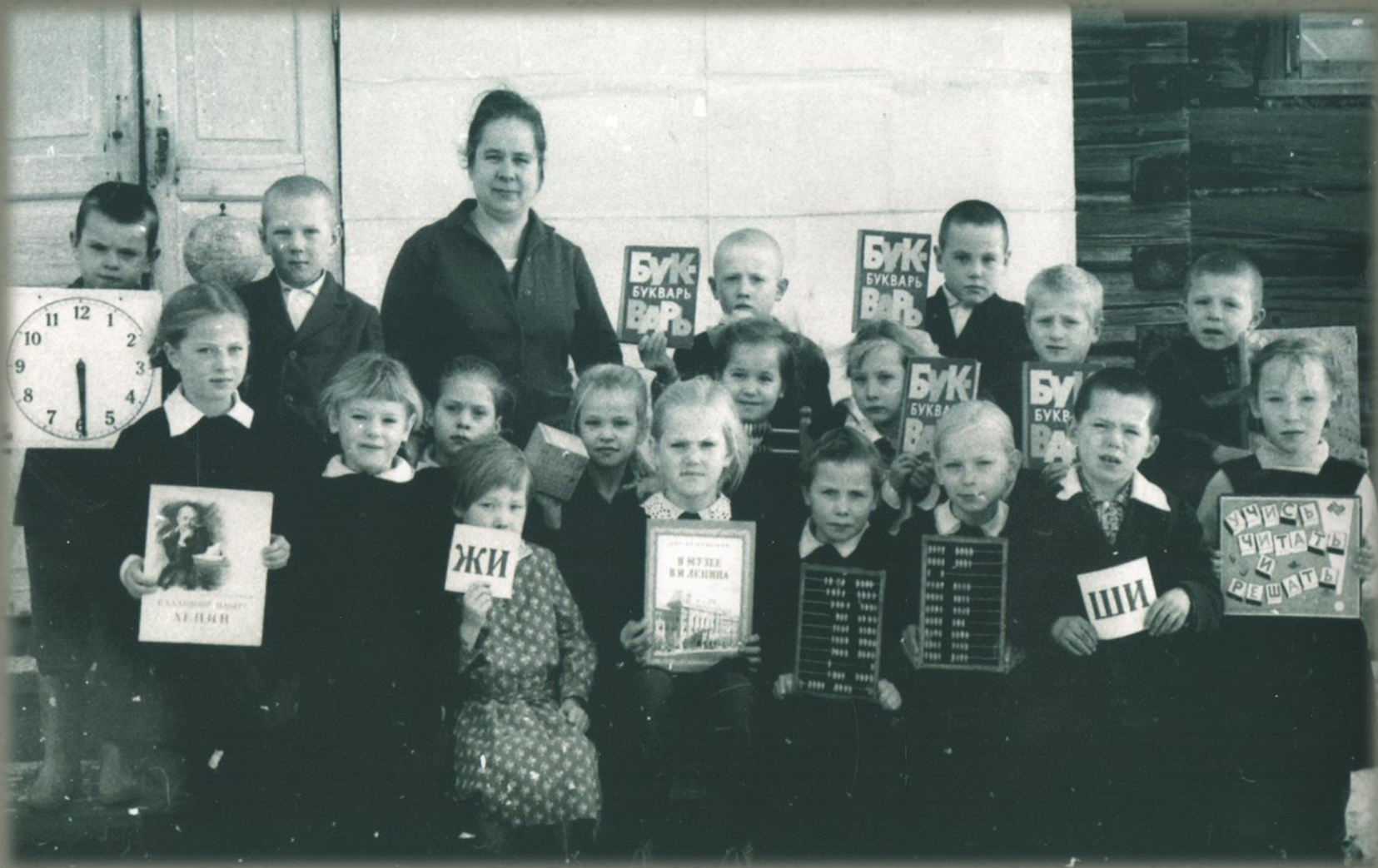
Учащиеся 1 класса Беляковской школы (Фото из семейного архива Грозиных. 1953 г.)