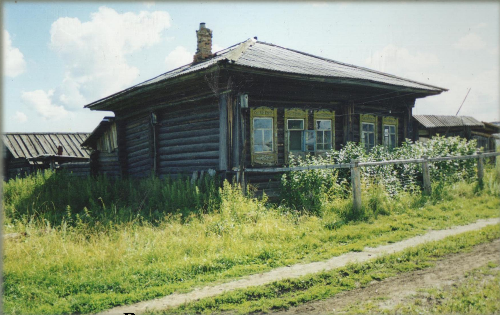
В этом доме прошло детство Таисии Грозиной. д. Истоур