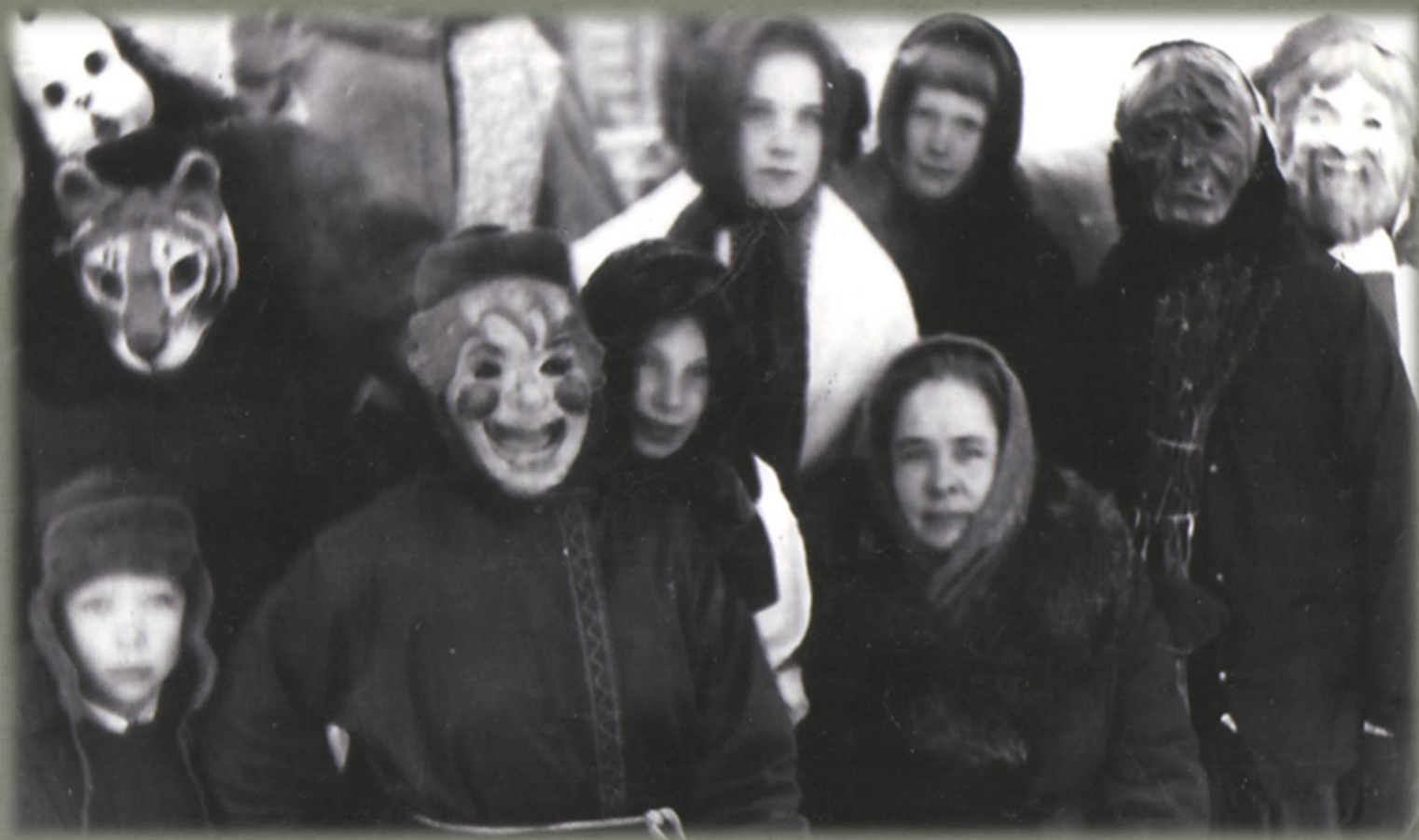
На празднике «Рождества». (Фото из семейного архива Грозиных. 1978 г.)