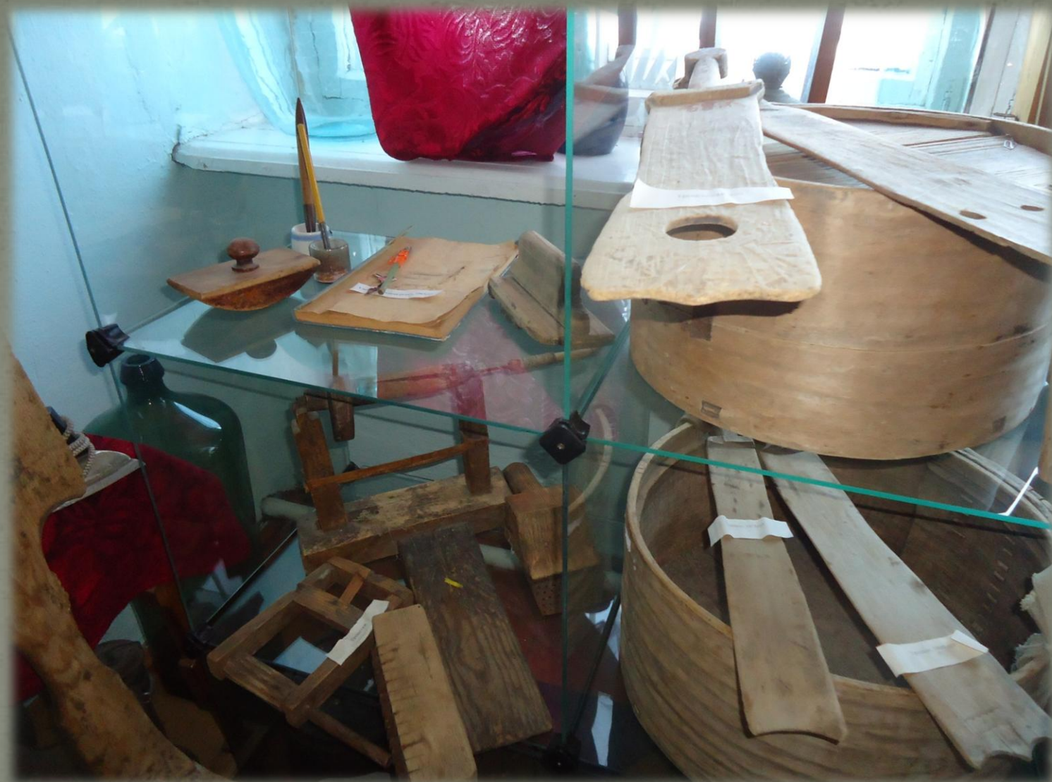
(Фото автора Мохиревой Н.Т. 2014 г.)