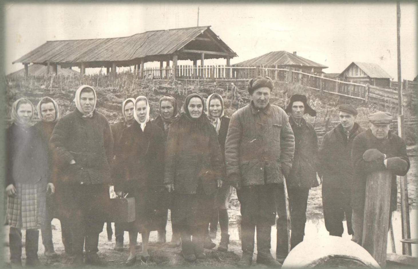
В ожидании первого улова. (Фото из семейного архива Грозиных. 1966 г.)