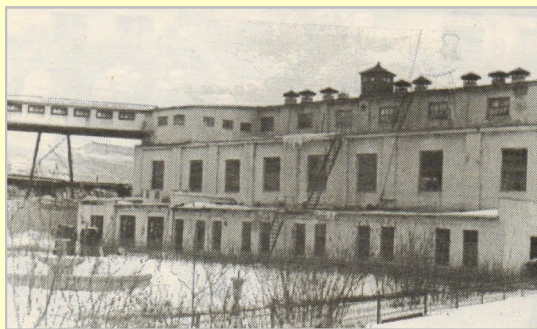
Картонный цех - западная сторона