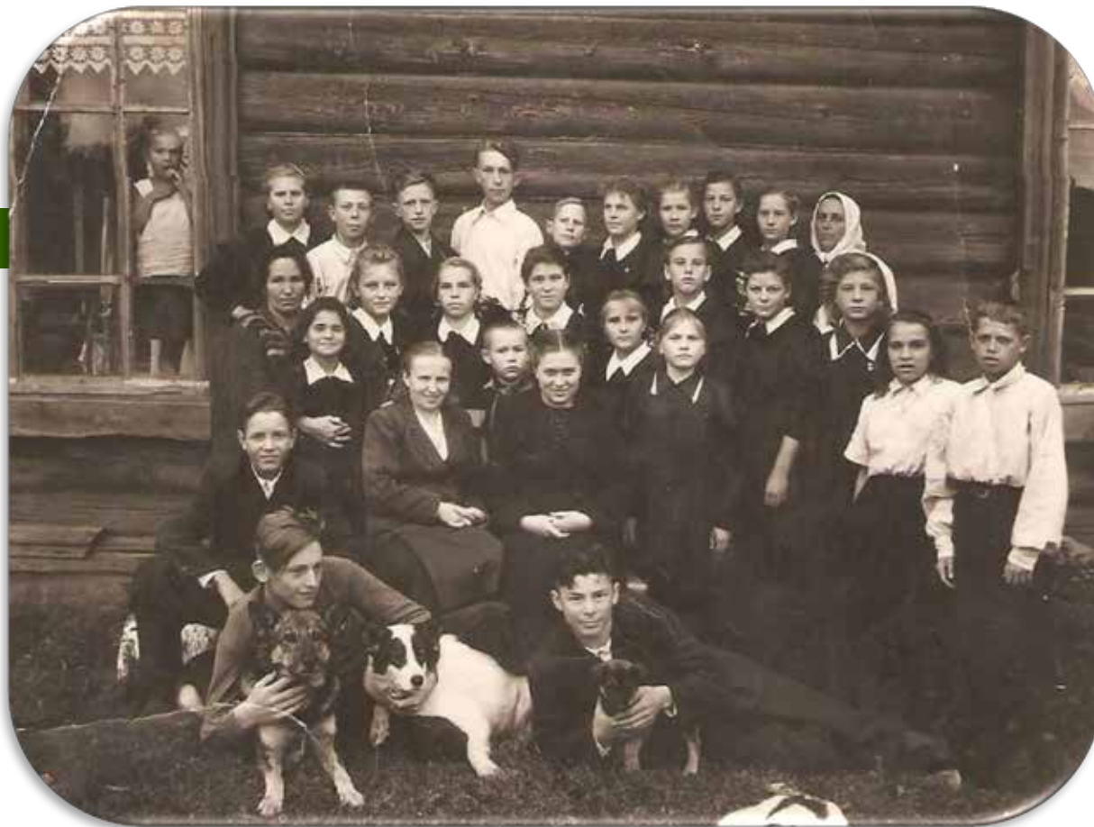
Коллектив детского дома и старшая группа 1953год.