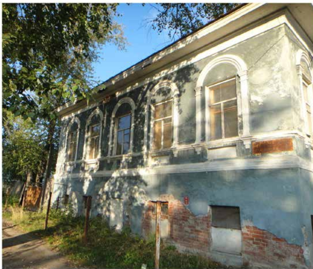
Здание бывшей библиотеки.