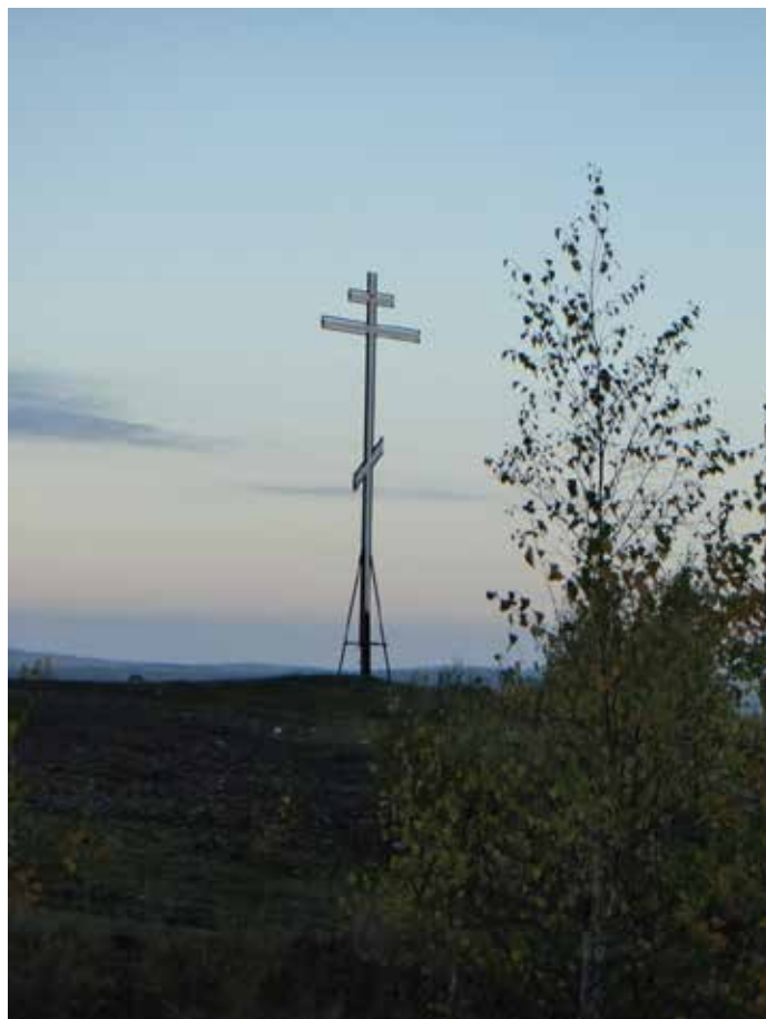
Вознесенский крест на Думной горе.