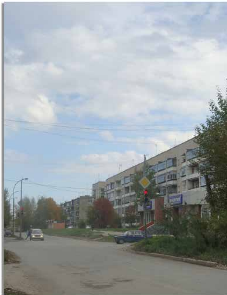
Улица Розы Люксембург.