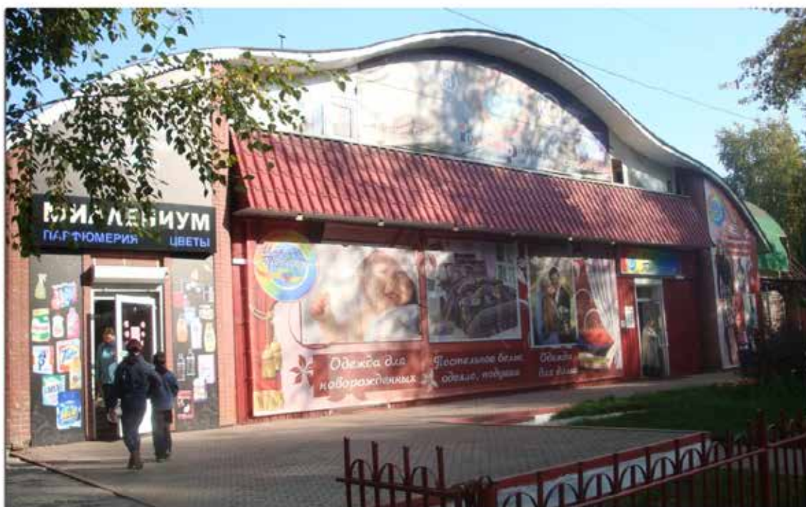
Магазин Миллениум – ул. Розы Люксембург.