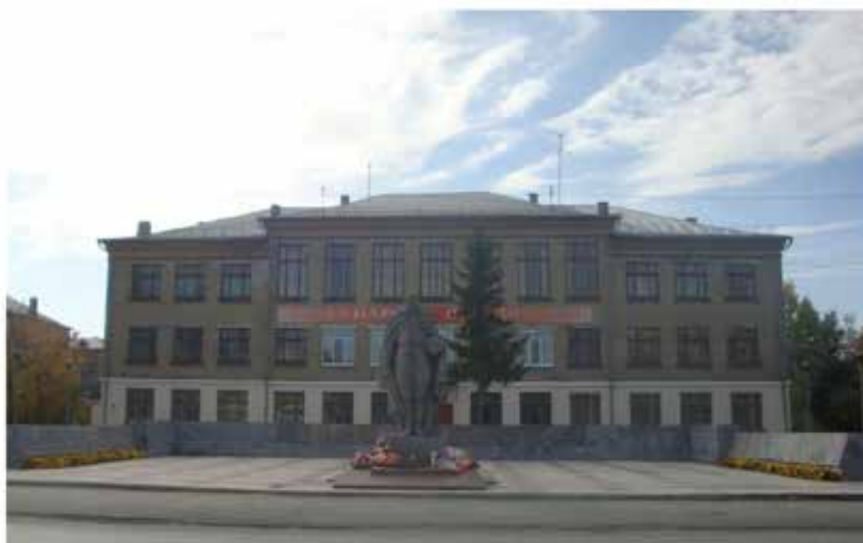
Площадь Победы, мемориал погибшим воинам-северчанам.

Фотографии к виртуальной прогулке по городу «Разыскиваются путешественники» .