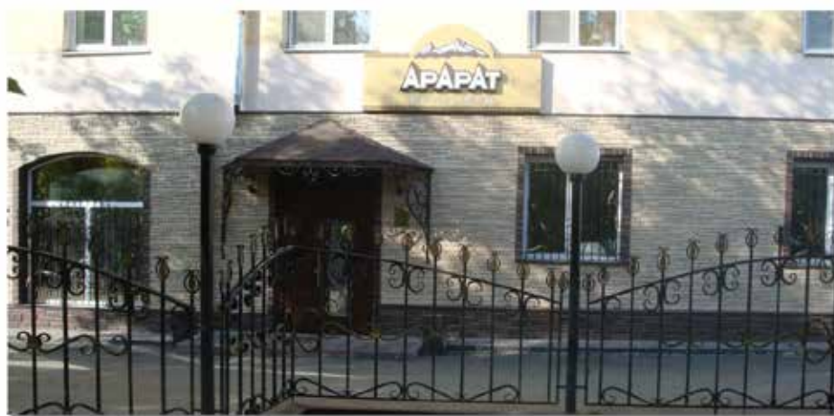
Ресторан Арарат – ул. Ленина, д. 11.