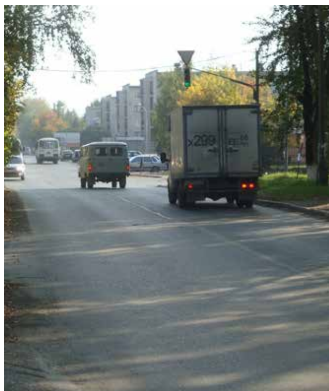
Улица Розы Люксембург.