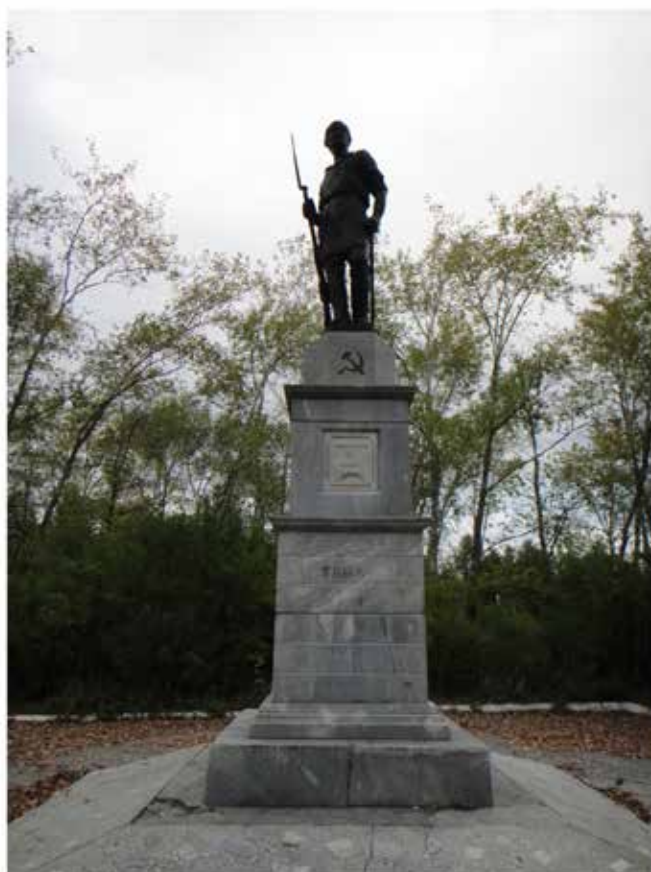
Памятник Павшим борцам за свободу на Думной горе.