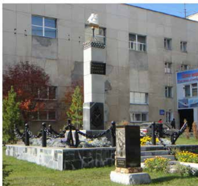
Музей «Морской славы полевчан».