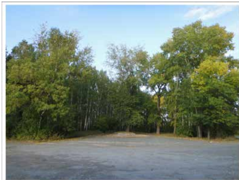
Парк на ул. Ильича – место, где стоял Вознесенский храм.