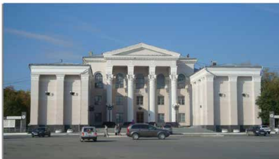
Дворец Культуры и Техники Северского трубного завода.