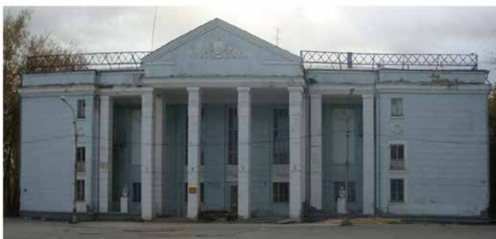
Дом Культуры Полевского Криолитового завода.