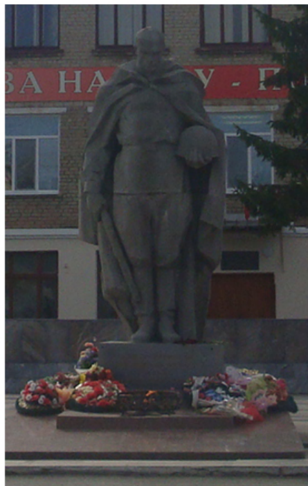
Мемориал погибшим воинам-северчанам.