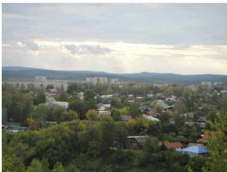
Город Полевской – вид с Думной горы.