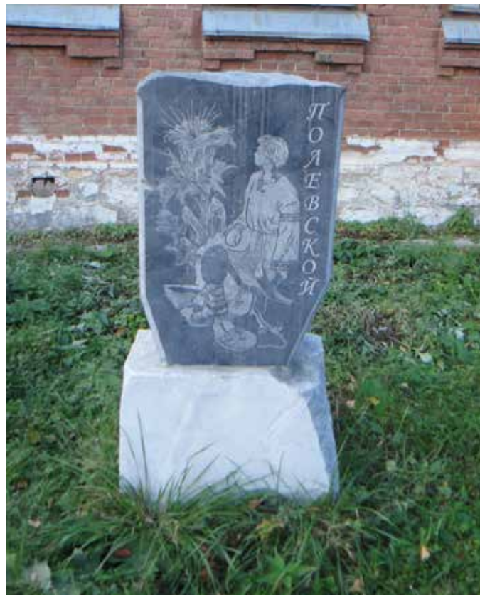
У краеведческого музея.