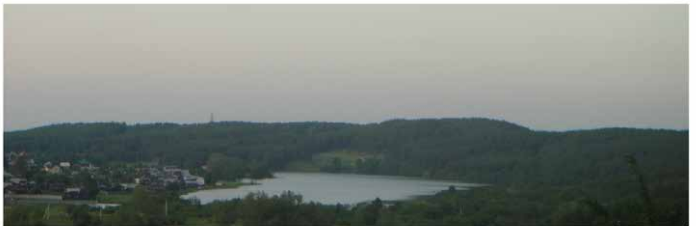
Штанговский пруд – вид с Думной горы.