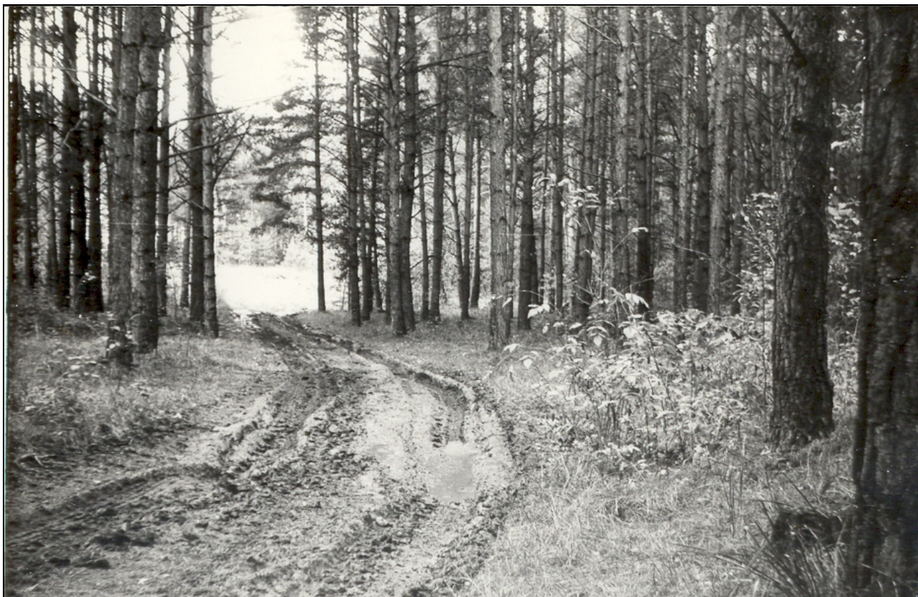
Дорога, по которой ехали на охоту в 1954 г. в леса Новоипатовской окрестности

Через некоторое время послали меня в Свердловск за лошадьми. Техники тогда мало было, и колхозы на летний рабочий сезон брали лошадей у военных. Дают мне красивого белого коня и сообщают, что это конь маршала Жукова, на котором он так и не поездил. А дело было так: для принятия парада на площади 1905 года в Свердловске маршалу понадобился белый конь. Привезли коня, надели на него парадное кавалерийское седло. Сел на него маршал, конь тоже сел... на задние ноги. Впоследствии выяснилось, что его объездили под спортивным седлом, у которого нет задней подпруги. Когда же надели кавалерийское седло, конь заупрявился, пришлось маршалу пешком парад принимать».