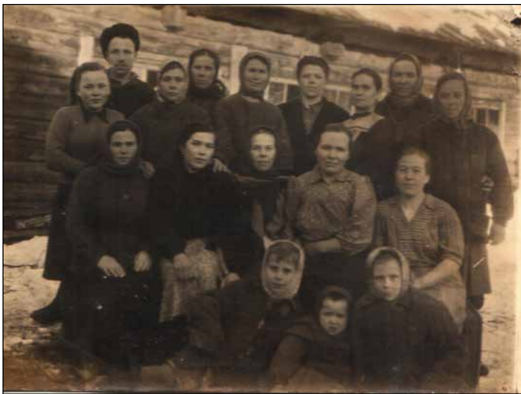
Труженики колхоза «Прожектор» в селе Новоипатово в 50-60-ти годы XX века в фотографиях А.В. Суминой