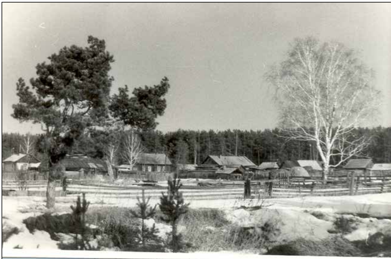
Окраина села Новоипатово

Приехали в Новоипатово, а на следующий день я повез маршала с адъютантами на охоту. Едем, смотрим, лиса мышкует. Жуков карабин достал и с первого выстрела "срезал" лису. Я сбегал, принес ее.