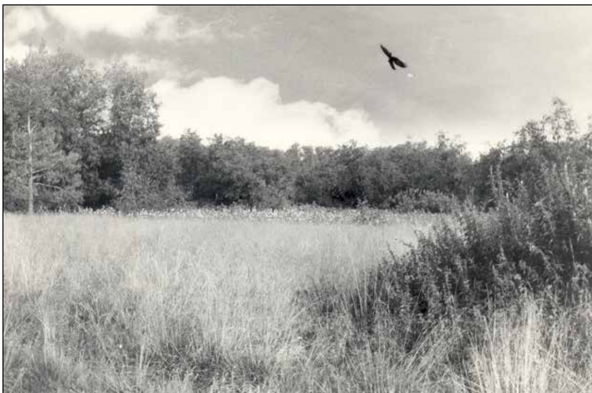
Охотничье место, куда ночью выходили глухари, исполняя свои «танцы» охотники говорили «токуют»

Очень хороший человек был Георгий Константинович!»