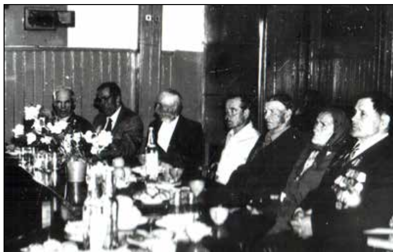
В честь 50-летия Победы в Новоипатовском ДК вручали медали им. Г.К. Жукова участникам Великой Отечественной войны