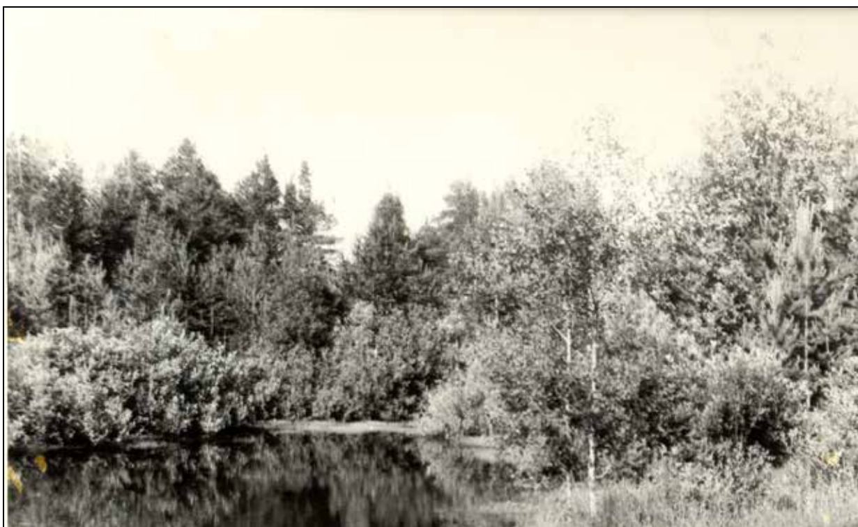
Окрестность с. Новоипатово, охотничьи места «Хутор»