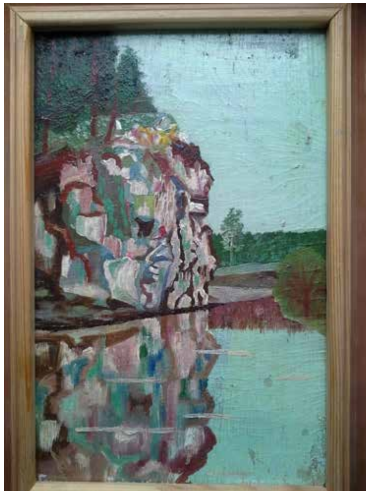
Голендухин Яков Ильич «Белый камень» 1985