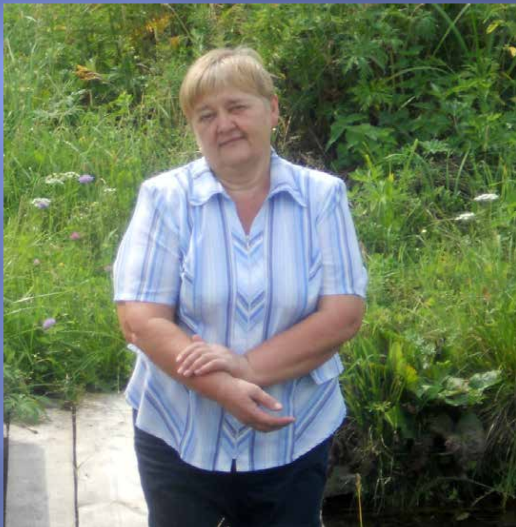
Автор Фирсова Н.Н.