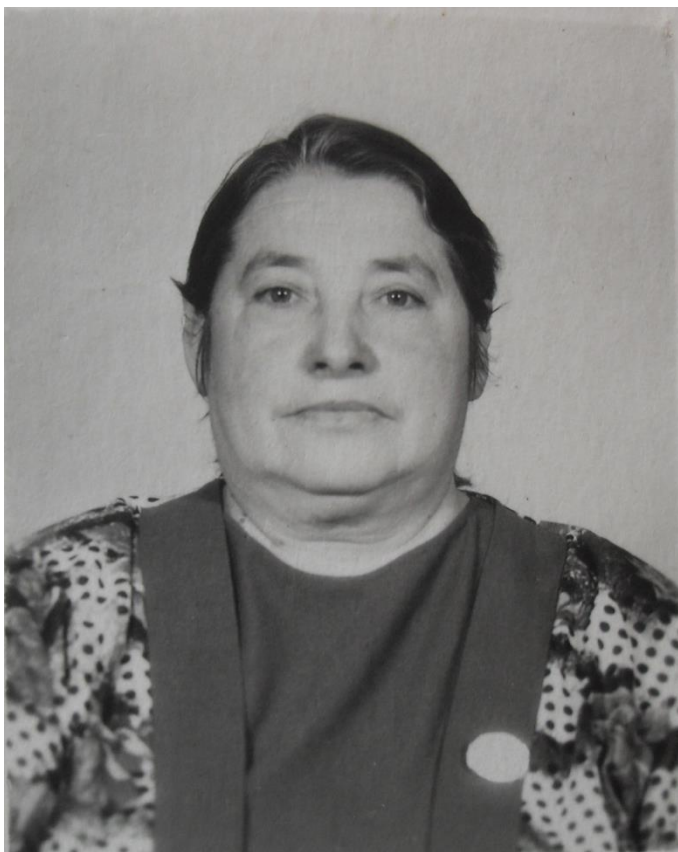
Рис. 5. Данилина Надежда Дмитриевна.