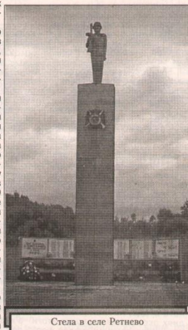
Стела в селе Ретнево

- Замечательно, что в селах Ирбитского муниципального образования все памятники сохраняются. Из всех живых существ