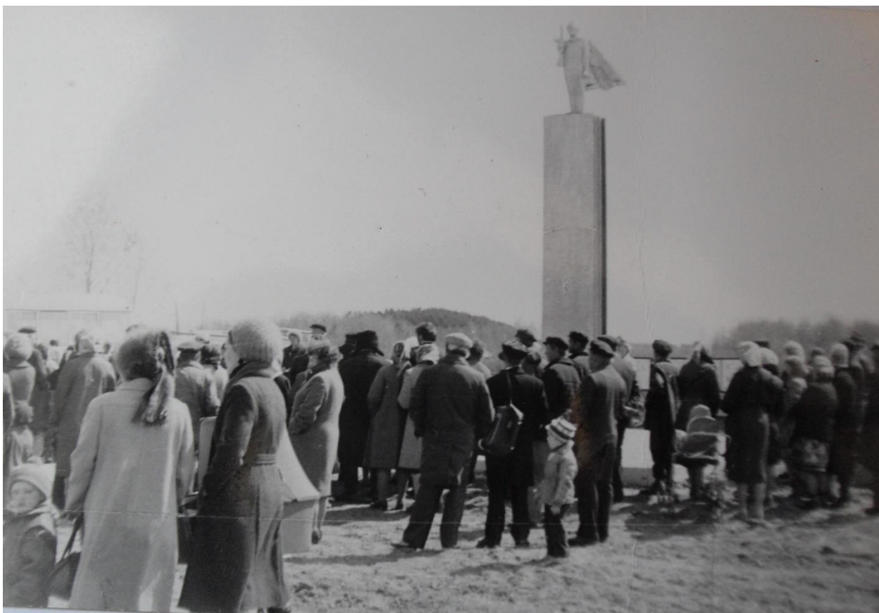
Рис. 2. Открытие обелиска д. Ретнева 09.05. 1985 г.