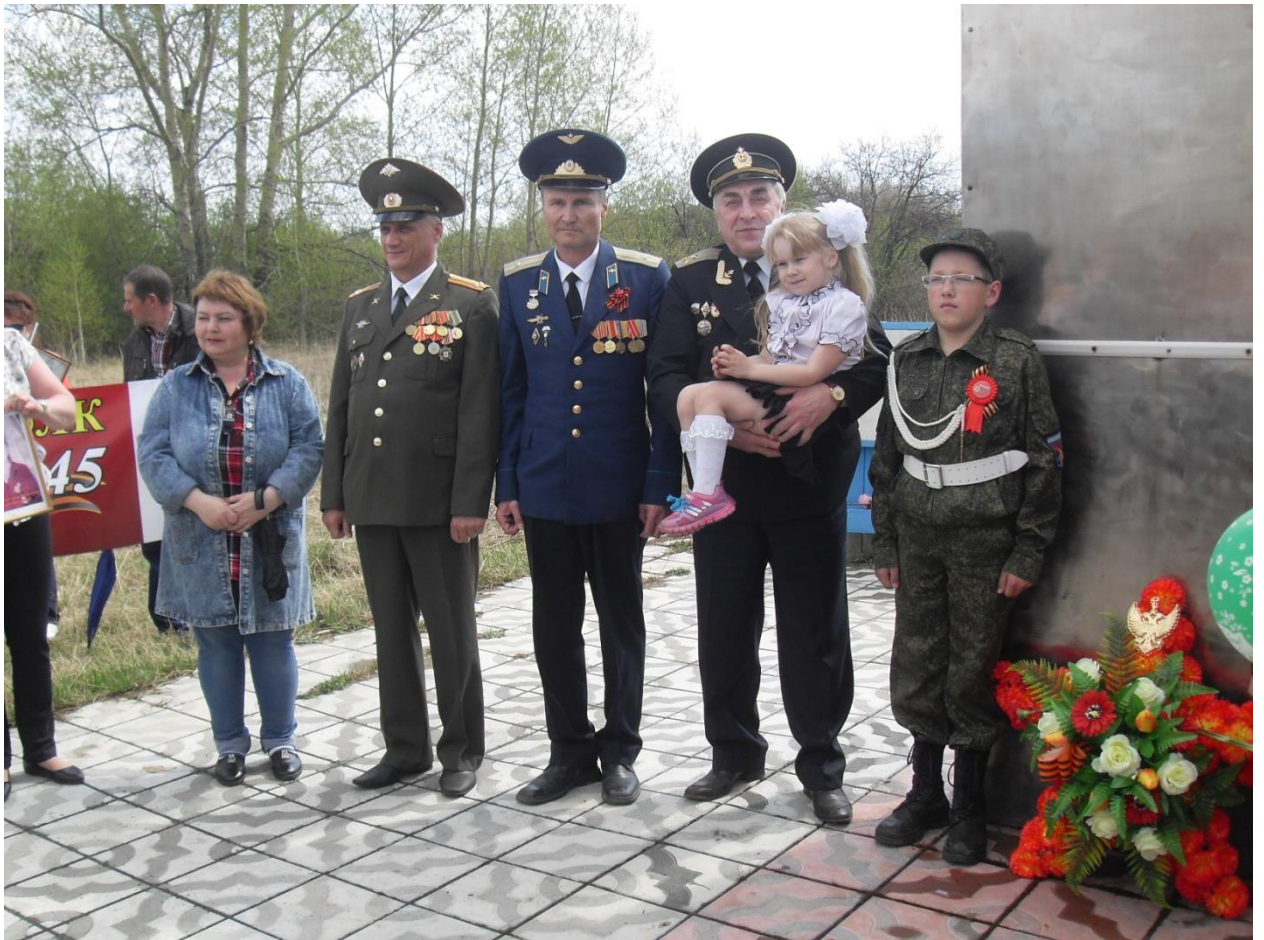
Рис.11. Митинг у Обелиска 09. 05. 2019 г.