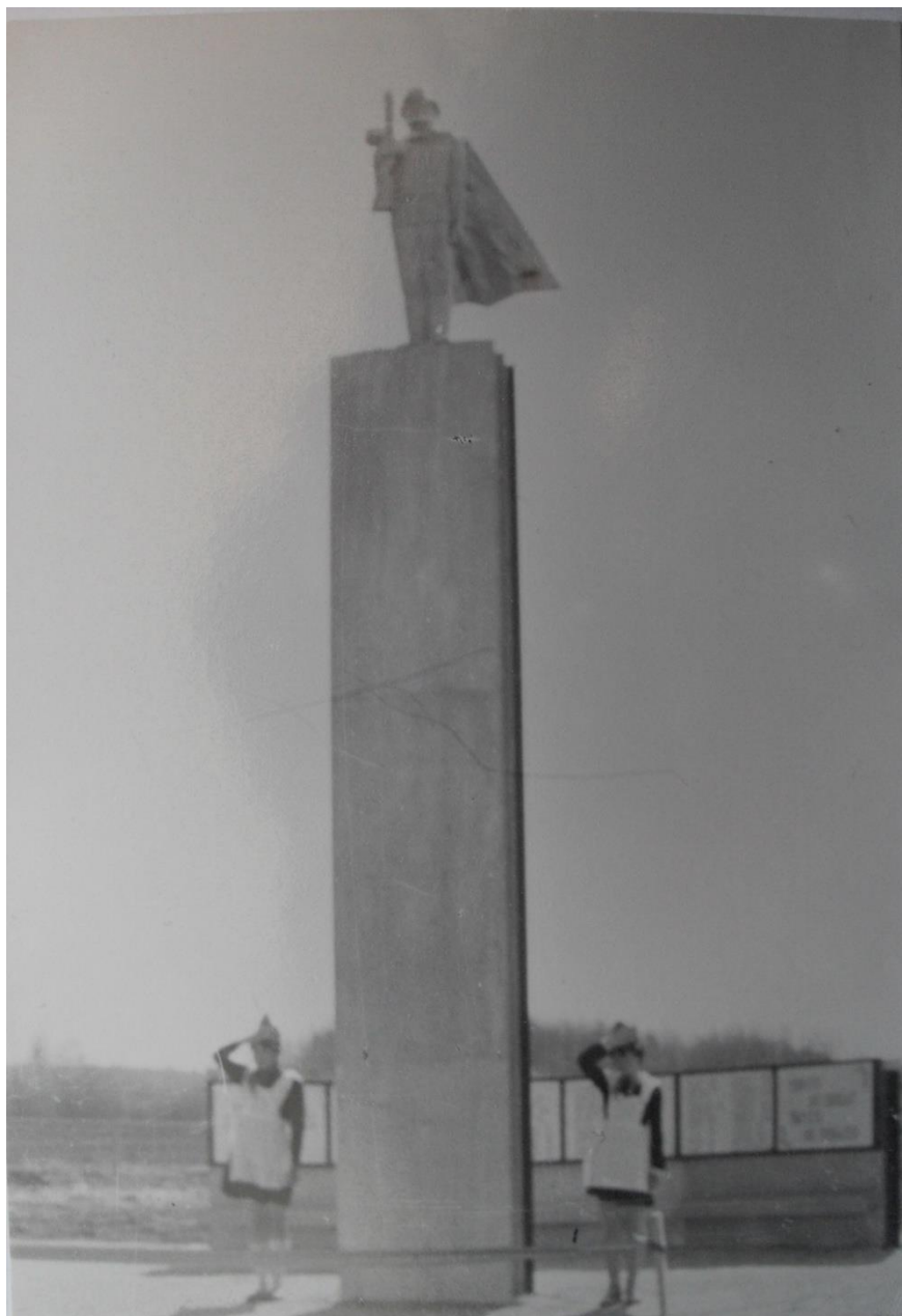
Рис. 1.Открытие обелиска в д. Ретнева 09. 05. 1985 г. Автор неизвестен.