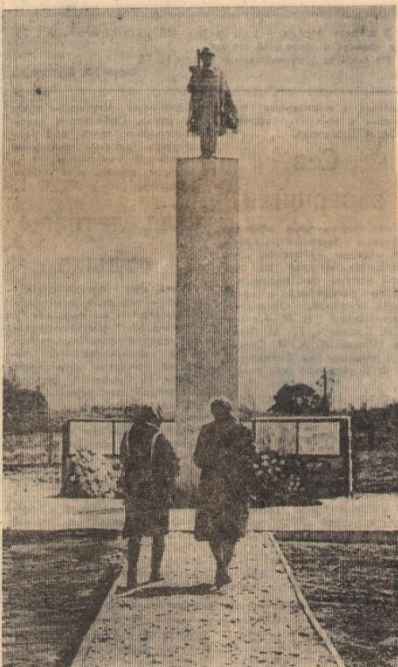
Этот памятник солдатам, не вернувшимся с войны, был торжественно открыт в день 40-летия Победы в деревне Ретневой. На мемориальных плитах выбиты имена 103 воинов, павших на полях сражений Великой Отечественной войны. Память о них хранят жители Ретневского сельского Совета.