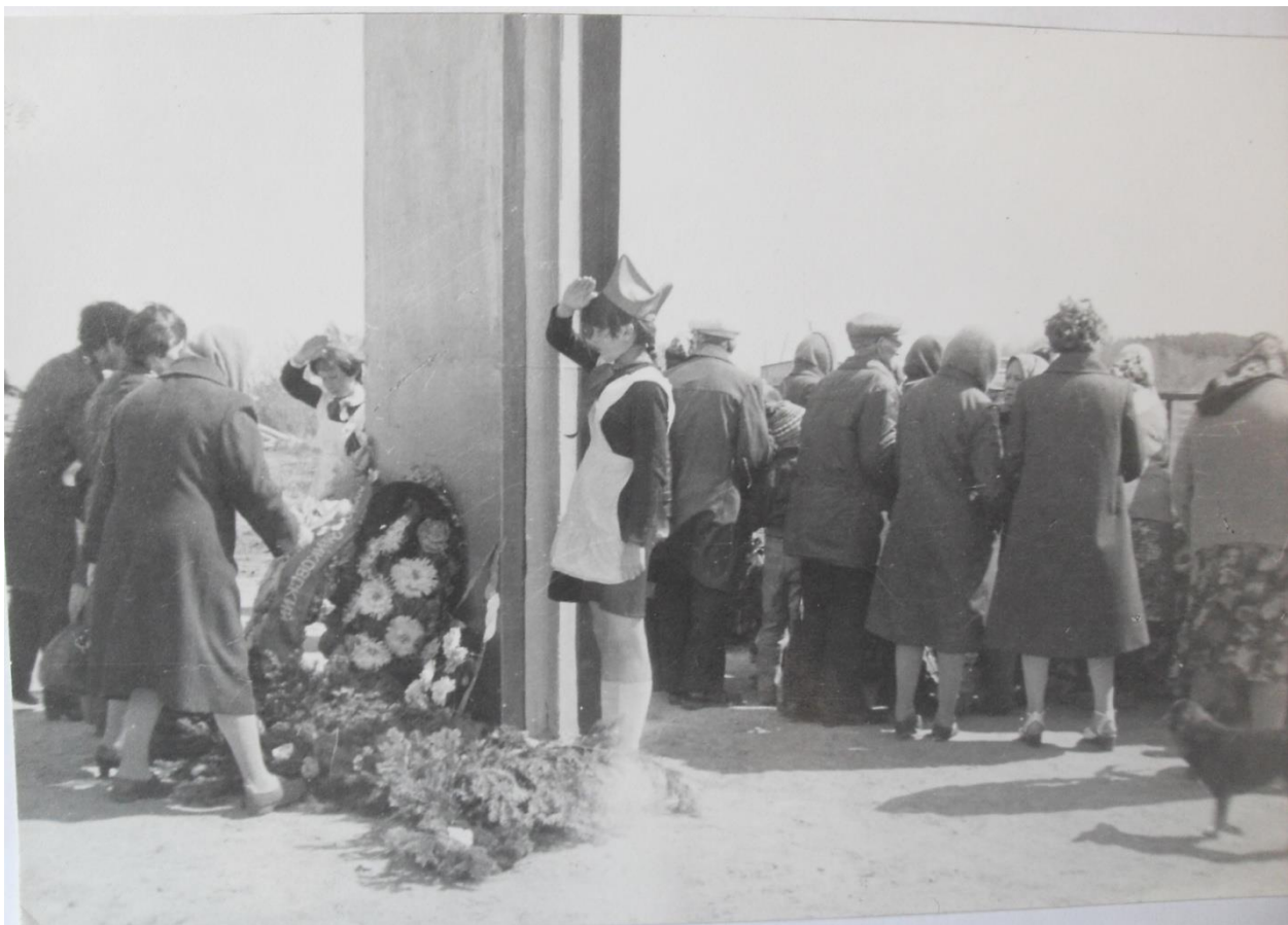
Рис. 3. Открытие обелиска д. Ретнева 09.05. 1985 г.