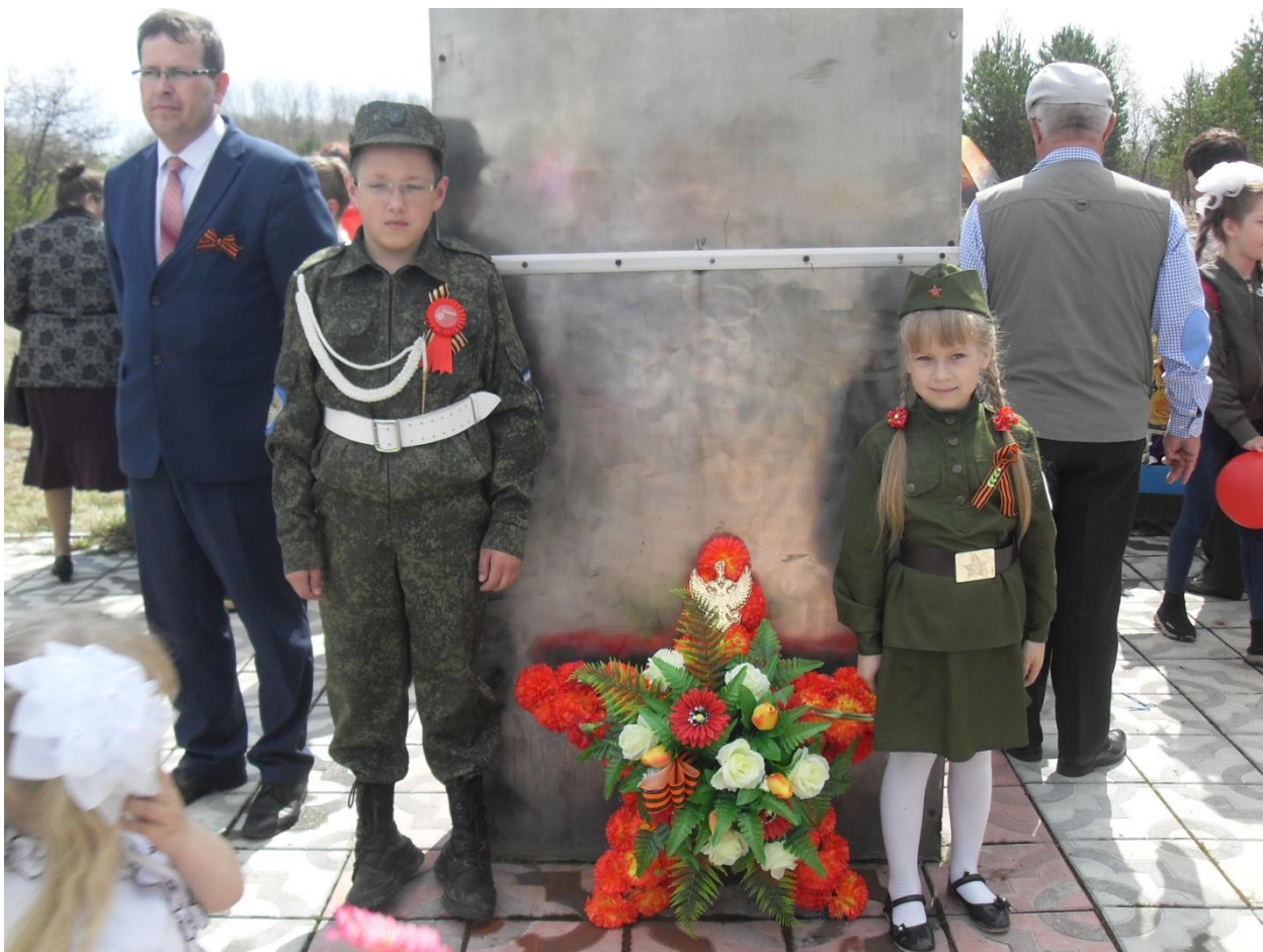
Рис.10. Митинг у Обелиска 09. 05. 2019 г.