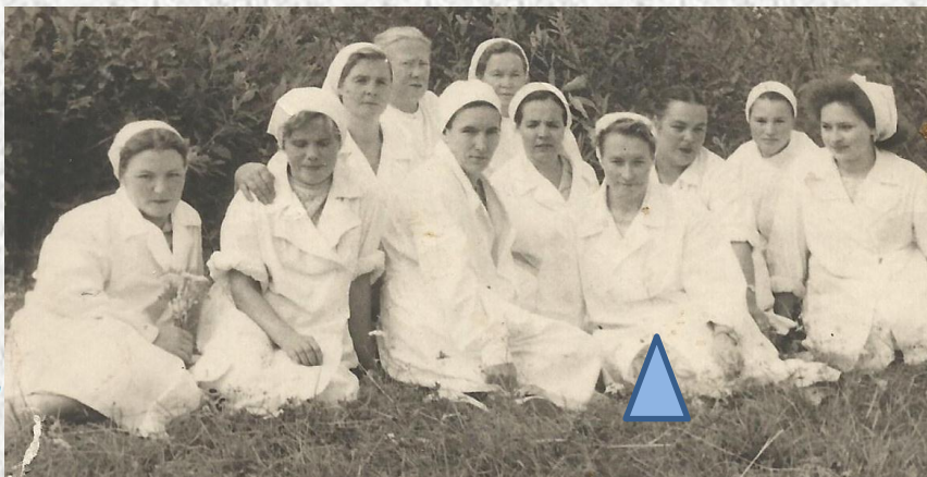
Молодой коллектив больницы.

Им пришлось начинать все с нуля: мамы-папы рядом не было... Но были молоды, энергичны, все кипело в руках.