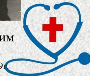
Фото из личного архива медсестры Казанцевой Веры Степановны, 1969г