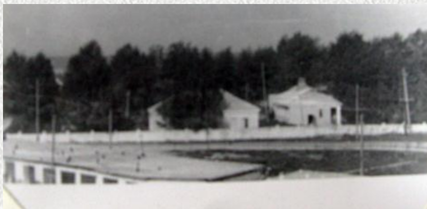
Вид на больничный городок со стороны ул. Коськович. К. 70-х гг. XX в.