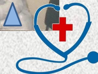
Фото из личного архива больницы