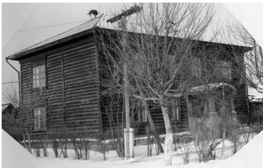
Городская библиотека по улице Ильича, 77

В 1963 году Городскую библиотеку перевели в более просторное помещение – здание бывшей почты по адресу: улица Ильича, дом № 77 12 . Это было двухэтажное деревянное здание с печным отоплением.