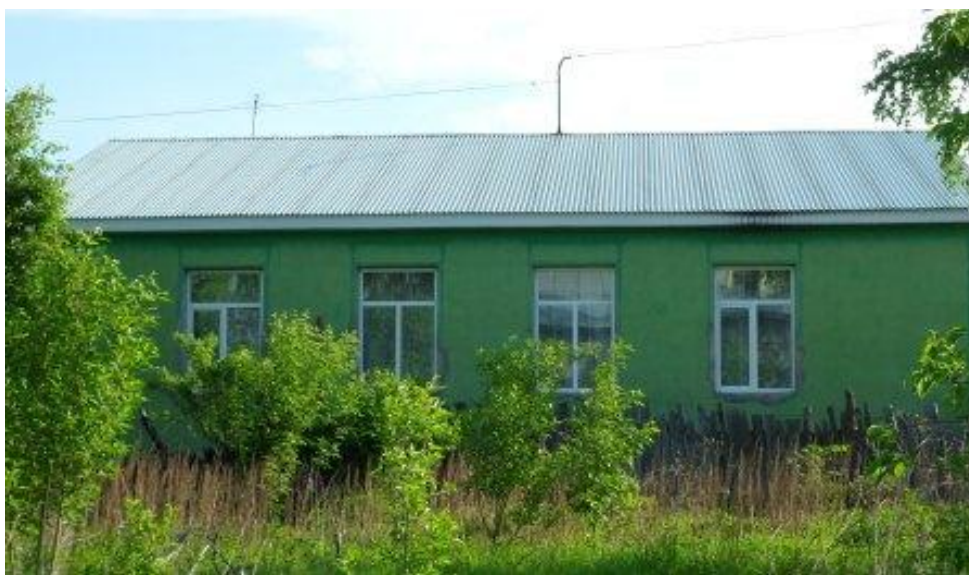
В этом здании была расположена Городская библиотека для детей и взрослых в 1947-1963 годах (фото 2014 г.).

В 1947 году Детская библиотека получила самостоятельный статус. Взрослая и детская библиотеки находились в одном здании. Коллективы библиотек работали дружно, помогали друг другу.