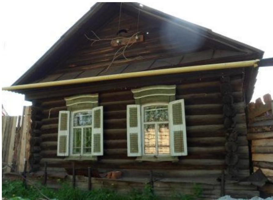
Дом № 66 по улице Жилина (2014 г.)