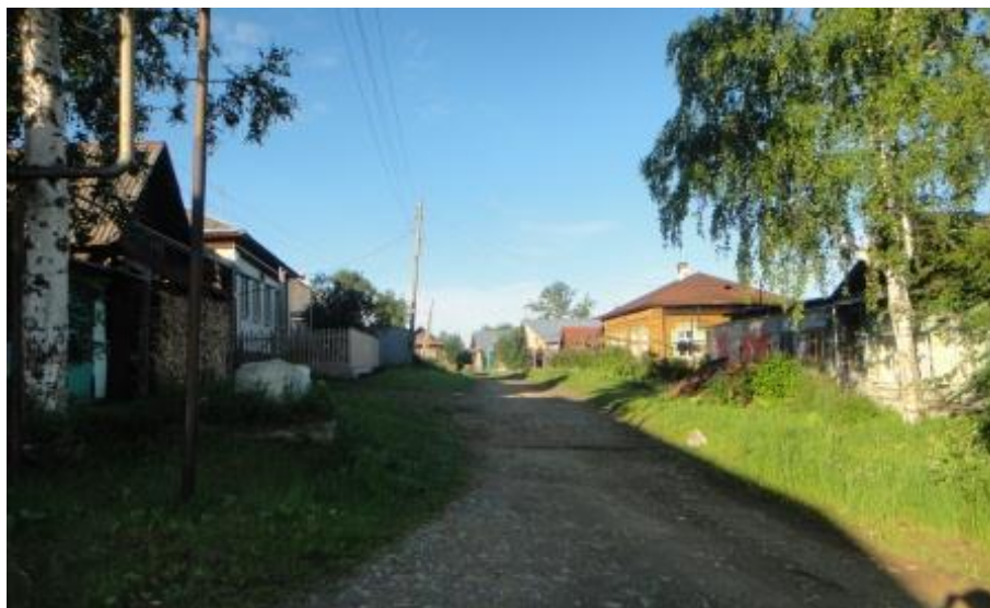
Улица Бобошина (2014 г.)