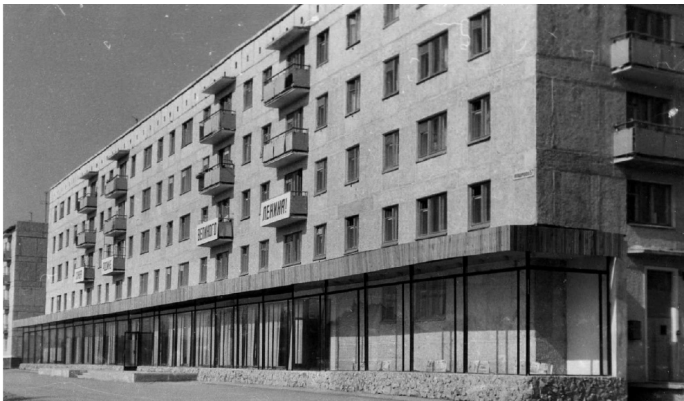
Центральная городская библиотека, 1979 год