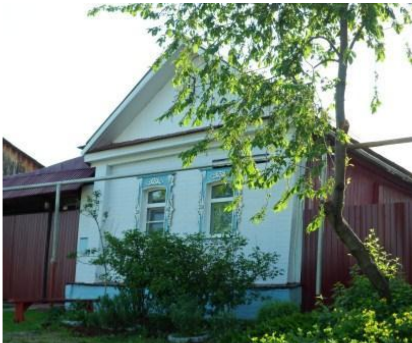
Улица Свободы, 62 (2014 г.)