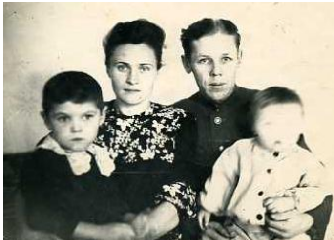
В Туринске (1950 г.)