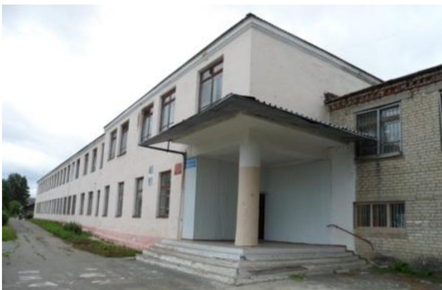
Школа № 1 (фото 2014 г.)

В 5 классе ее перевели в школу № 1. До 7 класса девочка росла очень бойкой и озорной. Любила кататься на лыжах. После седьмого класса стала более серьезной.