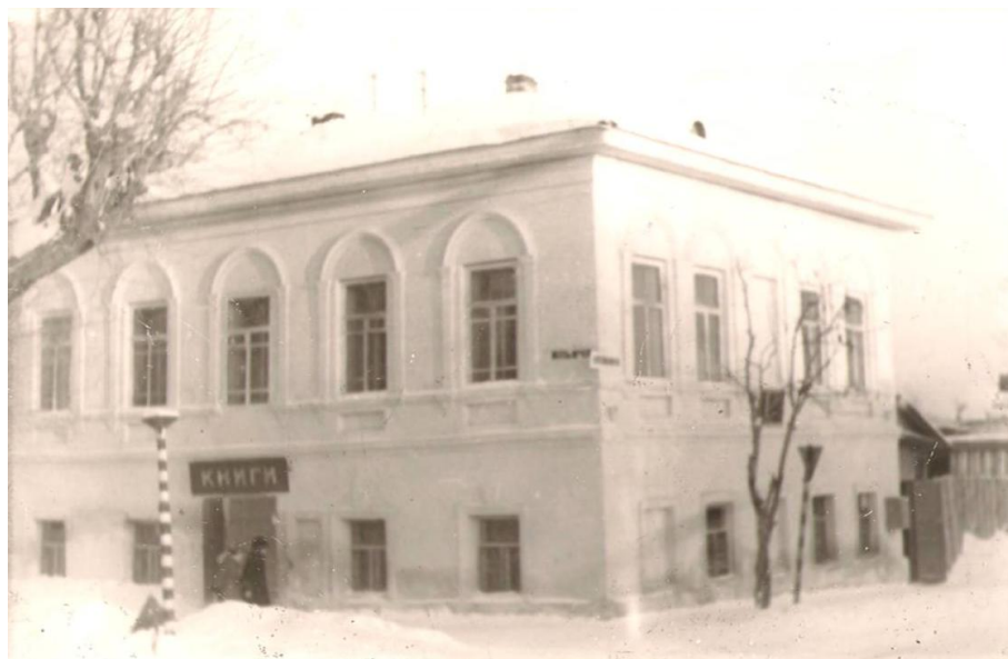
Детская библиотека в доме № 62 по улице Ильича

В 1963 году Городскую библиотеку перевели в более просторное помещение – здание бывшей почты по адресу: улица Ильича, дом № 77 12 . Это было двухэтажное деревянное здание с печным отоплением.