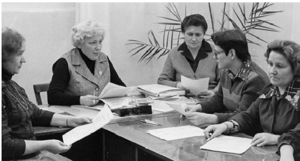
Совет при директоре.