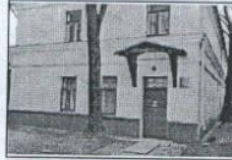
В этом красивом домике в Латвии находится Тукумский Госархив. Его адрес: Тукумс, ул. Пилс 16, LV-3101. Тел./факс: +371-63123519. E-mail: tukums@arhivi.gov.lv