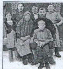
Семья Алексеевых до войны