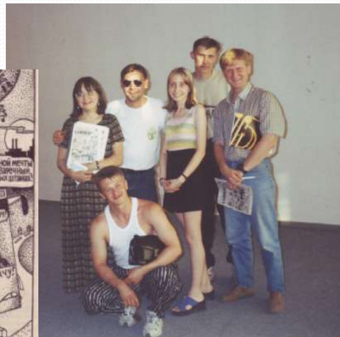
Фотография на память