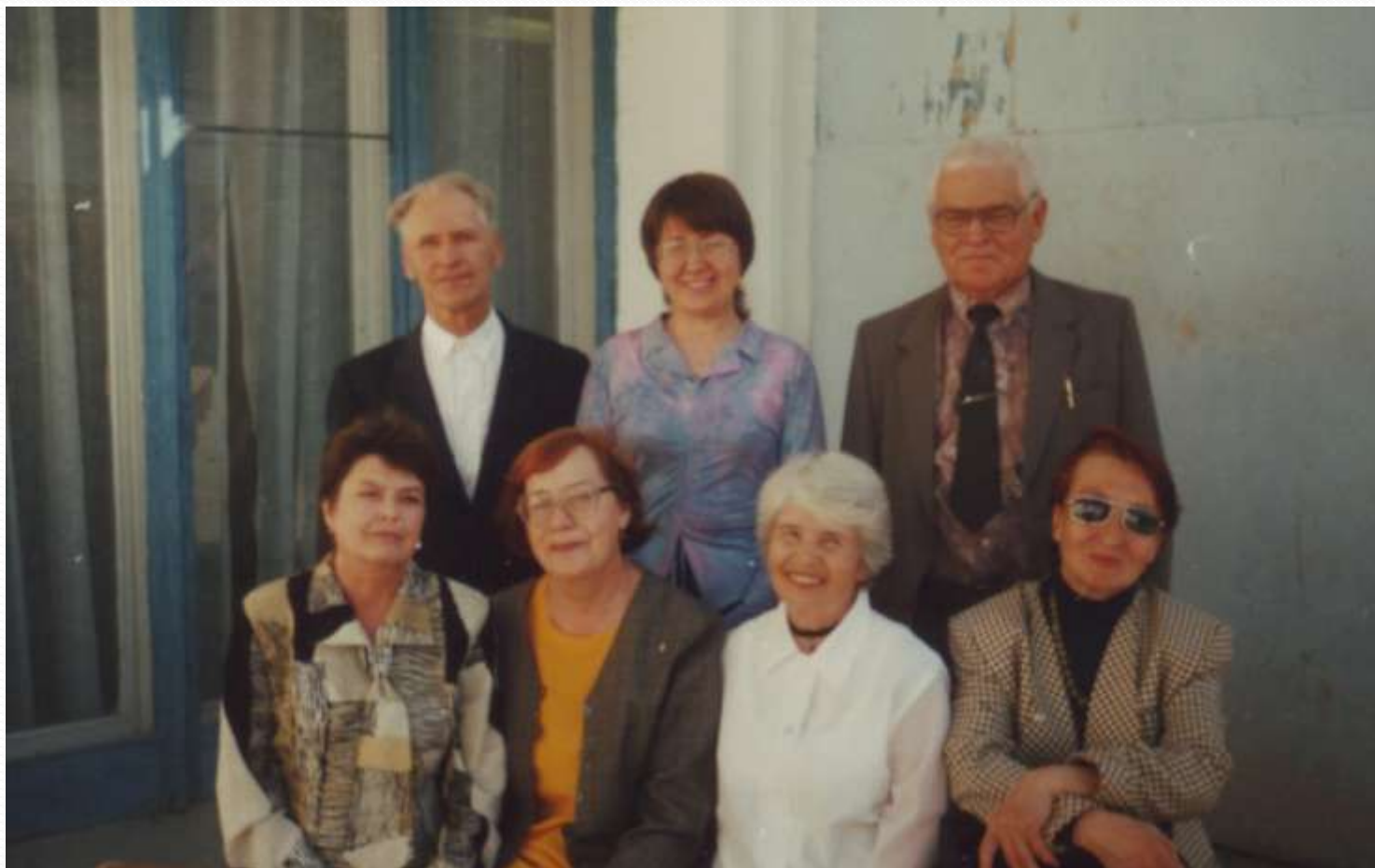
Первый актив клуба 1998 год