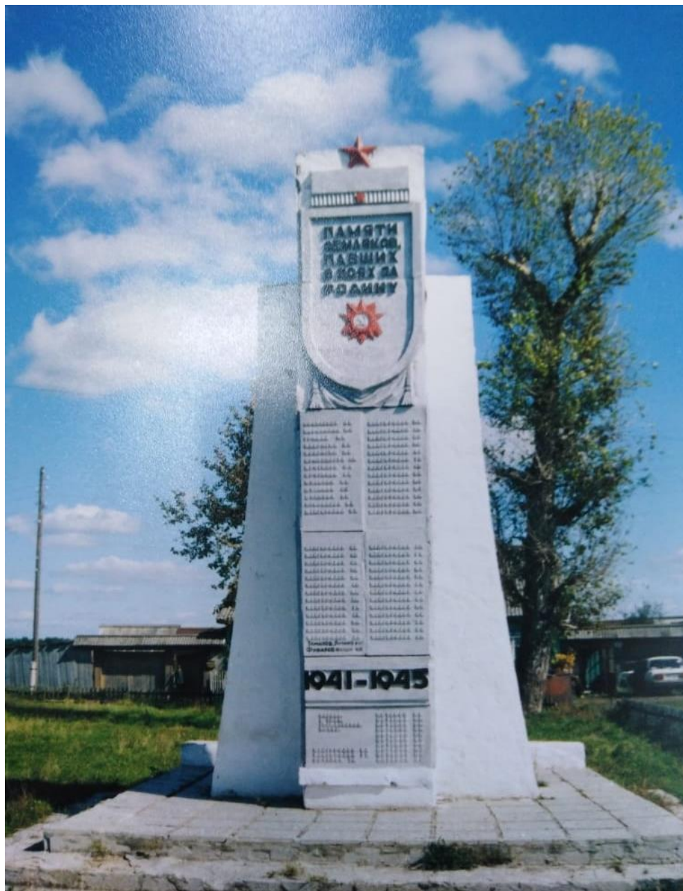
Обелиск Памяти «Памяти земляков, павших в боях за Родину. 1941-1945г.г». 80-е годы