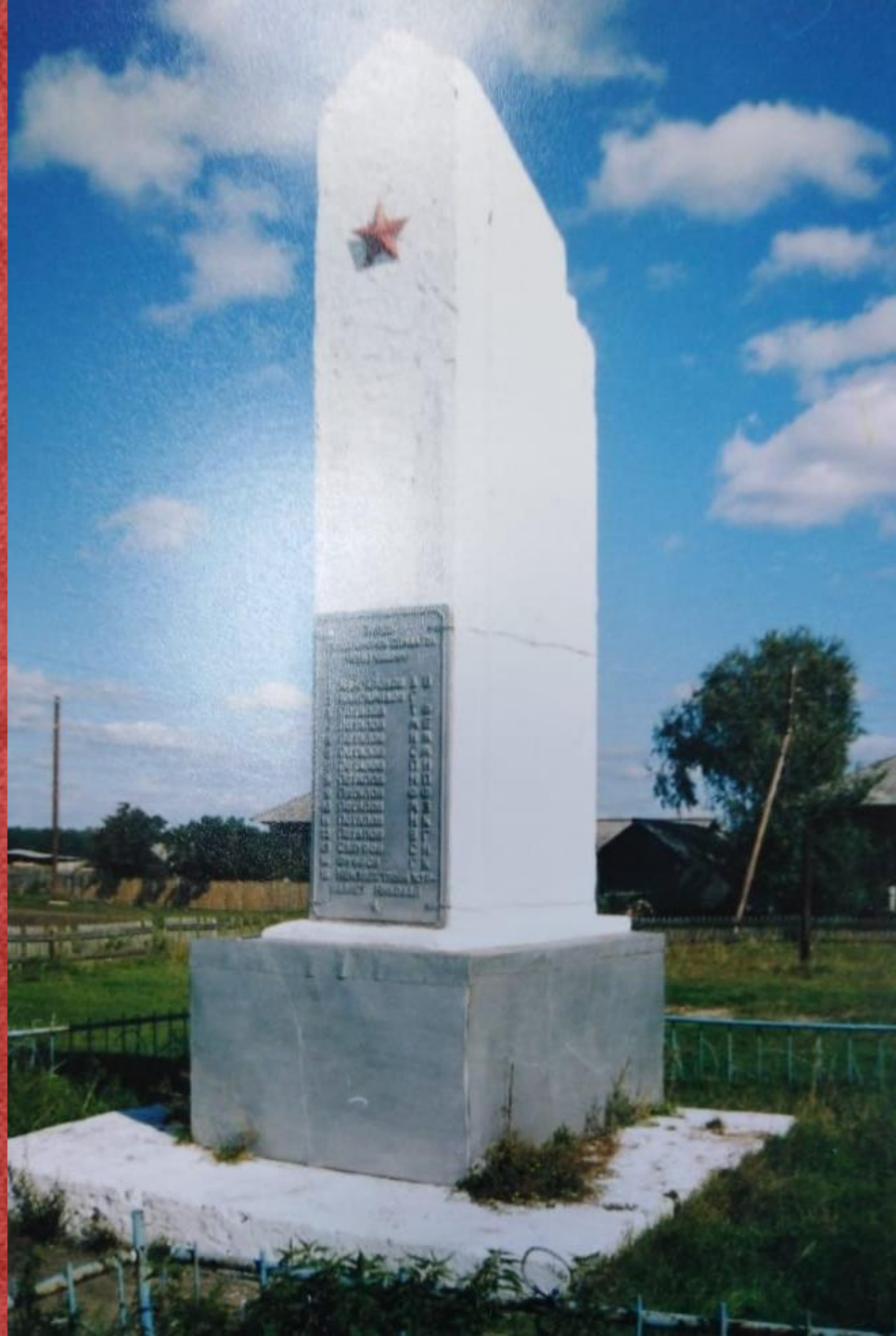
Памятник 70-е годы