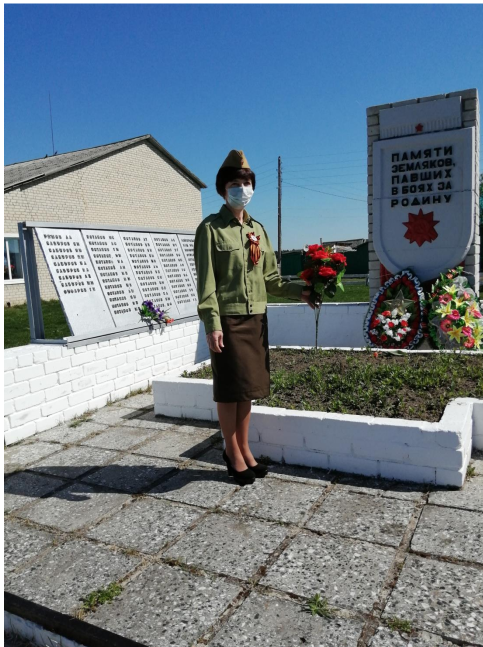
Обелиск Памяти «Памяти земляков, павших в боях за Родину. 1941-1945г.г». 2020 год