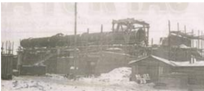
Отделение кальцинации. 5 февраля 1943 г.

А «суровая ответственность» была действительно очень суровой. Как свидетельствуют приказы тех лет, любой человек даже за один день прогула судился трибуналом и приговаривался тем к 3 годам строгого режима.