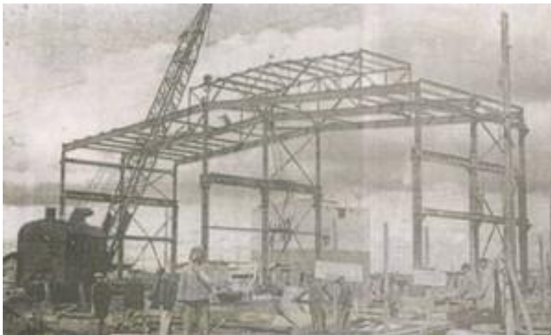
Монтаж металлоконструкций электролизного цеха. 3 июня 1944 г.

Вот так, не где-нибудь установить старенький стол между баками и насосами и там похлебать на скорую руку чаек, а пить его с толком, чувством, с расстановкой, как привыкли у себя на родине. И это в очень сложной обстановке строительства, дефицита материалов и рабочих рук.