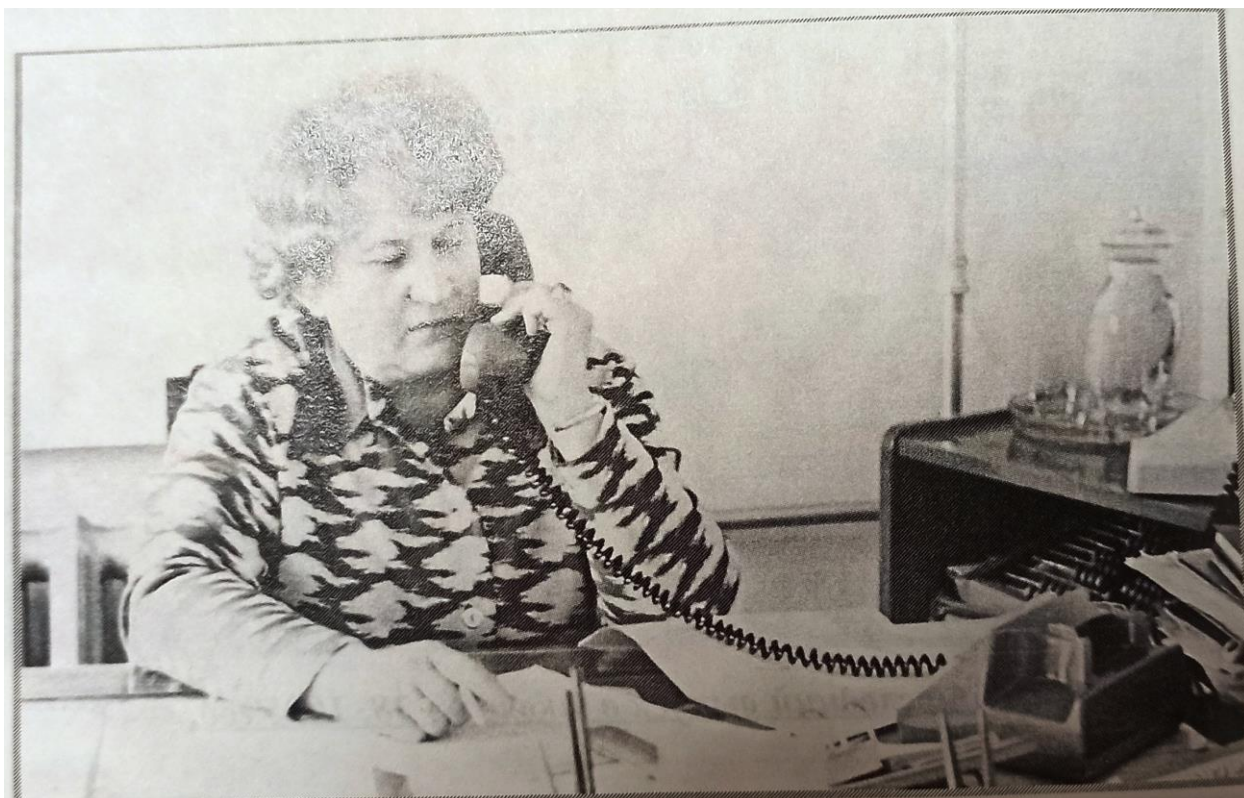
С 1977 г. по 1989 г.- работа заведующей Карпинским городским отделом народного образования.