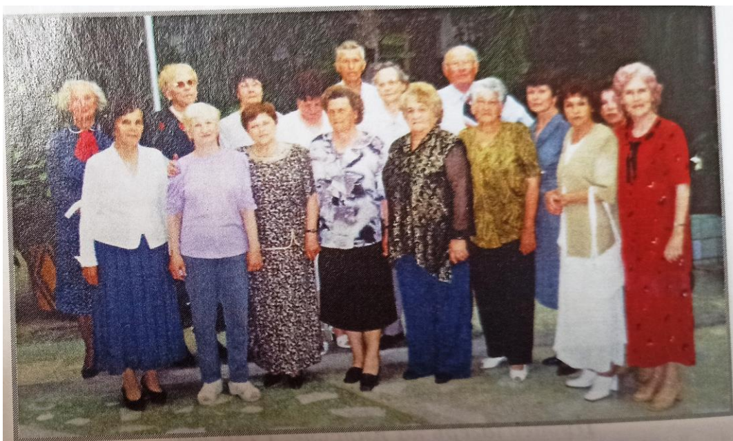
Встреча выпускников 1954 года через 50 лет, 2008 год, г. Карпинск.