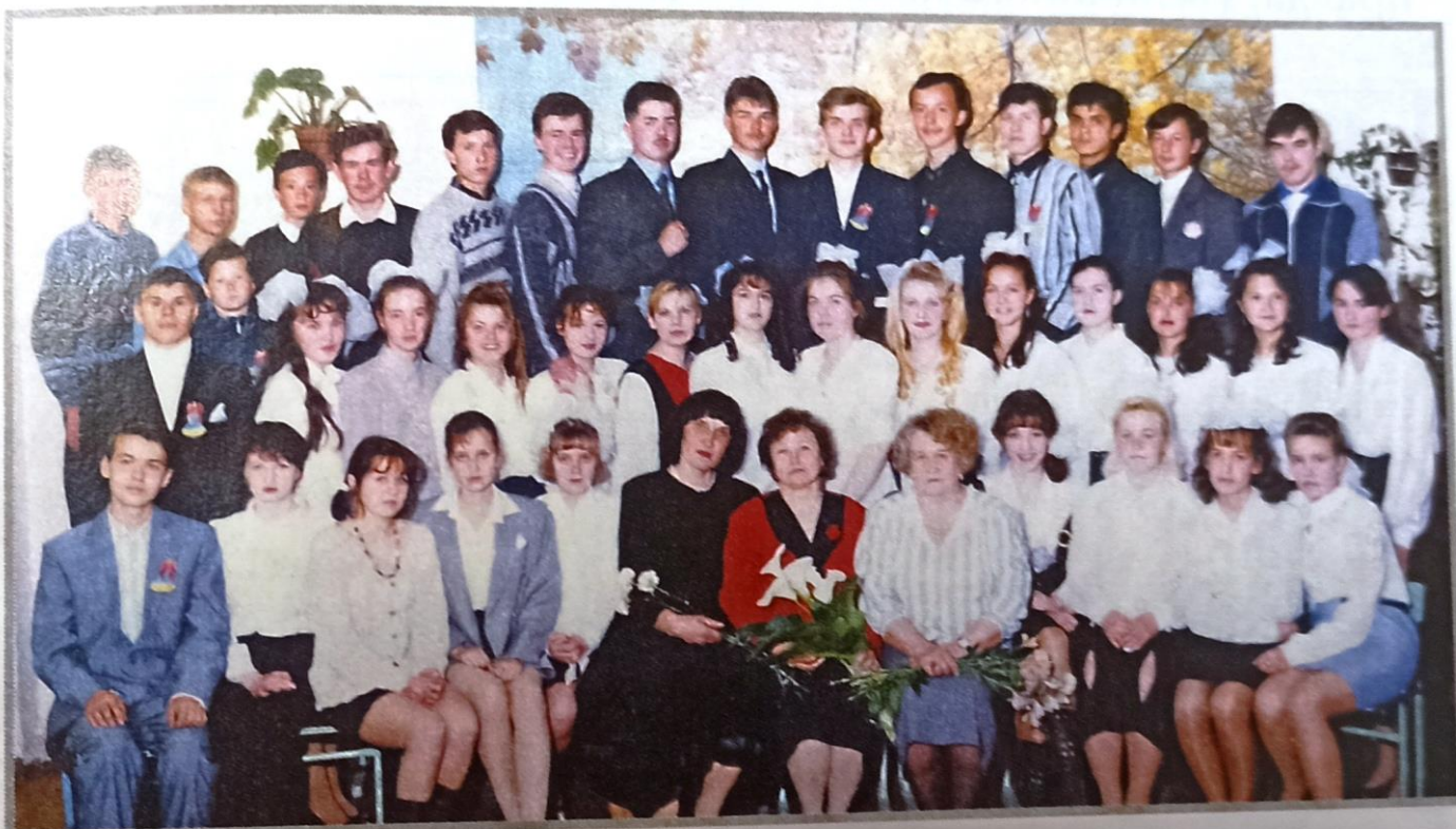
Мой последний выпуск в школе № 38, 1995 год.