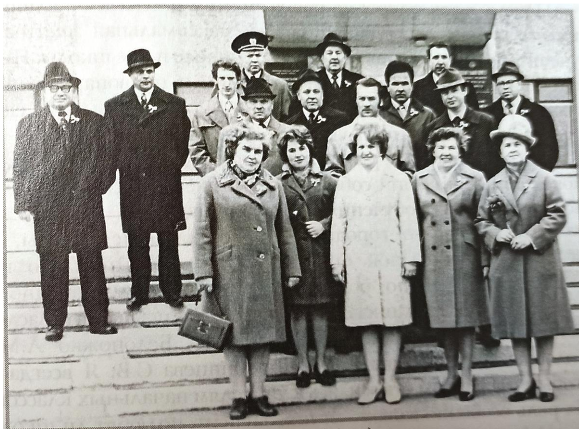
1 мая 1978 год. Перед тем как подняться на городскую трибуну.