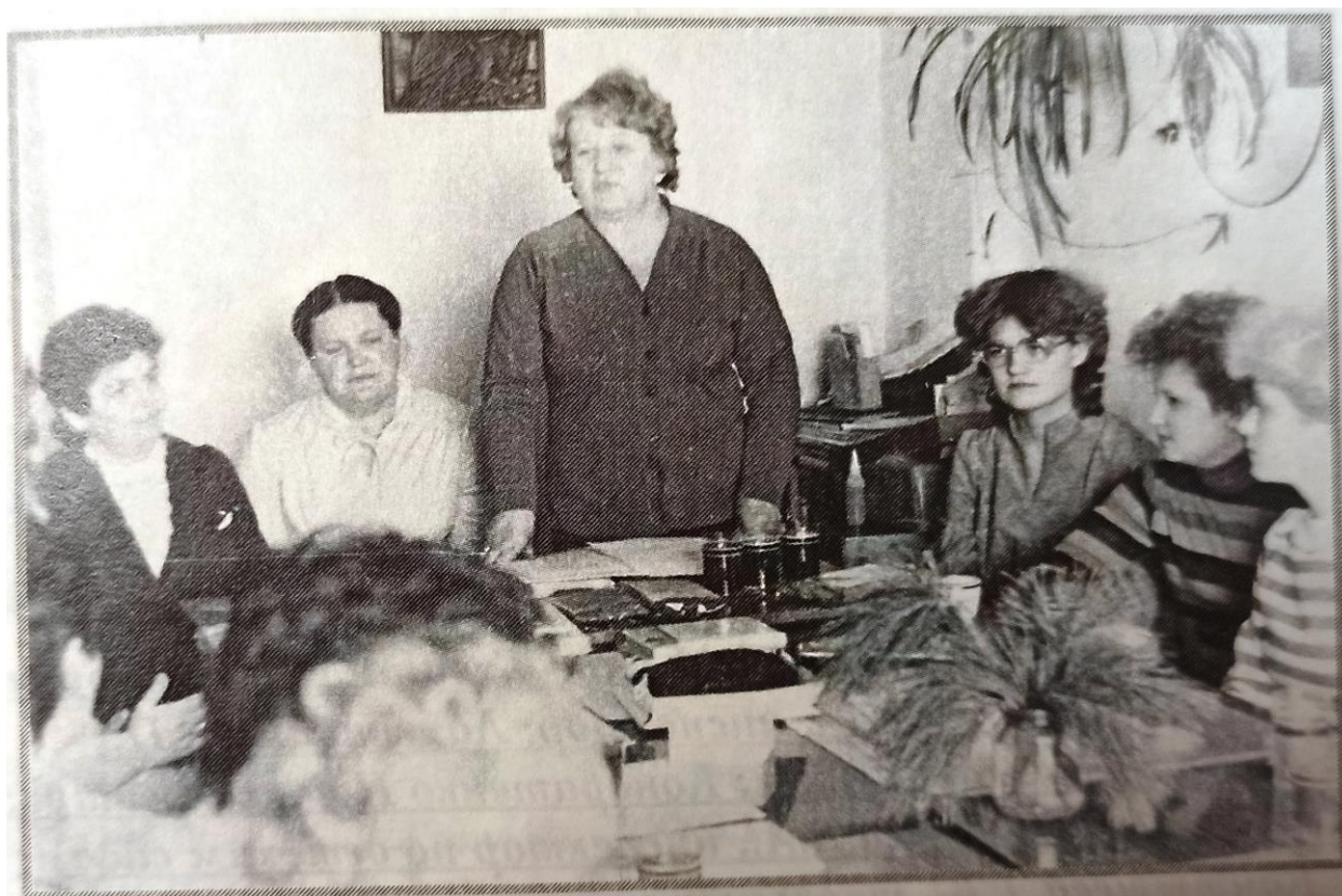
Аппаратное совещание, 1986 год.