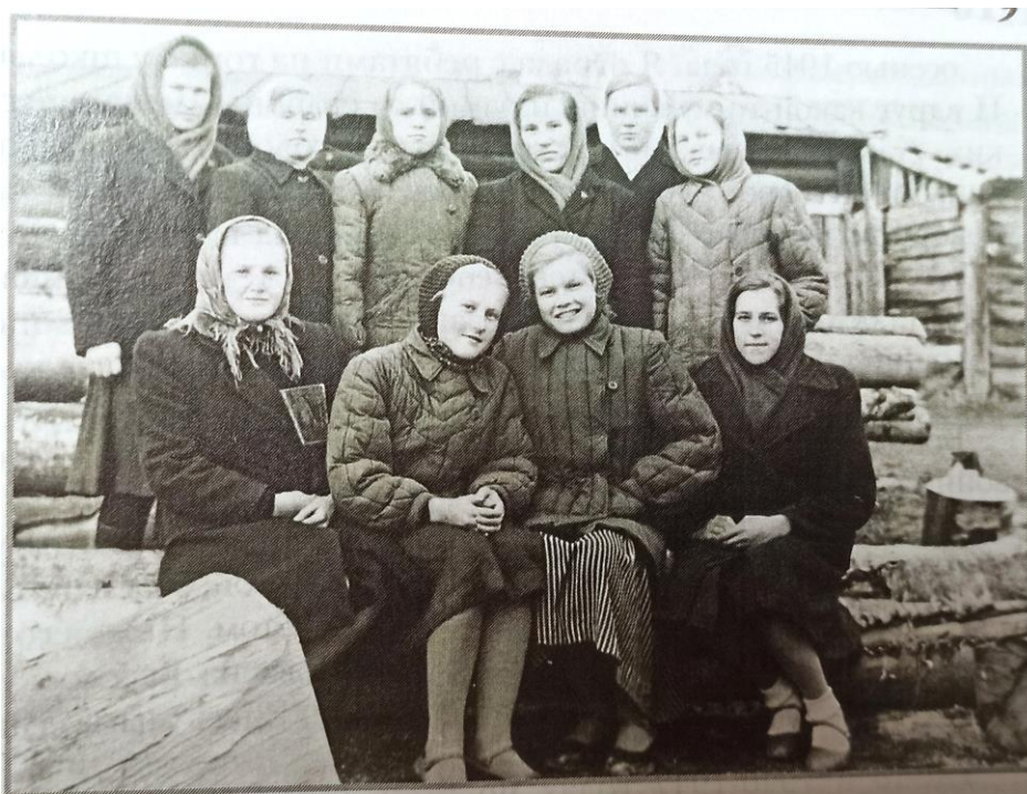
Во дворе школы № 4, 10 Б класс, 1954 год.