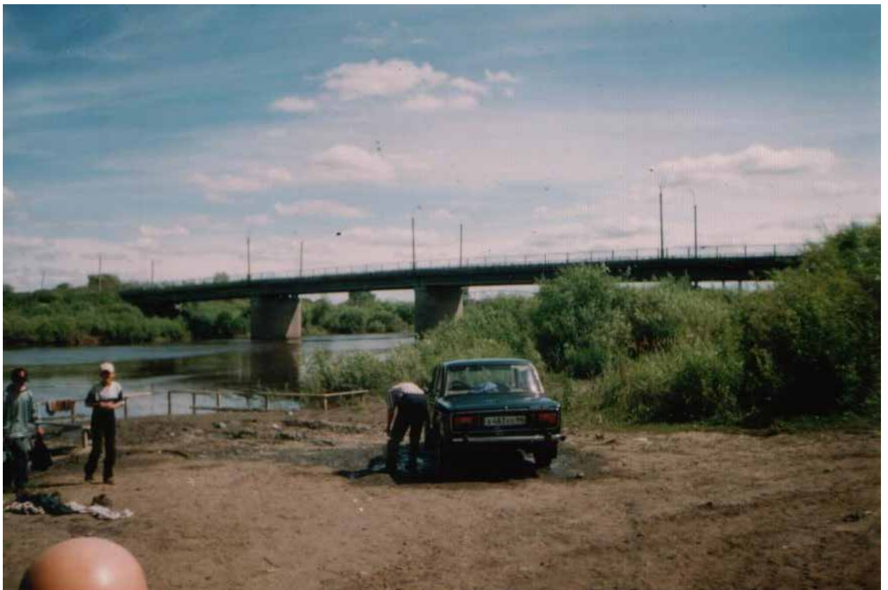
Купание «железного коня». Место впадения Серебрянки в Ницу. 2014 г.