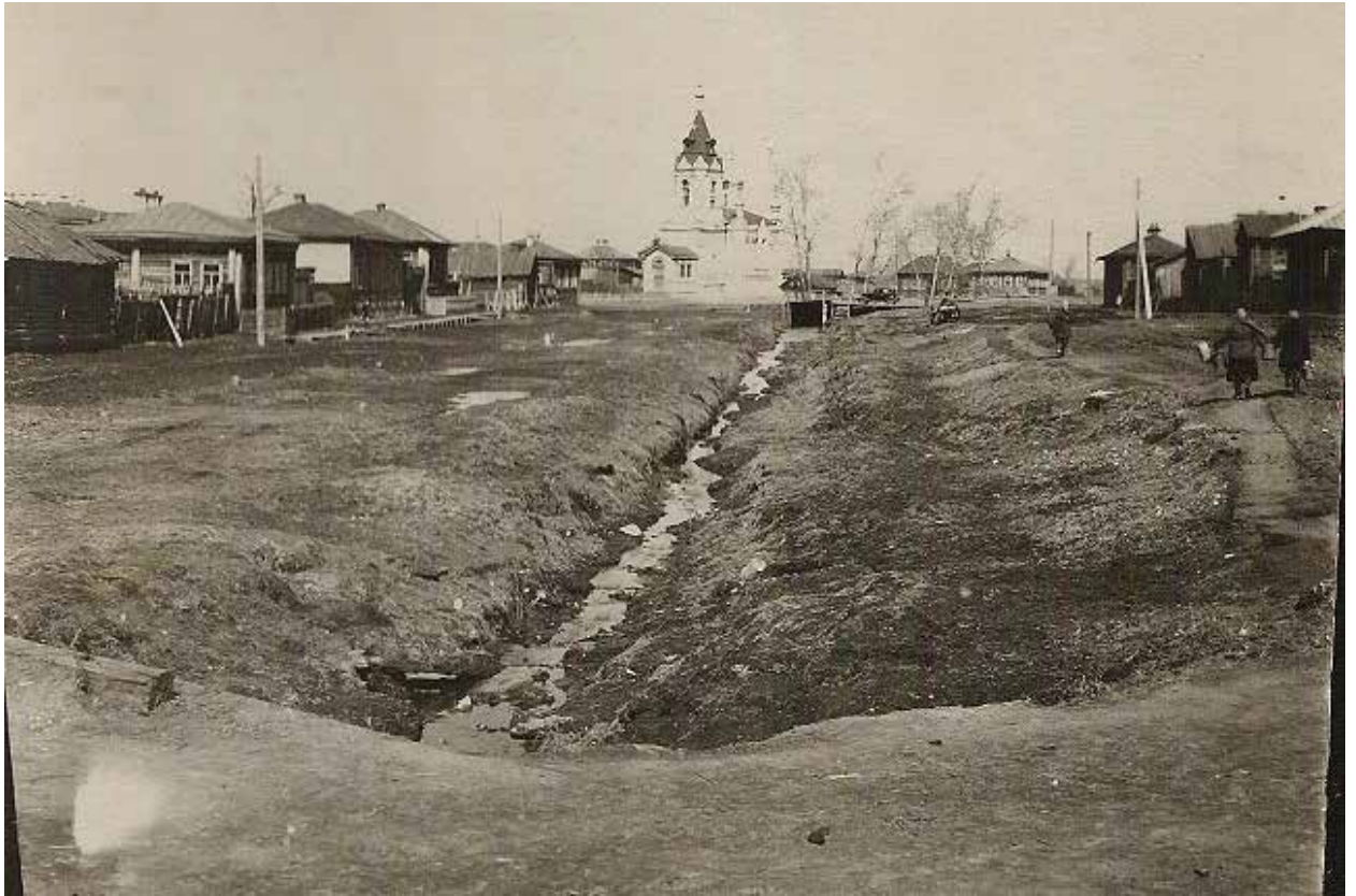
Серебрянка в засушливое лето превращалась в ручей. Фото нач. XX века