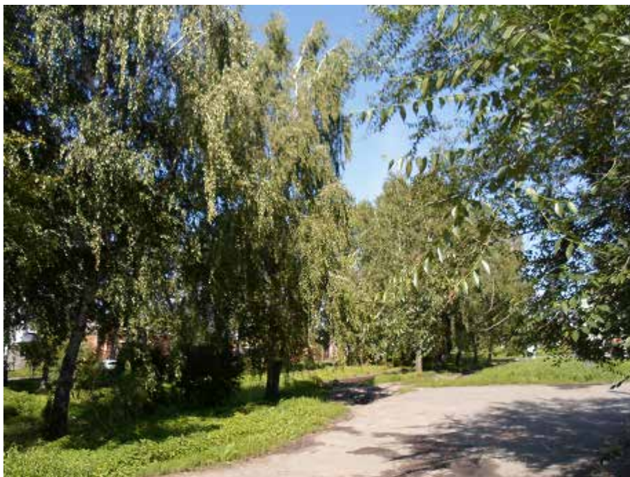
Березовая аллея на ул. Калинина (Кривой). Здесь Серебрянка под землей в трубе. 2014 г.