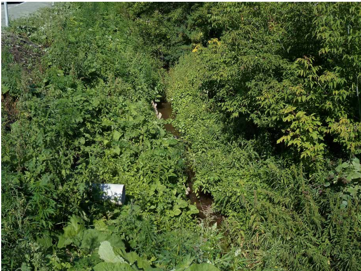
Серебрянка летом. 2014 г.