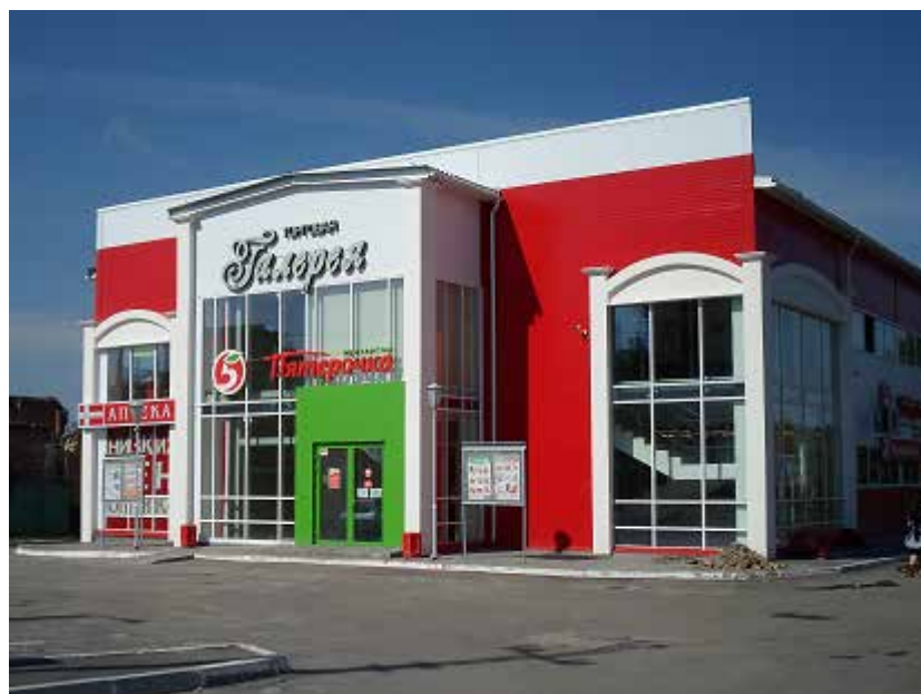
Нарядный магазин под названием «Торговая галерея» «сел» на левом берегу Серебрянки. 2014 г.