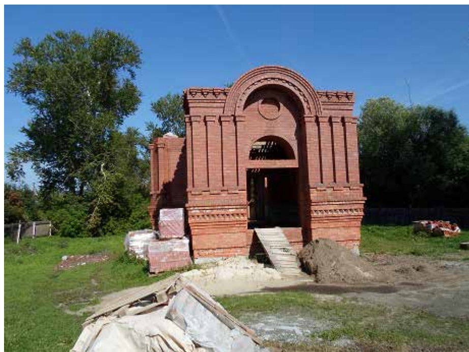
Строящийся храм – церковь во имя св. исцелителя Пантелеимона растет не по дням, а по часам. 2014 г.