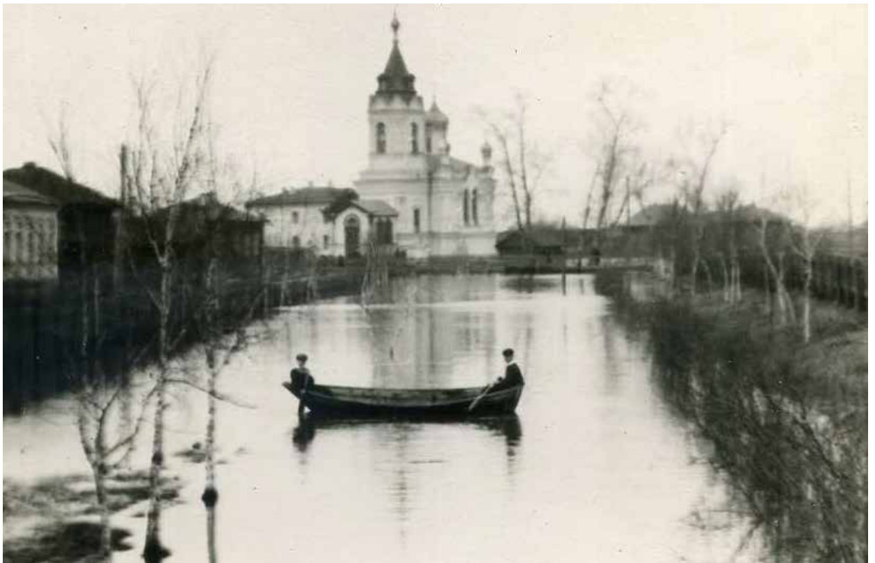
Весенний разлив превращал ручей в почти судоходную (по крайней мере, для лодок жителей) реку. Фото нач. XX века