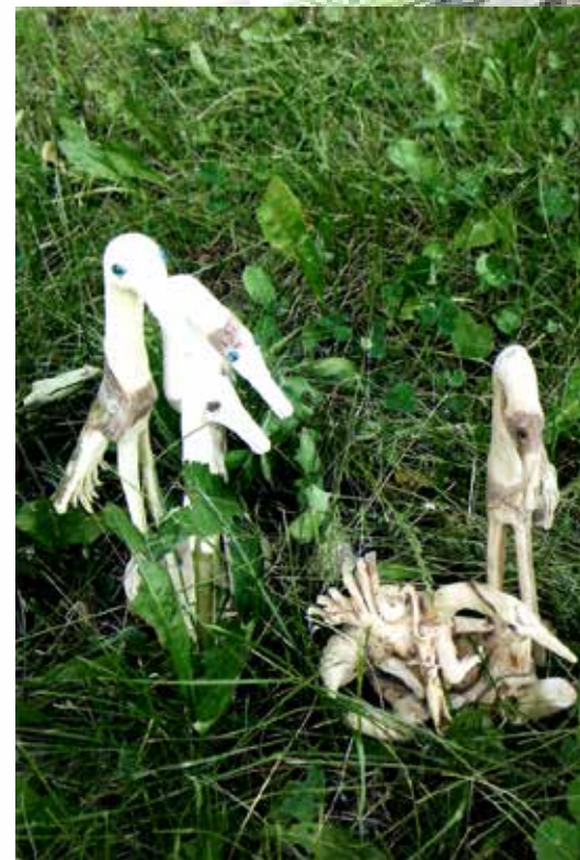
«Журавушкина семья» (16)