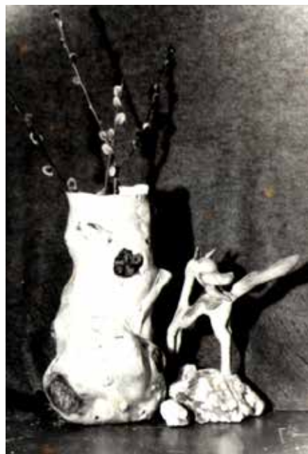
«Ваза» 1970–е годы (4;5)