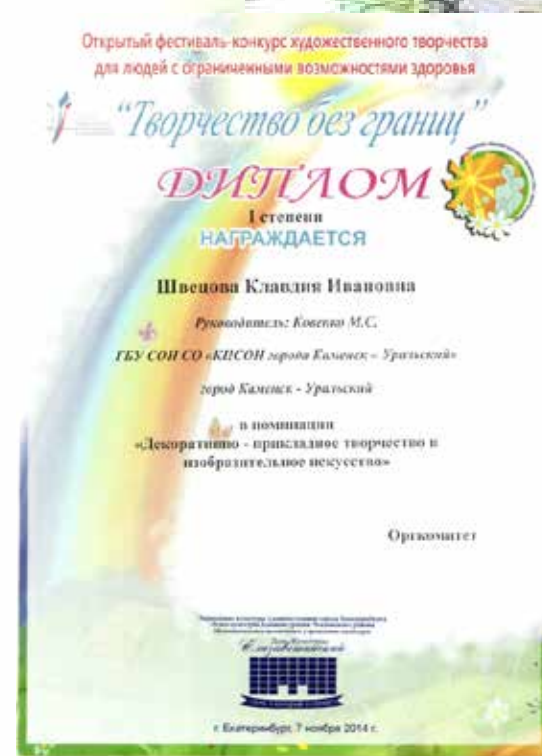
Дипломы за участие в выставках (9)