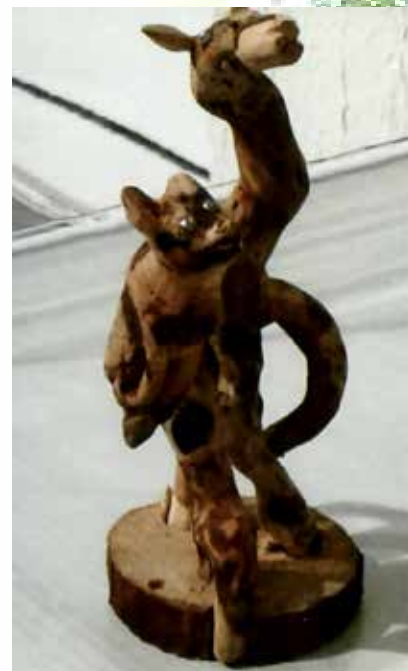
«Как решиться совершить побег» (3)