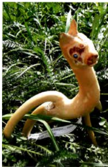
«Я могла бы побежать за поворот» (16)